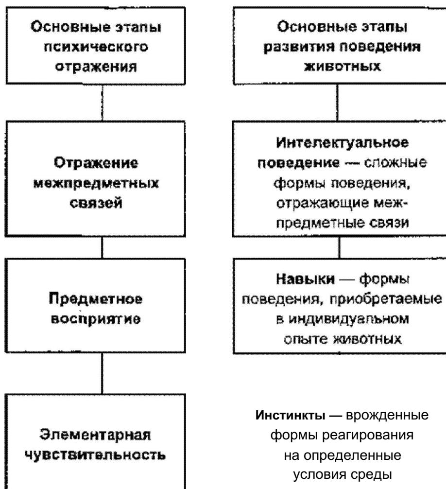
Рисунок 2 Основные этапы развития психики и форм поведения в животном мире

Большую роль в развитии психики играло изменение характера взаимоотношения живых организмов с окружающей средой. Допсихические процессы жизнедеятельности сводились к усвоению питательных веществ, выделению, росту, размножению и т. д. Отражение биологически нейтральных свойств оказалось неразрывно связанным с качественно иной активностью живых существ - поведением. Смысл этой новой формы активности заключался в том, чтобы обеспечивать биологический результат там, где условия не позволяли ему реализовываться непосредственно, сразу. Таким образом, психическое развитие живых организмов определялось усложнением нервной системы, изменением среды существования и возникновением поведенческой активности.