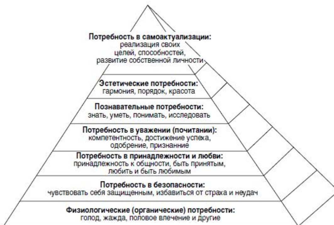
Рис. 6. Пирамида Маслоу

Йога дважды рожденных как раз и отталкивается от этого принципа – принципа счастья. Этот принцип не относится к какой-либо одной из религиозных доктрин, он универсальный. В общем-то это и есть связь человека и Бога. Хотя эта связь и не прописана через какой-то храм, через какого-то конкретного бога, через какую-то определенную норму. Но это безусловная связь, и у каждого человека такая связь через нашу йогу своя. Йога дважды рожденных максимально содействует эффективной реализации этой связи, и она способна избавить вас от человеческой драмы. Занимаясь ею, человек получает реальную возможность стать счастливым. И если кто-то и назовет мимоходом йогу дважды рожденных религией, то это воистину универсальная религия.