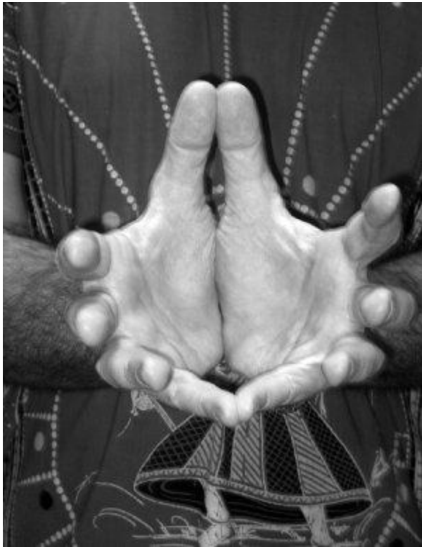
Рис. 1. Падма-мудра (раскрывшийся лотос)

Так, покачиваясь, незнакомец сидел минут пять, потом я почувствовал противный запах, какой обычно исходит от лежащих больных со старыми пролежнями. Одновременно я заметил, что из-под мальчика пошел какой-то едва заметный сизый парок, будто его положили с мороза на полку в парилке бани. Он тяжело задышал, и грудь его стала вздыматься все выше и выше, потом он как-то неестественно выгнулся всем телом. Окружающие заинтригованно зашептались и подступили поближе, сузив круг до минимума. В это время мать мальчика, заломив руки, переводила испуганные, вытаращенные глаза то с сына на мужчину, то обратно. В какой-то момент она было дернулась к мальчику, чтобы прекратить этот эксперимент, но тут мужчина встал и, подойдя к лежащему, взял его за кисти рук и потянул на себя.