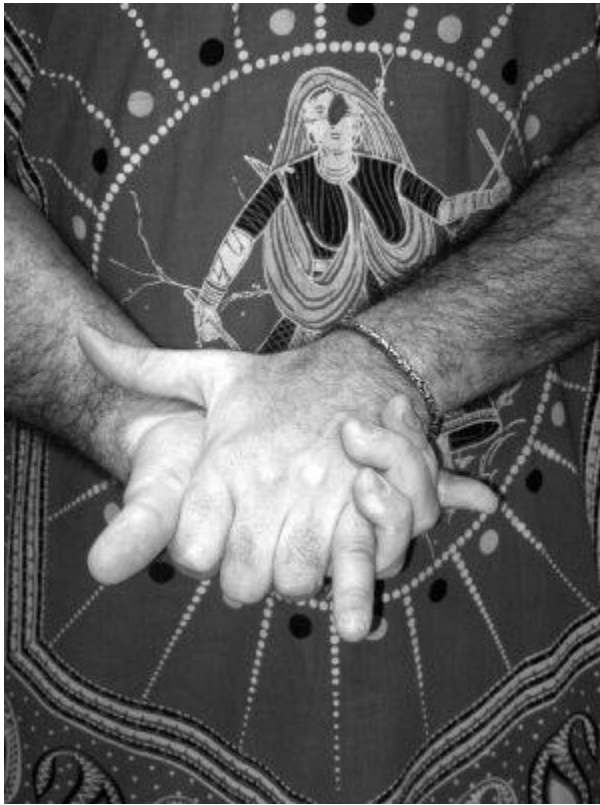
Рис. 9. Мудра-черепаха

Но у нас есть маленькая особенность: психокодов в нашем наборе ровно 365, то есть на каждый день по одному. Они принципиально делятся на три группы по целевому назначению – на обретение и поддержание здоровья, на обретение любви и на притяжение удачи. И это не случайно, поскольку они соотносятся с гармонизацией трех вышеозначенных центров: здоровье – это нижний центр, любовь – средний центр, удача – верхний. То есть, допустим, в первый день отрабатывается программа оздоровления, ему соответствует один психокод, во второй день – любовь, то есть второй психокод, и в третий – психокод на удачу. И потом снова повторяются – здоровье, любовь, удача; здоровье, любовь, удача и так далее. И так они постоянно чередуются, программируя человека на улучшение личностных качеств.