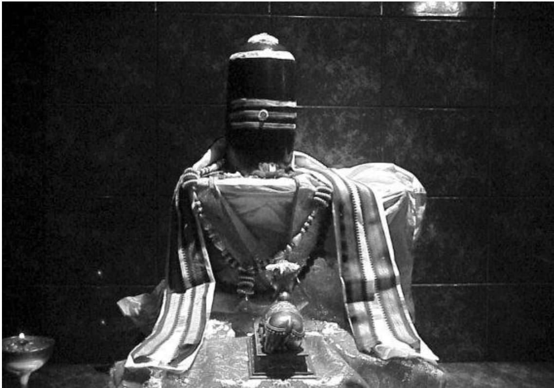
Рис. 4. Тримурти, увешанный украшениями прихожан

Тот же Пуруша после расчленения его богами впоследствии собрал себя снова, обретая силу и служа сам себе, и он стал сильнее бога. И по сути, он обрел себя вновь в новом качестве, получив свой внутренний стержень, свою внутреннюю силу, сохранив в себе одновременно и все то, чего в свое время его лишили боги, когда расформировали Пурушу на брахманов, кшатриев и всех остальных.