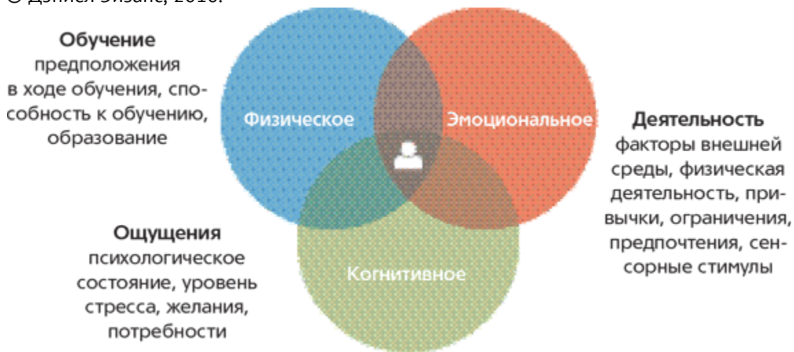
Рис. 1. Контекст пользователя включает в себя действия, ограничения, эмоции, когнитивные условия и многое другое. В свою очередь, все это влияет на взаимодействие пользователя с контентом

Это деликатная тема. Если я звоню в службу неотложной медицинской помощи в воскресенье, то мой контекст, по всей видимости, отличается от того, когда я звоню своему аллергологу в часы его работы. Если я смотрю карту метро на сайте в три часа ночи, то наверняка хочу понять, какие поезда ходят прямо сейчас, а не завтра в час пик. Когда я ищу вашу компанию в Сети с помощью мобильного телефона, то, скорее всего, хочу найти номера ваших контактных телефонов, а не детальный финансовый отчет за 2006 год. Однако наши предположения о контексте, в котором находится