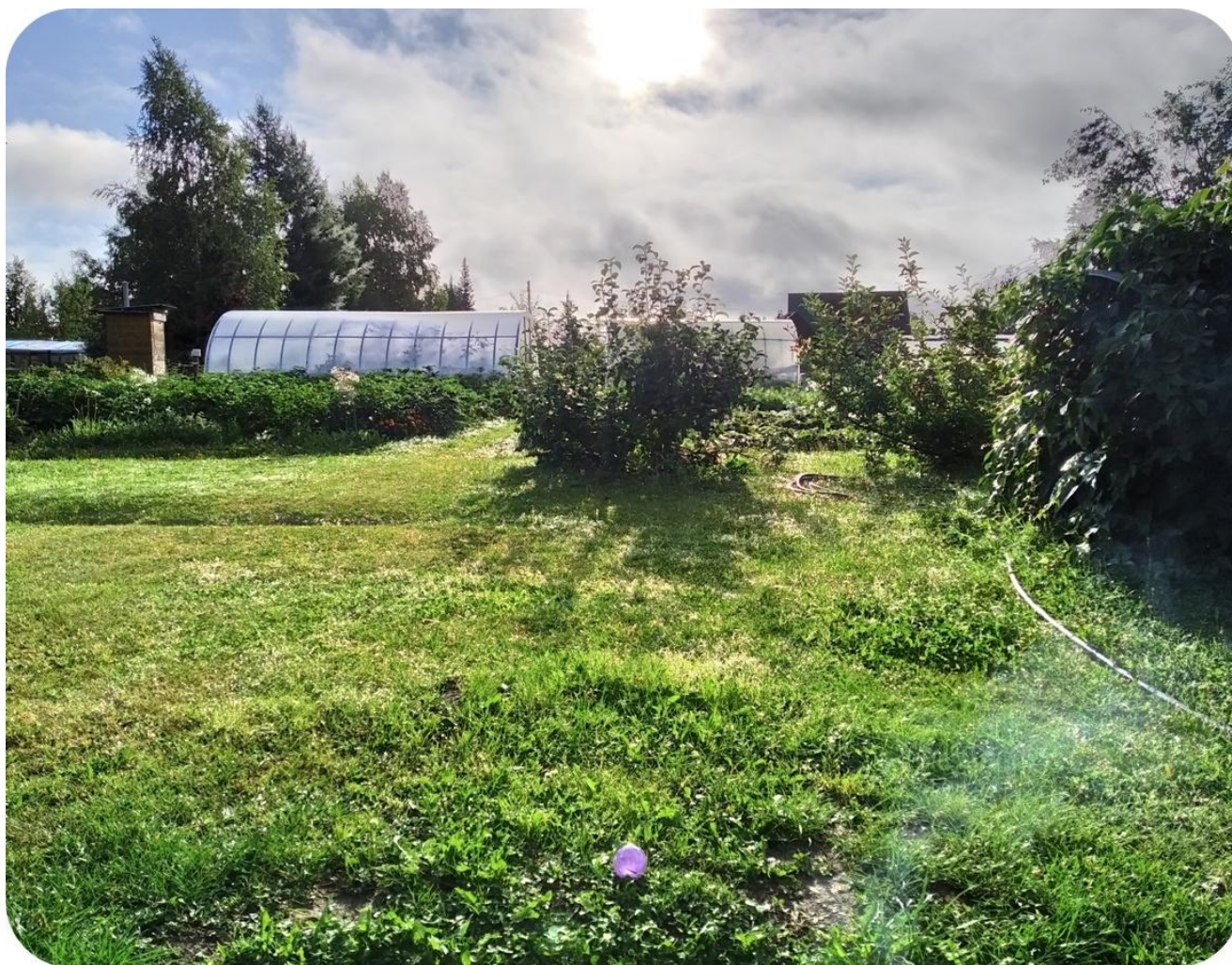
2. Ритуал на правый нижний Луч Звезды Ярилы. Дача автора. 13 августа 2023

Но кульминацией всего действия стало другое. Кострище был пепел и угли, дымок, солнце играло лучами, уже довольно высоко. Я сел на колени, в ваджрасану, позу алмаза, и сквозь закрытые глаза увидел величественную картину истинно ведического масштаба. Сложно описать. Огромные восходящие пространства Света, ярусы лингамов Шивы, сам Господь Шива, его фигура, его Присутствие, его Бытие всепоглощающее, всепроникающее. И как бы слова, точнее, фон – "Такого на Земле раньше не было". Относящиеся, как я понял, именно к действиям той самой русской технической точки, и к результатам этих действий.