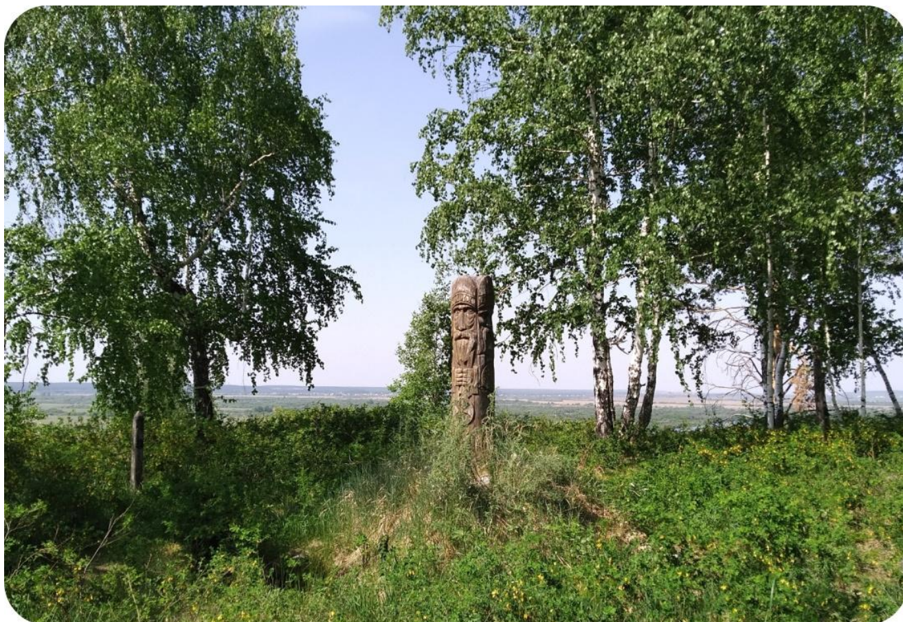
1. Капище Световита на горе Всебожья. 4 июня 2023

Нафотографировал там кучу красоты, видео наснимал 13 . Место наше по-прежнему живое, рабочее, и даже чистое, если чуть вверх на 1-2 слоя пространства приподняться, несмотря на деятельность несколько лет назад присоседившихся язычников. Не сибирских йогов вроде нас, а именно настоящих кондовых язычников, которые однажды нашли наше Капище, и решили приспособить его для своих целей. Пообщался со стихиями, принёс богам жертвы из того, что было с собой (вода, хлеб, мате, ароматические палочки, цветы). Почитал вслух славления и стихи. Посидел, подышал, пространство стало заметно чище, ожило, зазвенело. Лики чура Световита ожили, засветились внутренним светом, в глазах ликов высокое сознание проступило. То есть, как я сразу и почувствовал на входе, пространство живое, сразу откликается, и как та избушка на курьих ножках нужной стороной к правильному гостю поворачивается.