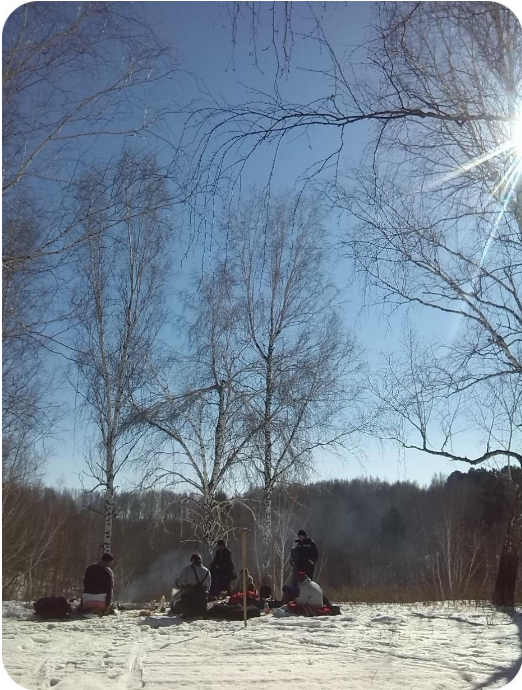
5. Сибирские йоги на Капище. После огненного ритуала Ярилы. 21 марта 2016

обеспечивая результат предполагаемый этой Традицией . И это то, что я выше назвал – Совершенство.