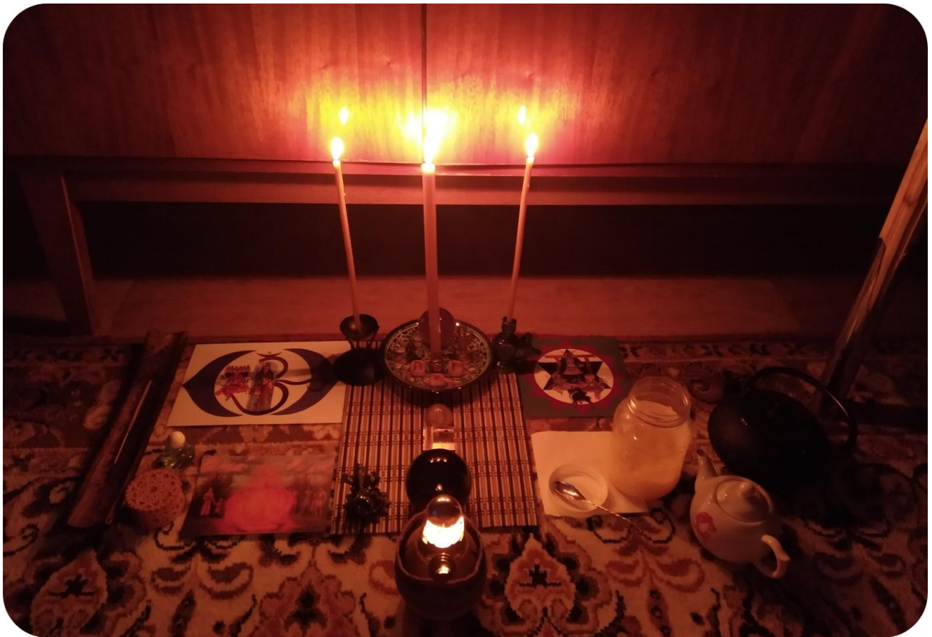
4. Домашний ритуал на левый верхний Луч Звезды Ярилы. 5 января 2024

Солнцем. Образ повторяется в медитации не раз, Солнце раскрывалось всё больше, проступало всё ярче.