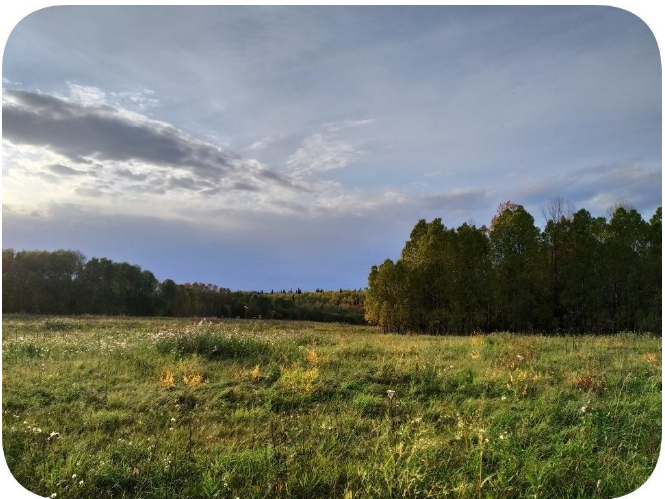
7. Поле после медитации на полнолуние. 10 сентября 2022

Сома разлилась полнолунная... Всё пропитала, оживила всё, мягкость, умиротворенность, лад. Как у Кришны за пазухой. Русь у Кришны за пазухой.