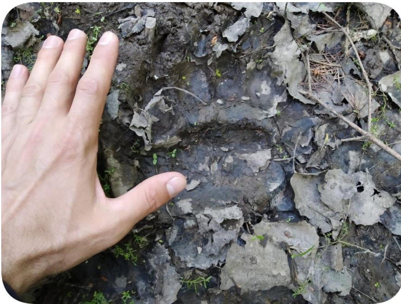
6. Свежие следы медведя. Июнь 2021