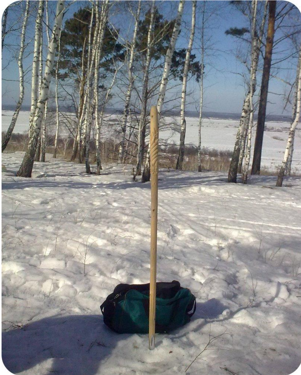
3. Жреческий посох Ярилы. После огненного ритуала Ярилы на Капище. 21 марта 2016

хотя бы рубаху красивую. Водичку родниковую берём, естественно. Мате хорошее. Ароматические палочки – стихию воздуха добавить в процесс. И другое. Думаю, смысл понятен. Так я соорудил свой алтарь-мандалу, приготовил асан (место для сидения), и за час до восхода Солнца уже возжёт свой огонь, сидя лицом на восток.