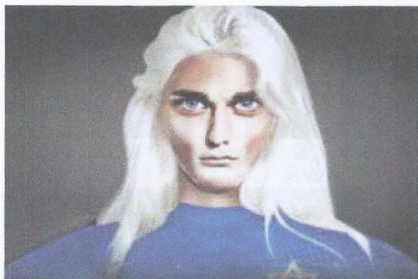
Рис. 11. Нордики