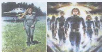
Рис. 9. Высокие нордики