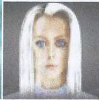
Рис. 4. Нордики, живущие в центре Земли