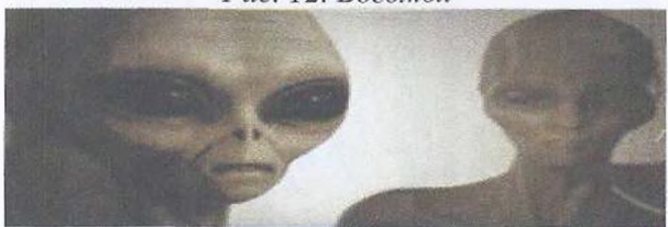
Рис. 13. Серые