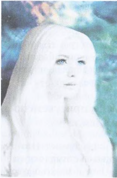
Рис. 3. Андромедянка