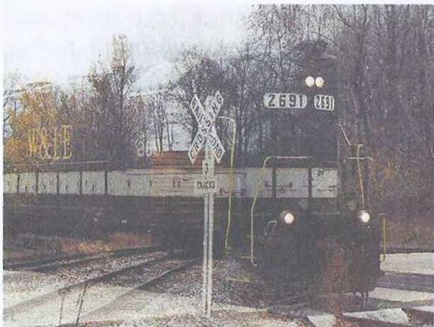
Фото 1. Пересечение пейзажей двух миров

свои произведения, можно было почитать эти произведения. А сейчас ничего нет. Ни видов гипноза, ни скрытых способов гипнотизирования - ничего неизвестно. В XIX веке можно было в какой-то степени ознакомиться с ними. Была школа Шарко, Ледбитера, исследования Дюрвилля, дэ Роша, ... - хотя последние, это не школы, а научные исследования, но они раскрывают суть того, почему нами можно управлять и как управлять.