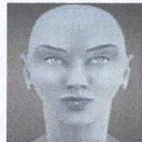
Рис. 5. С голубой кожей