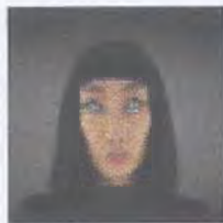
Рис. 7. Монголоиды