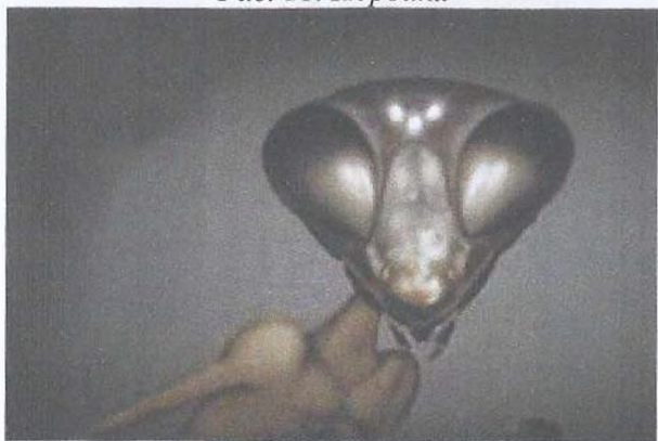
Рис. 12. Богомол