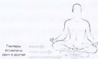
Рис. 3. Кулон

ставляет собой гампер без нижней части, вставленный в другой гампер (рис.3). Способствовал нарастанию у человека потенциала, что вело к открытию новых форм видения.