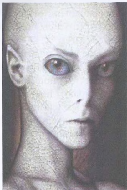
Рис. 15. Женщина рептилия