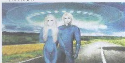
Рис. 8. Плеядцы