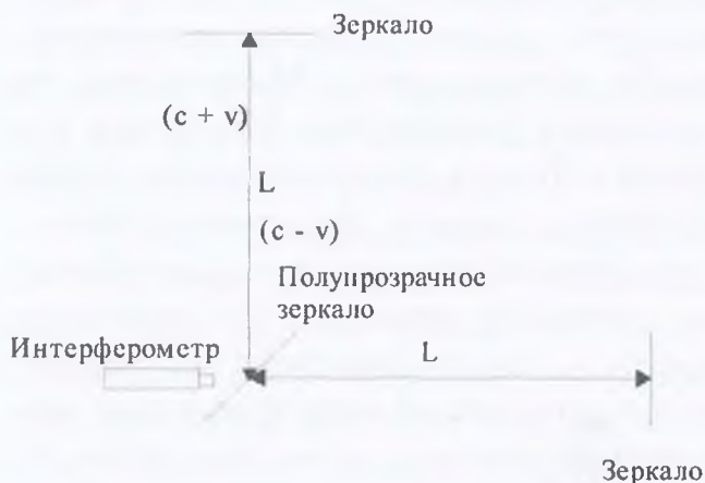
Рис. 1. Схема установки опыта Майкельсона

Земли, другой перпендикулярно к её движению и, проходя одинаковое расстояние L , отражались от зеркал, установленных перпендикулярно на их пути в обратном направлении. Оба луча попадали в интерферометр, где должна была быть, по мысли Майкельсона, зафиксирована (в случае наличия эфирного ветра) интерференция. Но интерференции не наблюдалось, это и послужило толчком для Эйнштейна сделать абсурдный вывод, что скорость света всегда постоянна и не зависит от источника движения. Другими словами, как бы что, ни двигалось относительно всегодвигающегося или покоящегося, скорость света, по мысли Эйнштейна, остаётся постоянной.