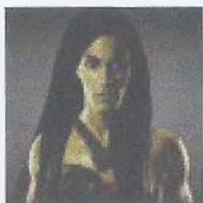
Рис. 6. С зеленой кожей