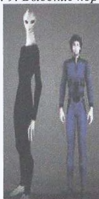
Рис. 10. Высокие серые