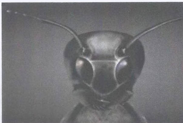
Рис. 14. Муравьиноподобные