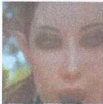
Рис. 4 Серые, управляются белыми инопланетянами с острыми ушами, представленными на данном рисунке