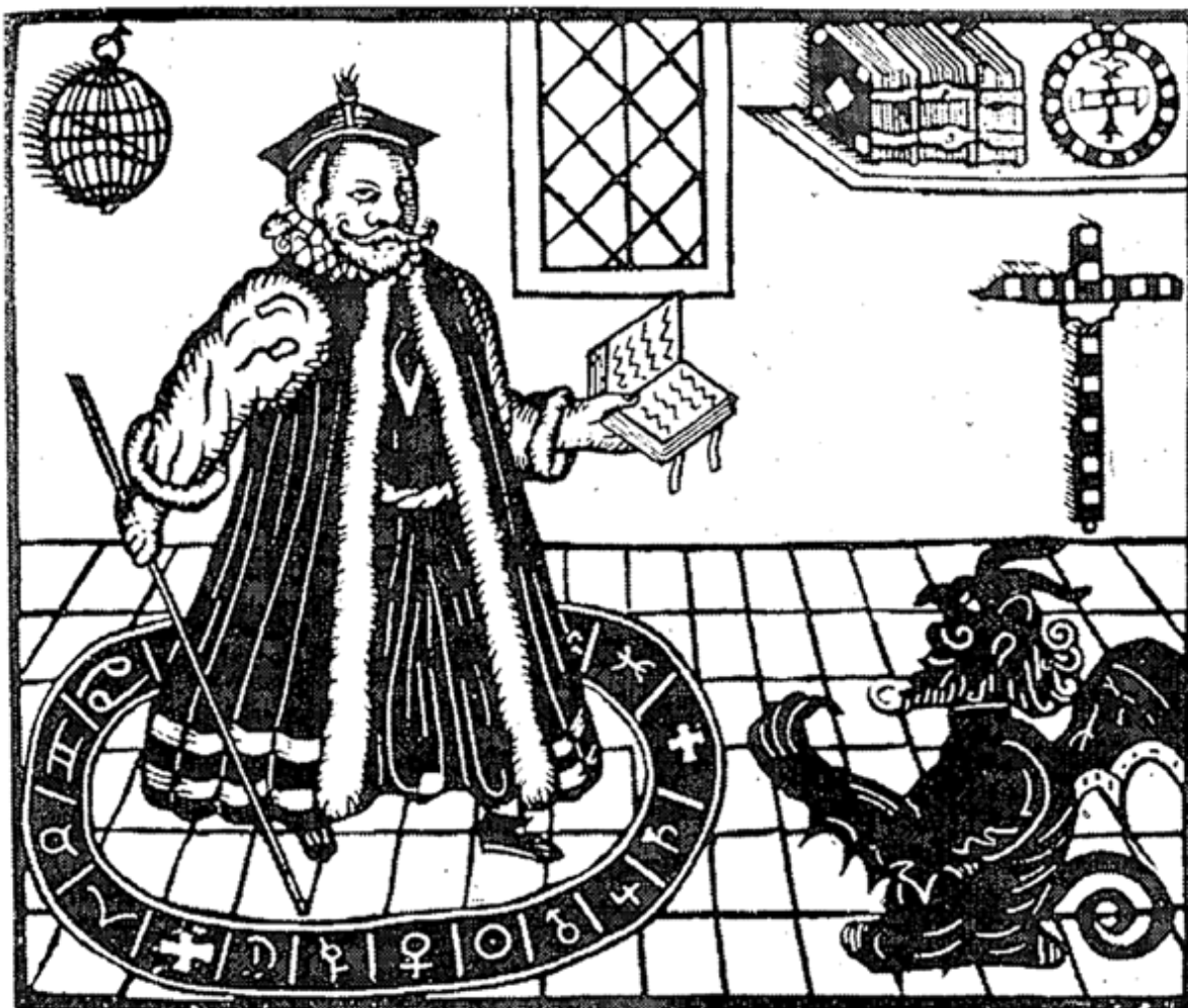
Фауст в магическом круге вызывает Мепистофеля. Из «Трагической истории доктора

три раза перед тем, как он появится в заранее очерченном для него круге. Он достает богатства и любую вещь из любого края, согласно пожеланиям волшебника. Он быстр, как человеческая мысль». (Вот этот «симпатичный» коротышка и свернул своему подопечному шею.) В легендах о Фаусте (например, изданной в 1587 году народной книге Mephostofiles), Асиелю было присвоено «говорящее» имя. Его произвели, скорее всего, от еврейского mephiz - «разрушитель» и topfel - «лжец».