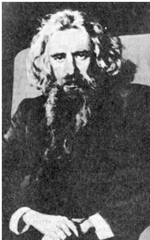
Рис. 16. Владимир Соловьев, любовник «Софии»

жил с Софией счастливо; она внушила ему мысль найти и издать произведения Якоба Беме.