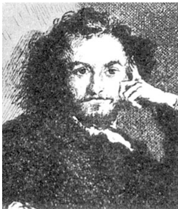
Любитель тления Бодлер

вызывает у публики оживленный интерес – никто еще не замечает в нем безумия. Эмиль Золя даже пишет: «Мопассан является выразителем здоровья и силы нашей расы. Ах, какое блаженство иметь право прославлять, наконец, одного из наших, человека с доброй, светлой и солидной головой, создателя прекрасных фраз, блестящих, как золото, и чистых, как бриллиант!»