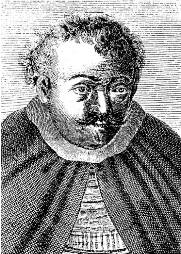
Фауст. Гравюра XVII века

Филипп Меланхтон: «Однажды в Нюрнберге ему в самом начале трапезы стало жарко. (Видимо, он уже почувствовал под собой костер.) Он тотчас же встал и заплатил хозяину, что был должен. Только он вышел за дверь, как тут же явились сыщики и спросили, где Фауст».