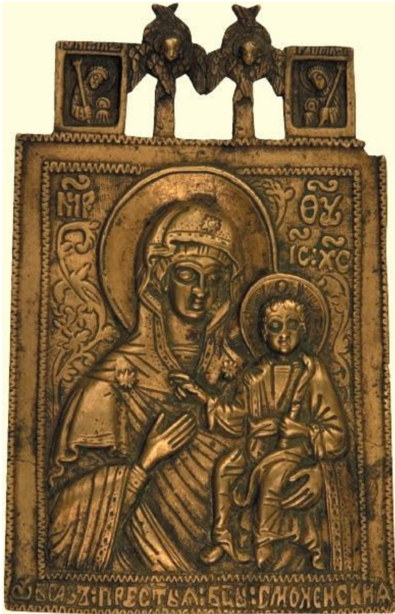
ИКОНА БОЖИЕЙ МАТЕРИ