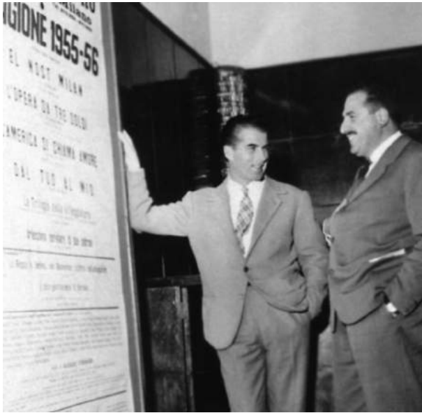
Паоло Грасси и Джорджо Стрелер на фоне афиши театра. 1956

было играть свои спектакли, репетировать, работая над новыми проектами. Постоянной стала и группа сотрудников, обеспечивающих деятельность театра: дирекция, технический персонал (рабочие сцены, портные и т.д.), работники архива, преподаватели школы при театре. Все они и всегда имели ежемесячную зарплату. (Когда-то этот аппарат был совсем небольшим, теперь же он разросся до огромных размеров.) Постоянной труппы как не было, так и по сей день нет. Конечно, у «Пикколо» всегда была группа своих актеров, из числа которой главным образом и набирались исполнители для каждого спектакля. Но все актеры и всегда работали только по контрактам, которые заключались лишь на время конкретной постановки. Поэтому в перерывах между спектаклями они много работали в других театрах и с другими режиссерами. Хотя основным делом жизни большинства из них оставался «Пикколо». Тем не менее то, что государственные драматические театры в Италии все-таки появились, несомненно, большой шаг вперед. Это можно считать почти