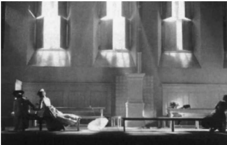
Декорация спектакля по пьесе Готтольда Эфраима Лессинга «Минна фон Бархельм». 1983

Почти каждая сцена нового спектакля еще нуждалась в серьезных добавлениях и уточнениях. В самой первой картине — очень важной для понимания общей концепции спектакля — рисунок в целом был найден, но некоторые принципиальные частности еще не имели ясных очертаний, да и пока не давались. Поэтому репетиция за репетицией Стрелер все возвращался к самому началу спектакля, ставил свет, уточнял музыкальное сопровождение, вновь проходил с актерами самую первую сцену.