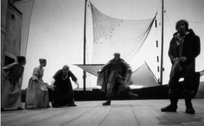
Сцена из спектакля по пьесе Карло Гольдони «Кьоджинские переделки». 1992

просмоленных досок, под прямым углом идущих к рампе, — то ли пол в доме рыбака, то ли палуба. На сцене возле домов сидят две группы женщин, очень молодых и не очень, на коленях у них барабаны — они плетут кружево. И мирно беседуют: