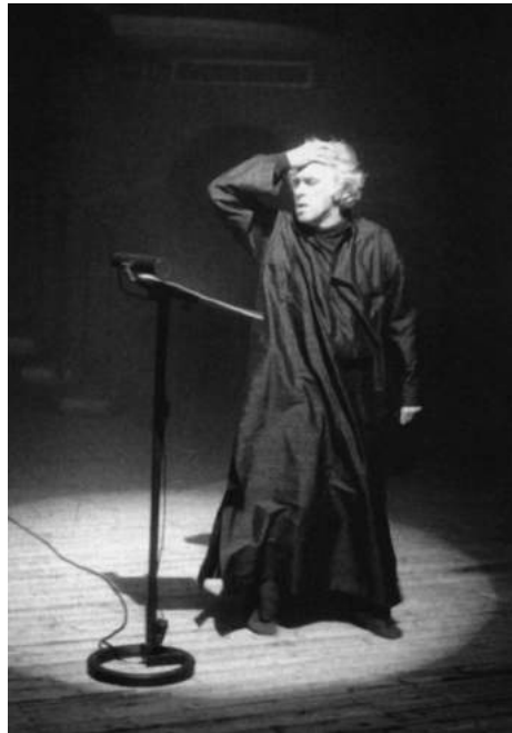
Джорджо Стрелер в спектакле «Фауст» по Иоганну-Вольфгангу Гёте. 1988–1989

«Фауст», ожидаемый, встреченный с огромным интересом, принят был неоднозначно. Декорации, постановку массовых сцен, хореографию, музыку хвалили все. Однако патетичный, декламационный стиль игры, выдержанный на протяжении всего спектакля всеми исполнителями, начиная с Джорджо Стрелера, вызвал возражения. Кроме того, Стрелера со всех сторон резко критиковали за то, что он сам взялся играть роль Фауста. Хотя для него это было важно — принципиально. В каком-то смысле