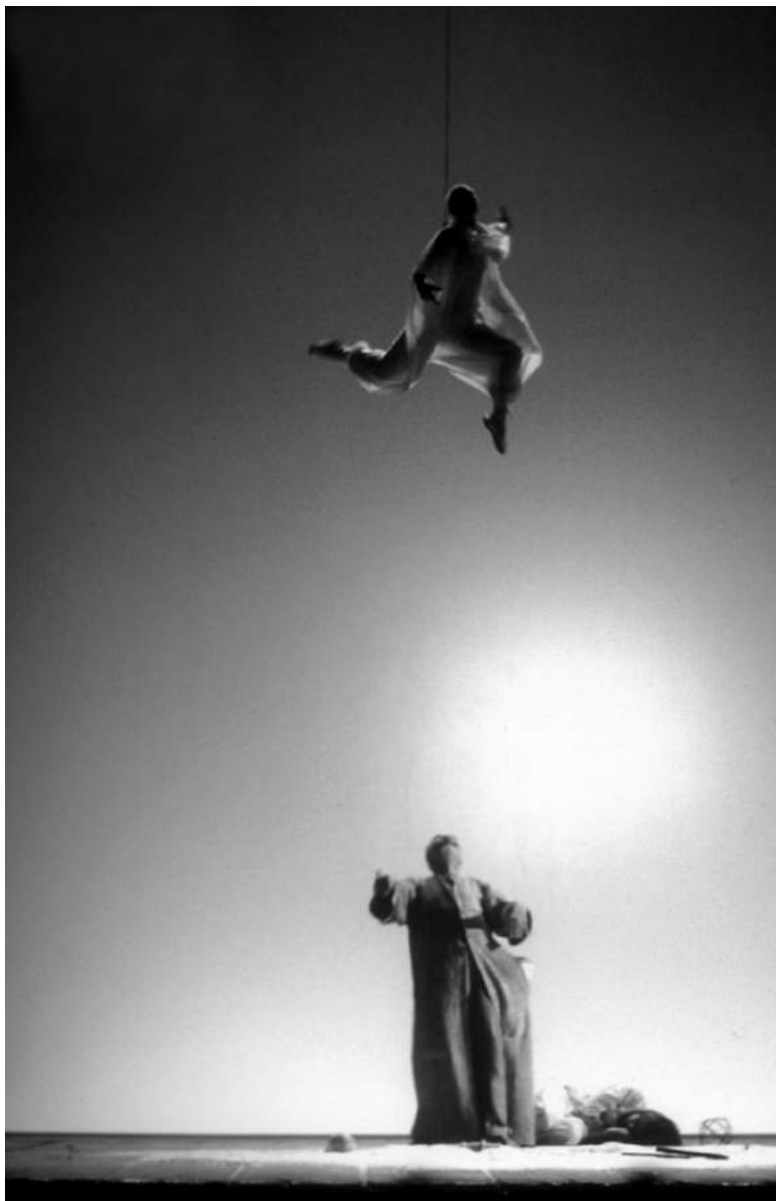
Сцена из спектакля по пьесе Уильяма Шекспира «Буря». 1980