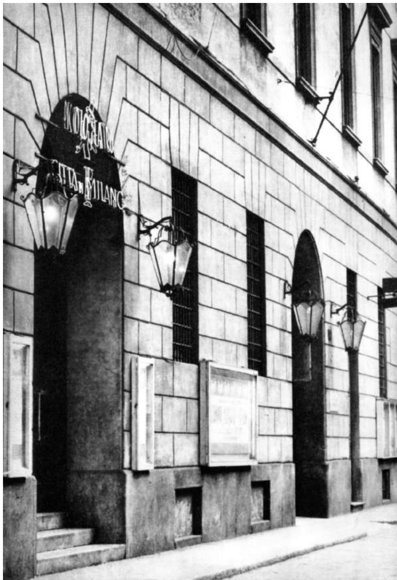
Вход в «Пикколо театро ди Милано» на улице Ровелло. 1952