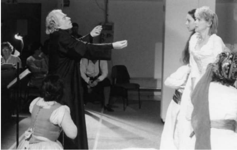
Репетиция спектакля по опере В.А. Моцарта «Так поступают все женщины». 1997

сезона. В конце сезона он обычно выпускал главный свой спектакль. В тот год он планировал завершить его «Мемуарами», а для открытия новой сцены выбрал Моцарта – заключительную часть трилогии о любви «Так поступают все женщины» 1 . Репетиции начались в первых числах декабря, премьера была назначена на январь. Работа шла радостно, весело, легко, и спектакль обещал стать удачным. Последняя репетиция состоялась 23 декабря 1997 года. В тот день Стрелер неожиданно для всех, вне плана, провел репетицию финальной сцены, не спеша, тщательно, подробно отработывая все детали. А после этого сказал: «Вы хорошо поработали. Я доволен вами. Поэтому это старое “чудовище” делает вам подарок. Дает вам еще один день отдыха (аплодисменты). 27 декабря меня не будет. Увидимся 28-го» 2 . И уехал в Лугано. На следующий день было Рождество. Стрелер отпраздновал Рождество в небольшой кампании своих друзей