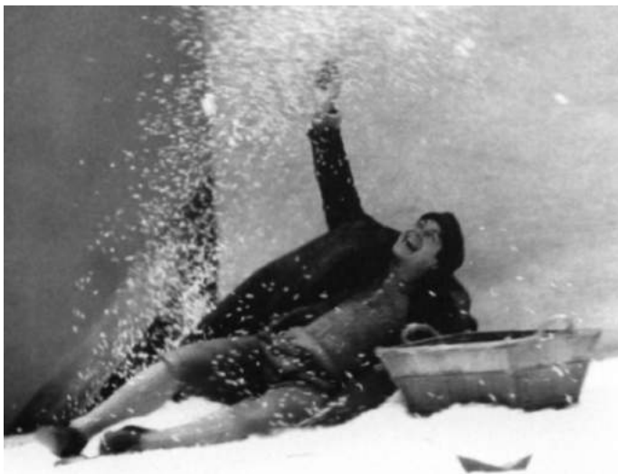
Спектакль «Кампьялло» по пьесе Карло Гольдони. 1974–1975. Сцена со снегом

дальнейшее развитие. «Кампьялло» – спектакль о Венеции прошлого и настоящего, о тревогах нашего времени, о мире и вечности и, как это часто бывает у Стрелера, немного и о нем самом. Как говорил режиссер: «Нет ничего менее реалистичного, чем “Кампьялло”, и нет ничего более реалистичного, чем «Кампьялло» 1 .