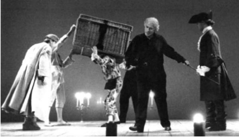
Репетиция спектакля «Арлекин, или Слуга двух господ» по пьесе Карло Гольдони. Последняя редакция. 1990–1991

сравнимой театральной радости этого спектакля и глубокой его печали. Не забыть его «солнечной меланхолии». В последнем «Арлекине» вновь сошлись и те образы природных стихий, что так важны были Стрелеру для создания его картины единого и всегда меняющегося мира.