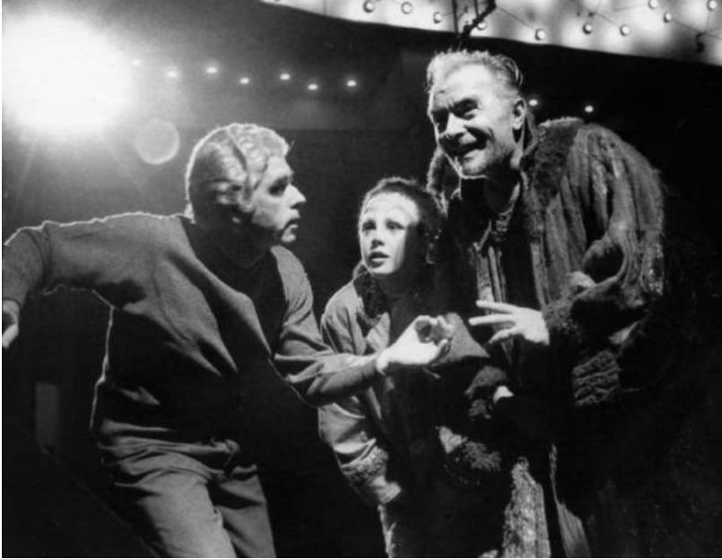
Репетиция пьесы Уильяма Шекспира «Король Лир». 1972