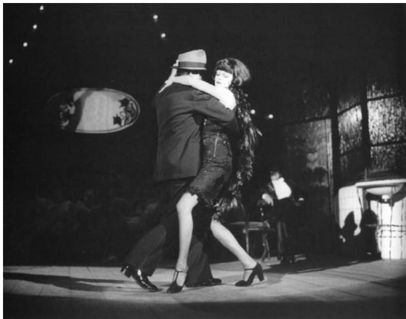
Сцена из спектакля по пьесе Бертольта Брехта «Трехгрошовая опера». 1955–1956

Звучала томная, томительная, сладостная мелодия песни, которую в полумраке у кулисы начинала Дженни. Затем ее подхватывал и Мэкки, стоящий напротив. Они постепенно двигались по направлению друг к другу и встречались в центре авансцены. И начинался танец — «танго, полное страсти и меланхолии».