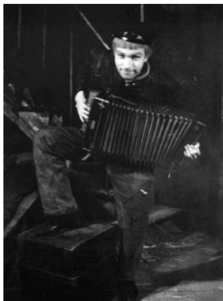
Джорджо Стрелер в спектакле «Ночлежка». 1947