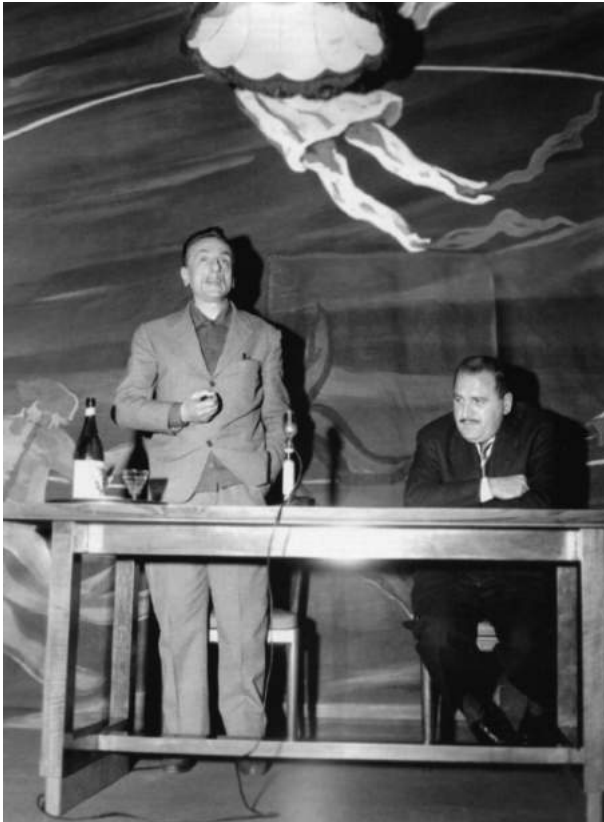
Эдуардо де Филиппо и Паоло Грасси. 1958

Теперь все должно было стать иначе. «Все вместе обсуждают готовящийся спектакль, участвуют в его постановке, репетируют. Мы ориентируем его на нашу публику, которая нас знает. Именно до нее мы хотим донести наши мысли и мечты. Это наша публика, а не какая-то масса людей, мужчин и женщин, о которых мы забудем завтра» 1 . И все же, несмотря на то, что постоянной труппы не было, жизнь актеров, принимавших в участие