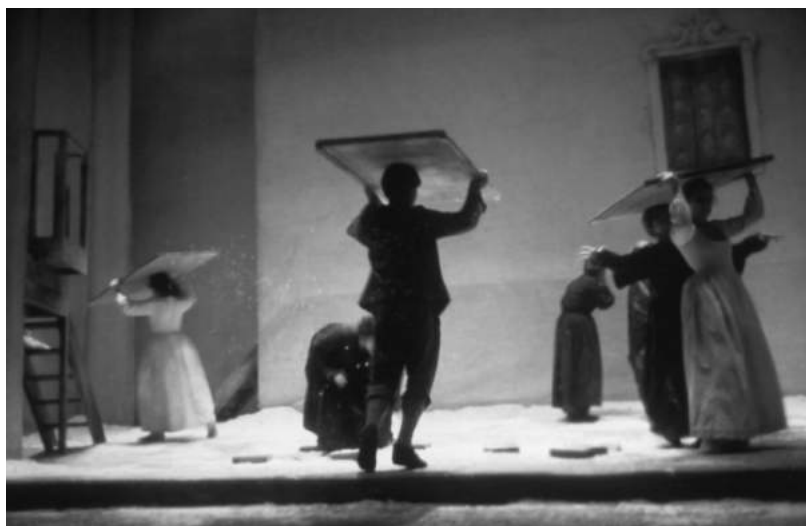
Сцена из спектакля «Кампьялло» по пьесе Карло Гольдони. 1974–1975

основной материал декорации). Белые дома, трубы, снег на крышах — все похоже на детский рисунок. Дома лепятся друг к другу и уходят в глубь сцены вправо и влево, замыкаясь в районе задника небольшим зданием локанды (гостиницы) с одной стороны, и продолжают ярусами зрительного зала с другой. Архитектурно помещение «Пикколо театро», в котором был поставлен спектакль, создавало иллюзию единого пространства, объединяя в одно целое сцену и зрительный зал. Игровая площадка включала в себя и партер, через который входили и выходили персонажи. В каждом доме — окошко и лесенка, ведущая наверх к входной двери. В центре на переднем плане на полу — замерзшая лужа, в ней плавает бумажный кораблик. Появляющийся из зала в сопровождении слуги Кавалер, не заметив лужу, нечаянно попадает в нее ногой. И весело смеется.