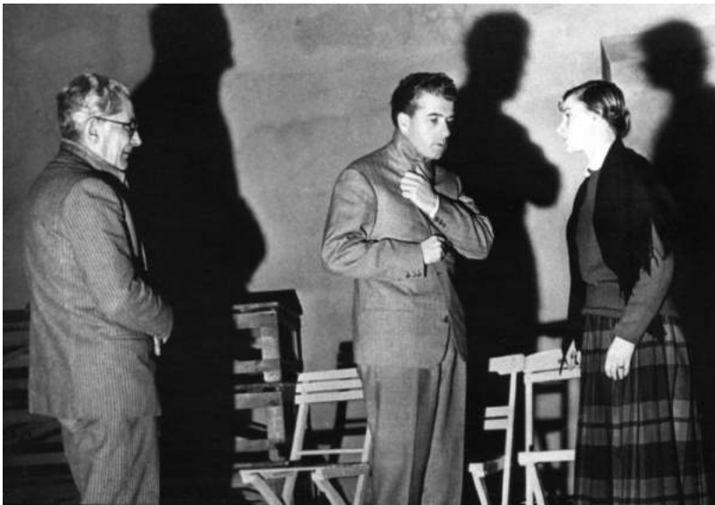
Сцена из спектакля «Наш Милан». 1955–1956

История, рассказанная в спектакле, проста и почти банальна. Обычная криминальная мелодрама из жизни нищих или, как сказал один из критиков, «грошовая мелодрама» 1 . В нескольких словах фабула пьесы сводится к следующему: дочь уличного актера, глотателя огня Эль Пеппона, красавицу Нину соблазняет местный щеголь и бандит Тогаццо, порабощает ее, жестоко издеваясь и отбирая деньги. Оскорбленный отец убивает Тогаццо. Но Нина не принимает эту жертву, она не хочет возвращаться к прежней жизни в нищете и уходит в мир богатых — на содержание.