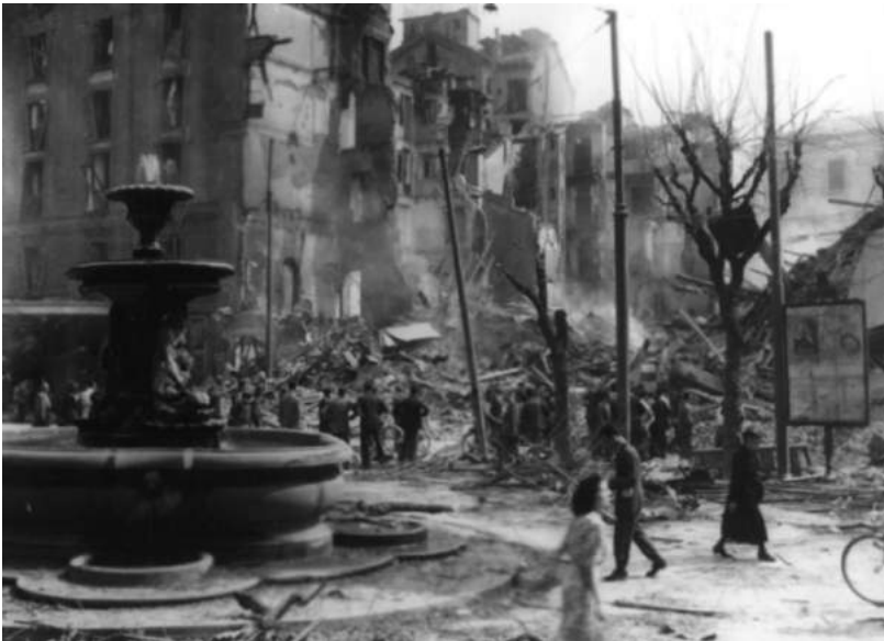
Разрушенный Милан. 1945

«Колыбель Рисорджименто», крупнейший промышленный центр Севера, Милан всегда был городом с сильными позициями левых партий и, более того, — широко поддерживающим социалистическую идею; его не случайно называли «городом социалистическим». Он никогда не был сторонником диктаторской политики Муссолини, несмотря на то, что именно Милан считается родиной итальянского фашизма. Причем поддержки режиму не было ни в одном из слоев городского общества. Не зря дуче так не любил Милан. Ведь здесь умудрились безнадежно испортить один из самых грандиозных его праздников: открытие Центрального железнодорожного вокзала — первой большой стройки фашизма. Столь важное политическое событие было бойкотировано местным епископатом, что в свою очередь вынудило и короля Италии отказаться от участия в мероприятии.