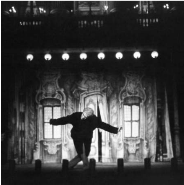
Джорджо Стрелер на фоне декораций спектакля «Арлекин, или Слуга двух господ»

после долгих «скитаний» на чужбине театр масок вернулся в Италию, туда, где родился и откуда вышел в свет. Так Франция отдала Италии свой долг. И так завершился этот своеобразный круговорот традиции в европейской культуре нового — новейшего времен.