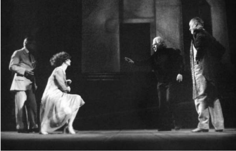
Спектакль по пьесе Луиджи Пиранделло «Горные великаны» Репетиция с актерами. 1993

Он печально и вопросительно посмотрел в зал и медленно развел руками. И возникло нечто грандиозное — в этом взгляде, в этих его руках открылся целый мир. Перед нами был мудрец, уставший гений, пострадавший от людей и познавший в жизни все. Никогда позже — ни в дни репетиций и прогонов, ни позже на видеоэкране — в исполнении Тино Карраро, одного из ведущих актеров «Пикколо», я так и не нашла ничего подобного. Хотя, возможно, что именно в роли Просперо (своего рода alter ego самого Стрелера) произошло неизбежное: более крупная личность режиссера заслонила собой актера.