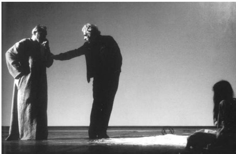
Репетиция спектакля по пьесе Уильяма Шекспира «Буря». 1980

В такие моменты Стрелер может сказать — прокричать из зала — такое, что вроде бы и вовсе не имеет к данной сцене отношения, или вдруг произнести какое-нибудь восклицание в совершенно неожиданном и противоречащем общему настроению данной сцены тоне. Зрителя, оказавшегося в этот момент в зале, подобные выпады режиссера поначалу просто ставят в тупик. И лишь позже приходит осознание, почему это делается и зачем.