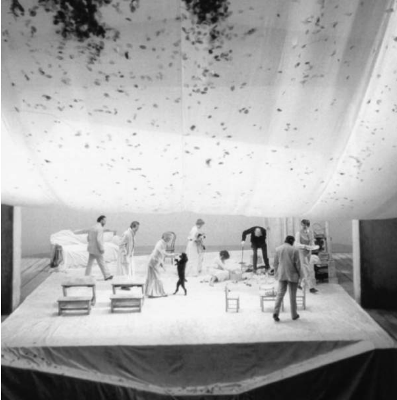
Сцена из спектакля по пьесе А.П. Чехова «Вишневый сад». 1974

беспорен. Поэтому никого не удивило, когда в 1979 году Стрелер был избран депутатом Европейского парламента по спискам Социалистической партии. Стрелер всегда был гражданином и борцом, всегда стремился делать все от него зависящее, чтобы изменить мир к лучшему, и не только с помощью своего искусства, но и принимая активное участие в жизни общества. В Страсбурге он курировал вопросы культуры, борясь за будущее Европы, «Европы с человеческим лицом» 1 .