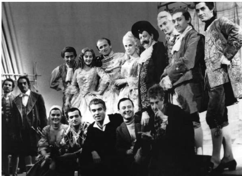
Джорджо Стрелер и исполнители роли Арлекина Марчелло Моретти и Ферруччо Солери на репетиции

Именно в это время происходит сложение искусства Джорджо Стрелера, складывается его стиль в режиссуре, его почерк, его метод, постепенно возникает тот сложный художественный синтез разных начал, который приведет к рождению его эстетики, его неповторимого языка в искусстве, что с такой силой проявится в спектаклях «Пикколо» 1960-х, 1970-х и 1980-х годов.