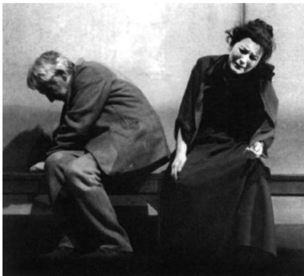
Сцена из спектакля «Наш Милан». 1961–1962

одна: бунт против несправедливости» 1 . И в середине XX века, и в его конце в Италии были и есть места, где живет бедный люд. Только «новые бедные теперь обитают не в центральных частях города, а на его окраинах, по периметру больших метрополий» 2 . Об этом Джорджо Стрелер помнил всегда.