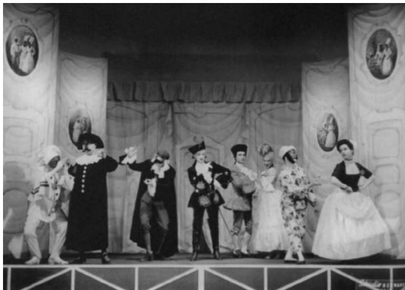
Сцена из спектакля «Арлекин, или Слуга двух господ» по пьесе Карло Гольдони. 1951–1952

Джорджо Стрелером он впервые увидел свет ramпы весной 1947 года. Обращенный к прошлому — к корням национальной культуры, это был революционный спектакль. «Стрелер продемонстрировал здесь полную независимость, полную автономию в подходе к произведению Гольдони», — писал Роберто Алонджи. Ключ был найден в традиции комедии дель арте (тем более что пьеса давала к тому все основания). И хотя связь времен давно прервалась, а живая традиция умерла, чудо произошло. Создателям спектакля удалось невероятное — возродить из пепла погибшую культуру, вновь овладеть уникальной техникой, воссоздать самый дух спектакля легендарного театра, раскрыв тайну сценической жизни маски: вернуть свойственную каждой из них форму поведения, манеру подачи текста, особенности голоса, жестуляции, характер общения со зрителями. Ожили, вновь обрели плоть и кровь знаменитые некогда маски — Арлекин, Бригелла, Панталоне, Доктор, Смеральдина, Влюбленные. Комедия дель арте была сыграна. Она «была сыграна на пустом