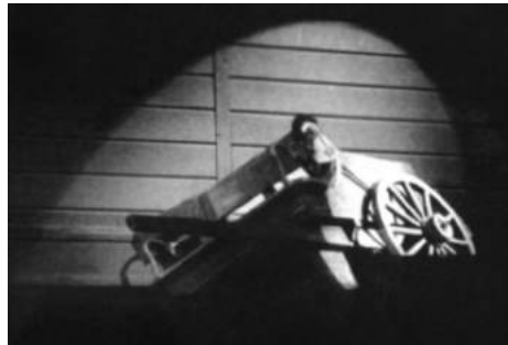
Финал спектакля по пьесе Луиджи Пиранделло «Горные великаны». 1966–1967

Актеры с Ильзе на руках спускаются в зрительный зал и проходят через него. Сцена пустеет, погружаясь во тьму, и на ней, в правом ближнем углу авансцены, вновь появляется тележка странствующих комедиантов, в которой они приехали на виллу; с нее свисает забытый костюм, виднеются брошенная труба и маска. Сизо-голубой свет прожектора заключает повозку в свой круг. Мгновения... и серый тяжелый пожарный занавес медленно начинает движение вниз. Достигнув повозки, он с грохотом ломает ее на части. Так занавес ставит заключительную точку в этой драматической истории о театре. Он становится действующим лицом спектакля, превращается в убийцу, в наемного убийцу великанов, выступающего на их стороне и от их имени.