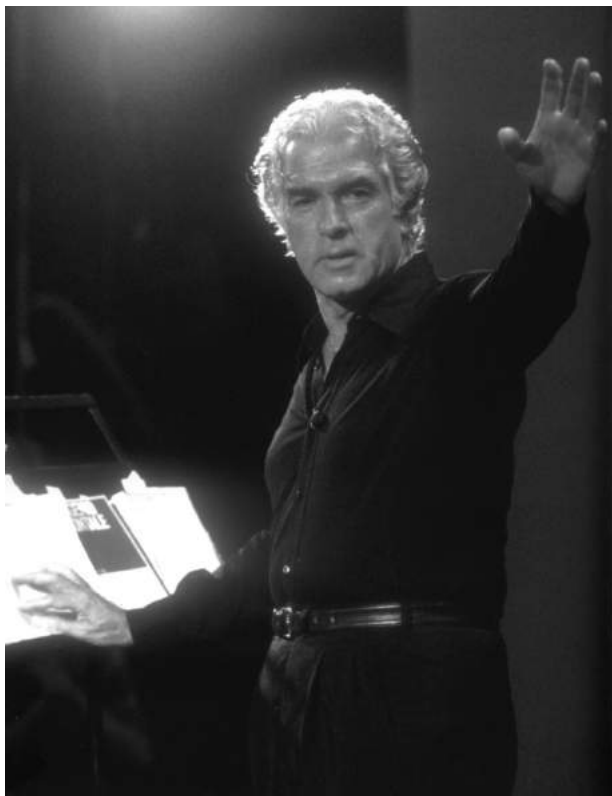
Джордж Стрелер на репетиции. 1980-е

сделанный во время одной из репетиций. Стрелер в своей обычной рабочей одежде — черный свитер и черные брюки. Он повернут в полуоборот, правая рука резко выброшена вперед, лицо сурово, гневно. Глаза смотрят не прямо — они устремлены к сцене, и он полностью поглощен тем, что видит перед собой. Стрелер что-то кричит актерам из темноты партера. Еще мгновение, и он окажется рядом с ними, взлетит на сцену — одним легким, ловким и сильным броском. Своей позой, выражением лица, динамикой тела он напоминает микеланджеловского Давида, идущего в бой. Но Стрелер, пожалуй, еще более динамичен, решителен, грозен. И так на себя похож! В такие мгновения