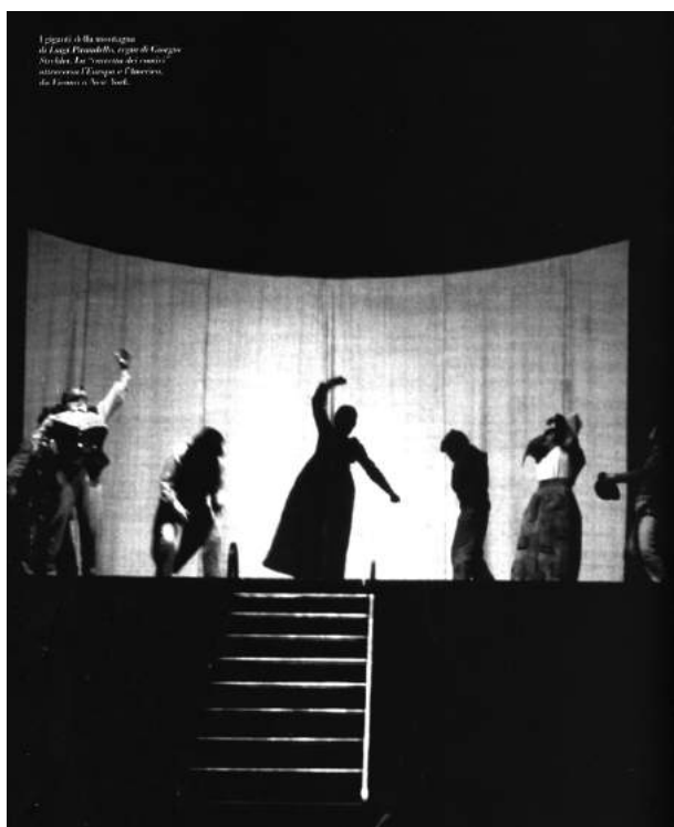
Сцена из спектакля по пьесе Луиджи Пиранделло «Горные великаны». 1993–1994