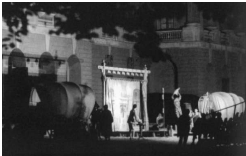
«Арлекин, или Слуга двух господ». Декорация. 1972–1973

После безвременно ушедшего из жизни великого Марчелло Моретти в 1963 году в «Арлекине» дебютировал новый исполнитель – Ферруччо Солери. Тогда спектакль был впервые поставлен под открытым небом, во дворе виллы Литта близ Милана. Версия эта получила название «С фургонами». Мотив театра в театре здесь получил дальнейшее развитие. У входа в виллу был расположен невысокий помост с зажженными огромными свечами рампы и легким занавесом. Справа и слева от него находились две большие крытые повозки с выпряженными лошадьми, в которых странствующие комедианты колесили некогда по дорогам Европы. Актеры выходили из фургонов, разминались, надевали костюмы, маски – так начинался этот спектакль. Новый Арлекин сразу покорила публику. Его образ был лишен мягкости и нежности персонажа Моретти, был более жестким и рационалистичным, однако восхищал мощной энергией молодости, блистательным исполнением акробатических трюков, склонностью к чистому комизму. Солери начал работать над образом Арлекина еще при жизни Моретти. Существует легенда, что Моретти учил Солери, передавая ему секреты своего мастерства.