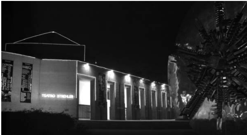
Новое здание «Пикколо театро ди Милано», получившее название «Театр Стрелера»

«С уходом Стрелера закончилась эпоха» – в один голос писали итальянские газеты. Закончилась история итальянского театра, начавшаяся после Второй мировой войны. «Пикколо» –