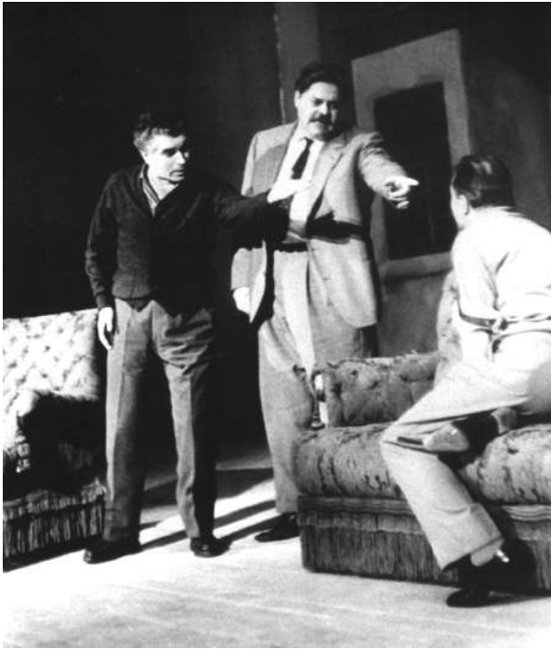
Сцена из спектакля по пьесе А.П. Чехова «Платонов и другие». 1959

было время открытия натурализма. В большинстве постановок с максимальной точностью воспроизводились приметы исторических реалий, приметы времени и места, а социальные проблемы выносились на первый план. И, подчиняясь ветрам времени, Стрелер настойчиво искал подходы к народному театру, ставя национальную классику, главным образом пьесы Гольдони и Пиранделло. Правдиво рассказать о жизни своего народа, показать истинные его характеры, его настоящий язык — задача, которую режиссер ставил перед собой. Диалектальные комедии в значительной мере позволяли воплощать идею в жизнь. Уточним, диалектальные венецианские комедии и ломбардские, поскольку именно этот драматургический материал Стрелеру был ближе всего. Как-то, рассуждая о своих склонностях