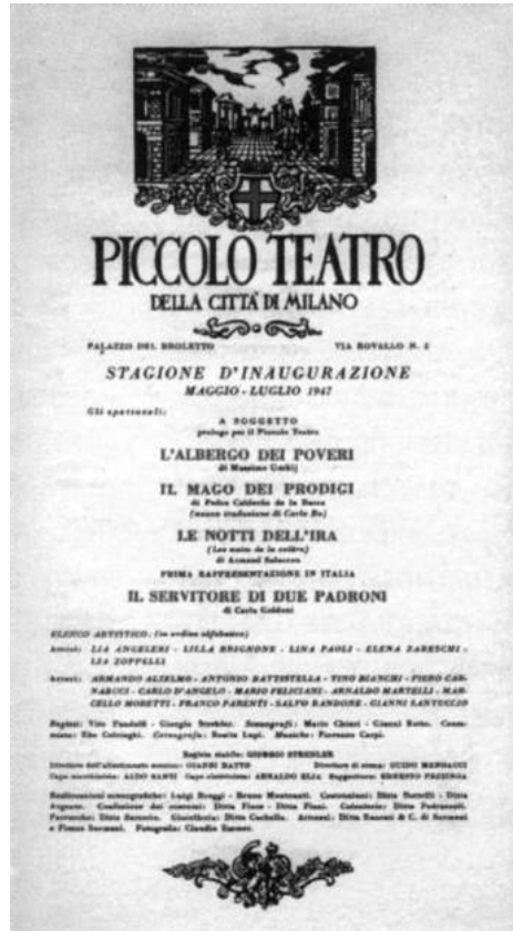
Первая афиша «Пикколо театро ди Милано». 1947

В конце апреля 1945 года ремонтные работы в палаццо Бролетто завершились, и новый театр готовился принять первых зрителей. Его назвали «Пикколо», что означает «Малый». Название говорило о размерах театра, который и в самом деле был очень небольшим (первые годы в нем было всего пятьсот мест). В имени нового театра скрывался и намек, понятный лишь посвященным: он был назван в честь одного из известных европейских театров — московского Малого. Вместе с тем в названии театра заключался и еще один смысл. В годы, когда все только и говорили о массовом зрителе, о необходимости нести искусство в народ, самым широким народным массам, миланский «Пикколо» названием своим заявлял, что количество зрителей не есть цель театра, во всяком случае, далеко не главная его цель: «После призывов создать театр на десять тысяч зрителей... настало время работать вглубь. Добрать в количестве можно и потом. Мы полагаем, что небольшая группа наших зрителей станет ядром будущих огромных театральных залов» 1 . Некоторые итальянские исследователи полагают, что