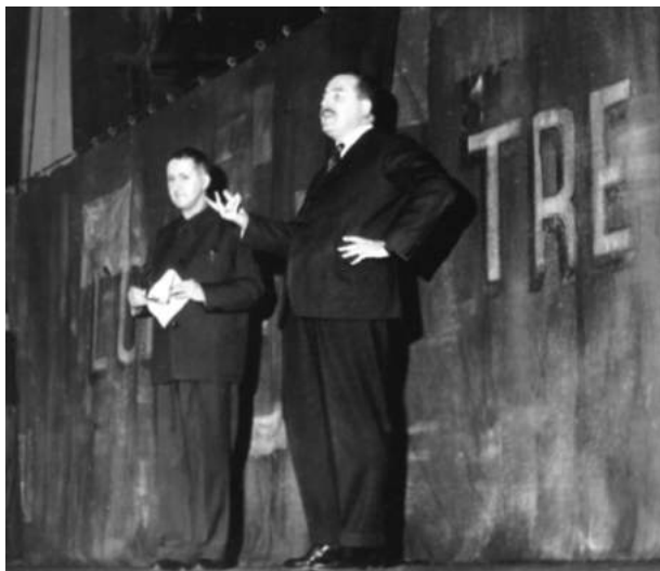
Бертольт Брехт и Паоло Грасси на премьере «Трехгрошовой оперы». 1956

жесткость, и брехтовскую прямолинейность. Он создал спектакль многогранный, полный жизни, спектакль широкого диапазона.