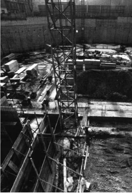
Строительство нового здания «Пикколо театро ди Милано»

Траурная процессия двинулась к новому зданию «Пикколо» и остановилась у входа, но в театр не вошла. «Театр, который так мучил его при жизни, не получит его и после смерти», – решила его жена 1 . Двери здания отворились, и оттуда слышались звуки музыки: оркестр исполнял увертюру к опере «Так поступают все женщины» – последнего спектакля Стрелера, который он не успел завершить. Затем процессия двинулась дальше.