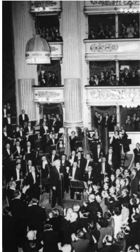
Артуро Тосканини в миланском театре «Ла Скала». 1946

В годы Второй мировой войны именно Милан стал центром Сопротивления, потому и пострадал много больше других городов Италии. Однако оправился он от шока бомбежек и уличных боев на удивление быстро. Стойкость и воля к жизни, во все времена спасавшие Милан, преодолевали любые трудности. Лишь только смолкли орудия, жизнь в нем забурилась с удвоенной силой. Заработали театры, и в Милан потянулись актеры из других городов Италии, в том числе из столицы. В рекордно короткие сроки было восстановлено здание «Ла Скалы». Первый спектакль состоялся уже 11 марта 1946 года. За дирижерским пультом стоял Артуро Тосканини. Деловой и промышленный Милан стремительно становился и центром культуры освобожденной страны.