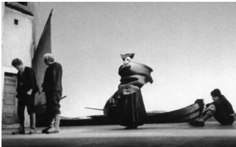
Сцена из спектакля по пьесе Карло Гольдони «Кьоджинские переделки». 1964

языку. События пьесы происходят в рыбацком городке Кьодже, расположенном неподалеку от Венеции. Говорят там на местном наречии, близком к венецианскому, но все же весьма отличном. Комедия написана именно на этом языке, который Гольдони хорошо знал. Чтобы сыграть пьесу, надо владеть этим языком. А поскольку в «Пикколо» среди исполнителей не было венецианцев, Стрелер перед тем как начать репетиции на полтора месяца отправил актеров в Кьоджу. И в спектакле зазвучала подлинная, волшебная кантилена кьоджинской речи.