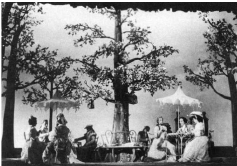
Сцена из спектакля по пьесам Карло Гольдони «Дачная трилогия». 1954–1955

это было прежде всего произведение о любви. «Любви ошибочной, — скажет он. — Все персонажи здесь ошибаются — и в том, как жить, и в том, как любить» 1 . Новое понимание отношений между людьми в пьесах Гольдони, любовных отношений в том числе, — вот что прежде всего удивило в «Дачной трилогии» Стрелера. Осознание этого, однако, к зрителям приходило не сразу. Разножанровость, стилевое многообразие трилогии воспринимались как откровение. Действие спектакля развивалось для Гольдони необычно — от комедии к драме. Начало же и вовсе не предвещало ничего нового.