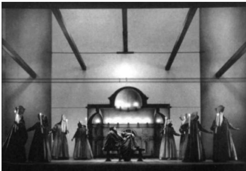
Сцена из спектакля по пьесе Бертольта Брехта «Жизнь Галилея». 1962–1963