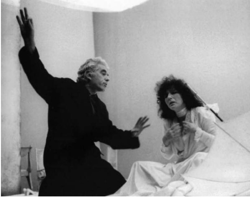
Репетиция спектакля по пьесе А.П. Чехова «Вишневый сад». 1973

Чрезвычайно выразительно все, что делает Стрелер во время репетиции. И даже просто звук его голоса без слов, сопровождающий действия персонажей, способен донести смысл сцены порой даже больше, чем еще способны это сделать исполнители. Так, на одной из репетиций «Бури» Шекспира отработывалась маленькая сцена пробегая трех комических персонажей (Тринкуло, Калибан, Стефано) из зрительного зала на сцену. Она шла под негромкие, но ритмичные удары барабана и длилась какие-то мгновения. Режиссер сопровождал их действия своими ритмичными звуками — хриплым и отрывистым рывканьем, и в комически-злодейской интонации его голоса угадывалось многое: мотивы поведения этих персонажей, их внешний вид и даже пластика. Своим голосом Стрелер как бы принуждал исполнителей двигаться определенным образом, что они и делали — шли на полусогнутых, как бы пританцовывая и воровато озираясь.