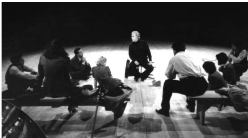
Джорджо Стрелер в Театральной школе. 1987

основами мастерства, познакомиться с историей театра, а также выучить, помимо иностранного языка, три итальянских диалекта, на которых существует драматургия, востребованная современным итальянским театром: венецианский, неаполитанский и миланский. Согласно первоначальному плану каждый набор учащихся, каждый новый курс должен носить имя одного из реформаторов театра: Мейерхольда, Копо, Жуве... Первый набор был посвящен Жаку Копо. С учащимися школы Стрелер осуществил один из грандиозных своих проектов — «Фауст» Гёте (часть I). К «Фаусту» Стрелер шел всю жизнь. Режиссер планировал ставить его в новом большом здании Пикколо, но его все не было, поэтому пришлось довольствоваться маленьким пространством «Театро Студио», где такому масштабному спектаклю было явно тесно. «Фауст» создавался в течение нескольких лет (с 1989 по 1991 год). Премьера второй части («Фауст», часть II) состоялась два года спустя. Спектакль в целом был рассчитан на исполнение в течение трех вечеров.