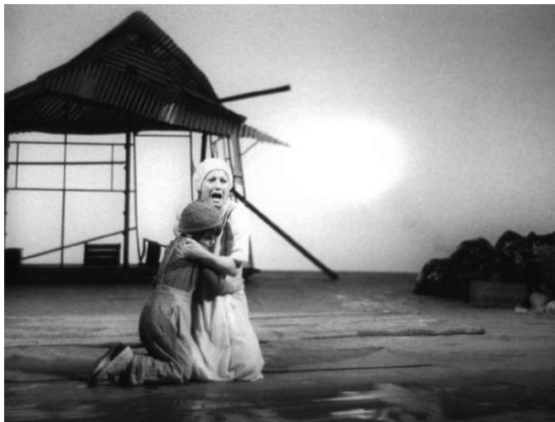
Сцена из спектакля по пьесе Бертольта Брехта «Добрый человека из Сычуани». 1980

домики напоминали пагоды, все на сцене, включая предметы и даже пол сцены, было сделано из бамбука, а актеры одеты, как китайцы — в штанах, блузах и плоских соломенных шляпах, загримированы они были тоже под китайцев.