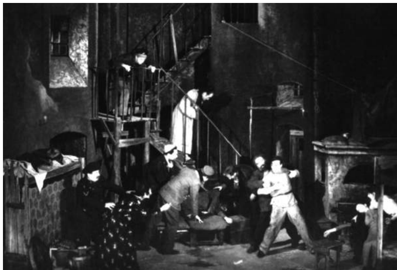
Сцена из спектакля «Ночлежка» («На дне») Максима Горького. 1947