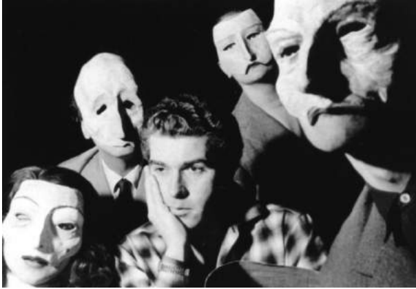
Джордж Стрелер среди масок. 1950