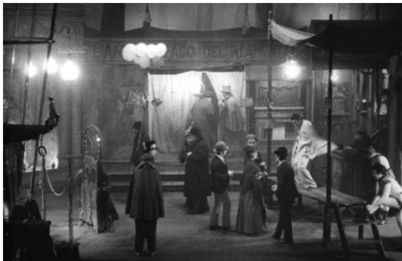
Сцена из спектакля по пьесе Карло Бертолацци «Наш Милан». Декорация Луна-парка. 1955–1956

отчаянно боровшиеся за выживание. Вскоре после спектакля Стрелера о таких новых миланцах расскажет Лукино Висконти в одном из самых лучших и трагических своих фильмов «Рокко и его братья».