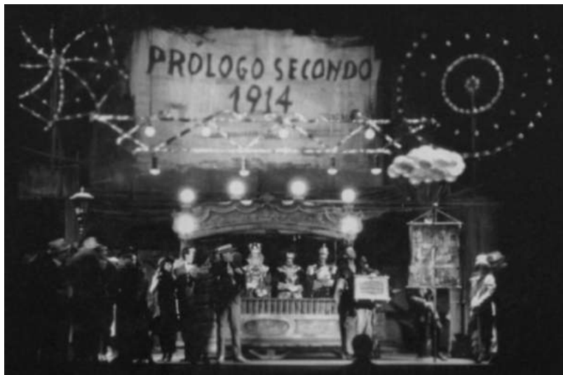
Сцена из спектакля по пьесе Бертольта Брехта «Трехгрошовая опера». 1955–1956

славу ловкости бандита Мэкки-Ножа, и возникала следующая надпись: «Пролог к 1914 году». Серый занавес уходил наверх, и зрителям открывался луна-парк с каруселями в день ежегодной ярмарки квартала Сохо. Пантомимическая сцена шла под музыку пролога. В глубине сцены виднелся театр марионеток. Чинно прохаживались почтенные буржуа, люди иных сословий, заметны были и воры, и проститутки... Вдруг раздавался пронзительный крик дамы в перьях: «А ведь это... Мэкки-Нож». И на сцене возникала вальяжная фигура провинциального франта с тростью, в полосатом пиджаке, бежевых брюках, белых перчатках и клетчатой шляпе, надетой набекрень. Знаменитый бандит по прозвищу Мэкки-Нож спокойно и не спеша прогуливался среди отдыхающих. Сразу за этим на вновь опустившемся малом занавесе возникал текст с кратким содержанием первой картины, и тут же глазам зрителей представляли апартаменты Пичема, короля «нищих», его так называемая гардеробная, где через всю сцену был протянут канат, на котором висела униформа его команды — костыли, протезы, рваная одежда и другое