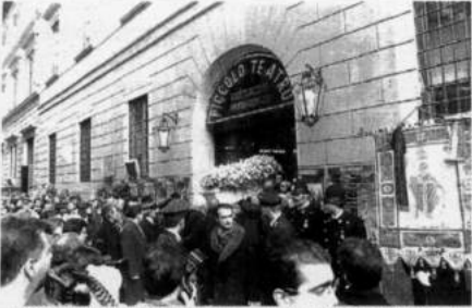
La bara di Giorgio Strehler ha lasciato ieri a mezzogiorno il Palazzo Teatrale, trasformando in processione aperta e colta la migliaia di milanesi

1911-1997 fori a mezzogiorno coronano laica in nome del regime con alcuni rimproveri per la indifferenza del passato. In corso sanile Vidorini, Calandri, la Vidorini, Pardo Rossi e altri geniti, Comate la Piccolo e la Neri L'accompagnamento del «Caci Jan» tutto