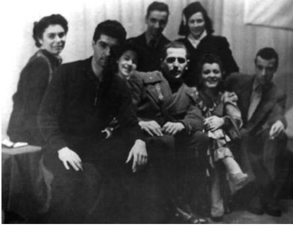
Джорджо Стрелер и Паоло Грасси (в военной форме). 1943

это «потребностью присоединиться к веку» ( entrare nel secolo ) — веку современного европейского режиссерского театра 1 . Миланцев звали Паоло Грасси и Джорджо Стрелер.