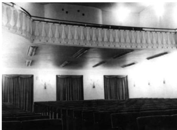
Зал «Пикколо» на улице Ровелло. 1952

много: любовь к театру, преданность искусству и, конечно, общие взгляды не только на перспективы театрального дела в Италии, но и на политику, проблемы социальной жизни и более широко – взгляды на мир.