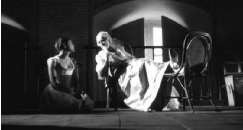
Сцена из спектакля по пьесе Готхольда Эфраима Лессинга «Минна фон Бархельм». 1983

природы в драматическом действии спектаклей Стрелера, как правило, становится очень важным, в отдельных случаях решающим.