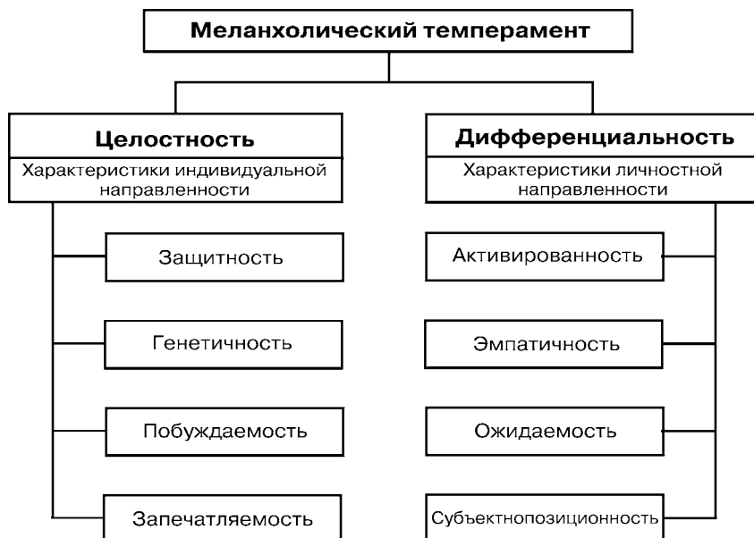
Рис. 2. Структура меланхолического темперамента.