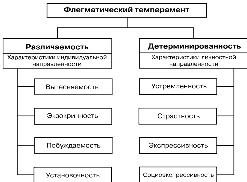
Рис. 3. Структура флегматического темперамента.