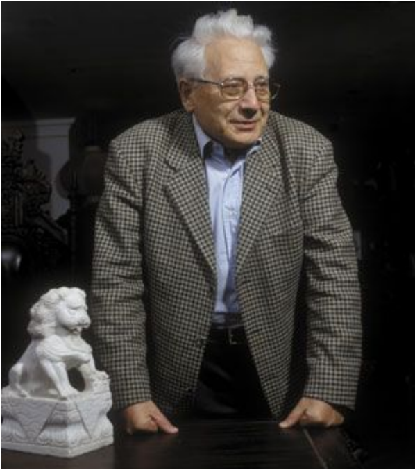
//-- академик Игорь Семенович Кон --//

Историк, философ, этнограф И. С. Кон своими книгами и статьями в популярных изданиях окончательно заставил Советскую власть (пусть и под самый занавес ее существования) отказаться от принципов «залкиндизма» и духовного оскотления общества. Сама история его научной и популяризаторской деятельности – это история борьбы за сексуальное просвещение и возможность свободно говорить о сексе. Это история, которая напоминает лихо закрученный детектив, сопровождавшийся непредсказуемыми поворотами и появлением на «коновской орбите» все новых и новых сановных лиц.