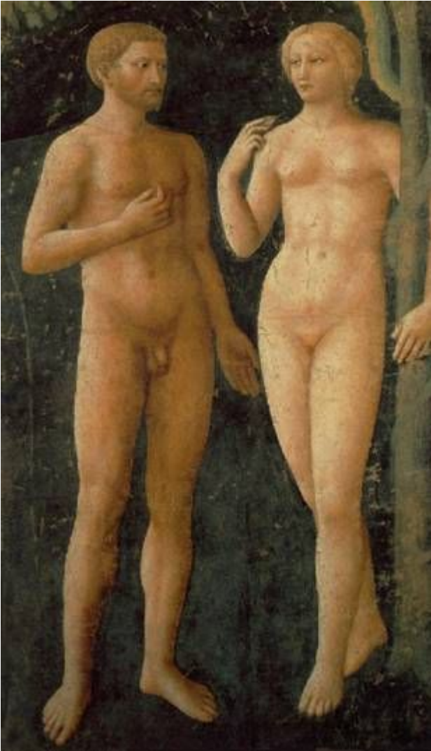
//-- Мазолини да Паникале. Грехопадение