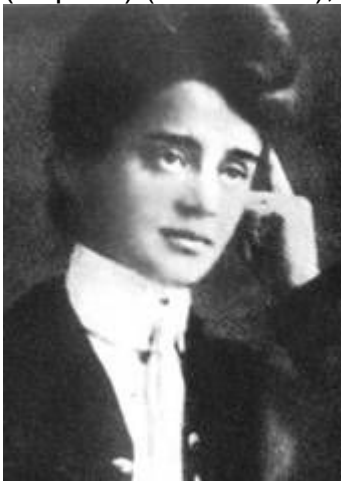
//-- София Парнок --//

Видимо, распрямление этой в течение веков сжатой пружины женской гордости и стало причиной того, что в конце XIX – начале XX века еврейки активно влились в феминистское движение, а затем и возглавили его. И не исключено, что именно этим объясняется появление в период Серебряного века значительного числа еврейско-лесбиянок, многие из которых приобретают широкую известность. В России первым и откровенным певцом лесбийской любви стала выдающаяся поэтесса София Парнок (Парнах) (1881–1926), родившаяся в традиционной еврейской семье.