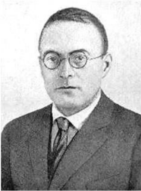
//-- Филипп-Аарон Тейльхабер --//

Но спустя год Тейльхабер, уже начавший практиковать как сексолог, убедившись, что общество не желает слышать его предостережений, неожиданно резко меняет свои взгляды. Теперь выход из той демографической катастрофы, которая грозит Западу, он начинает видеть не в укреплении семьи, а, наоборот, в расшатывании ее устоев, приравнивании внебрачных отношений к брачным. Исходя из еврейской традиции, считающей, что ребенок, родившийся от женщины, не находящейся в браке, обладает такими же правами, что и ребенок, родившийся в законном браке, Тейльхабер начинает провозглашать, что женщина имеет право вести относительно свободную сексуальную жизнь, не находясь в браке, выбирать себе партнеров и при желании рожать детей, не будучи официально замужем. Общество же должно изменить свои взгляды так, чтобы не только не осуждать таких женщин, но и всячески поддерживать их. Для того чтобы пропагандировать свои идеи, незадолго до Первой мировой войны, Тейльхабер создает Всемирную Лигу Сексуальных Реформ – ту самую, в которую Остап Бендер советовал обратиться Михаилу Самуиловичу Паниковскому.