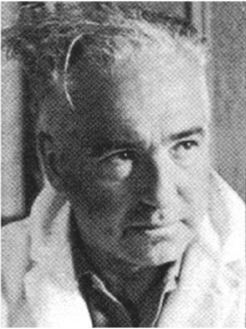
//-- Вильгельм Рай --//