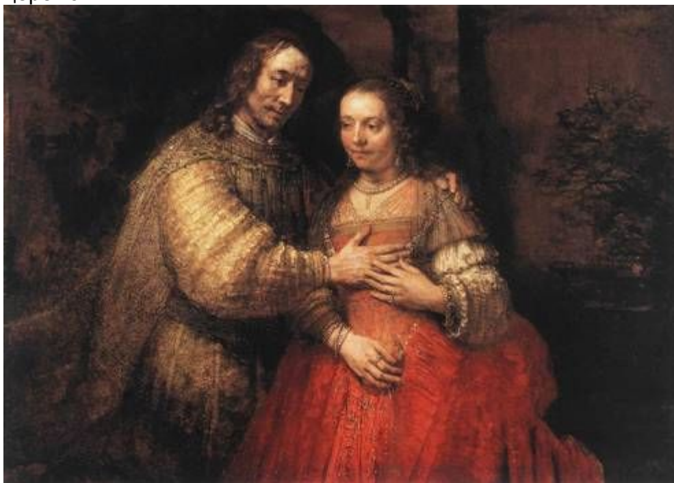
//-- Рембрандт. Еврейская невеста --//

Огромное число гостей на еврейских свадьбах настолько пугало правителей как европейских, так и восточных стран, что во многих из них, независимо друг от друга, издавались указы, ограничивающие число участников еврейской свадебной церемонии.