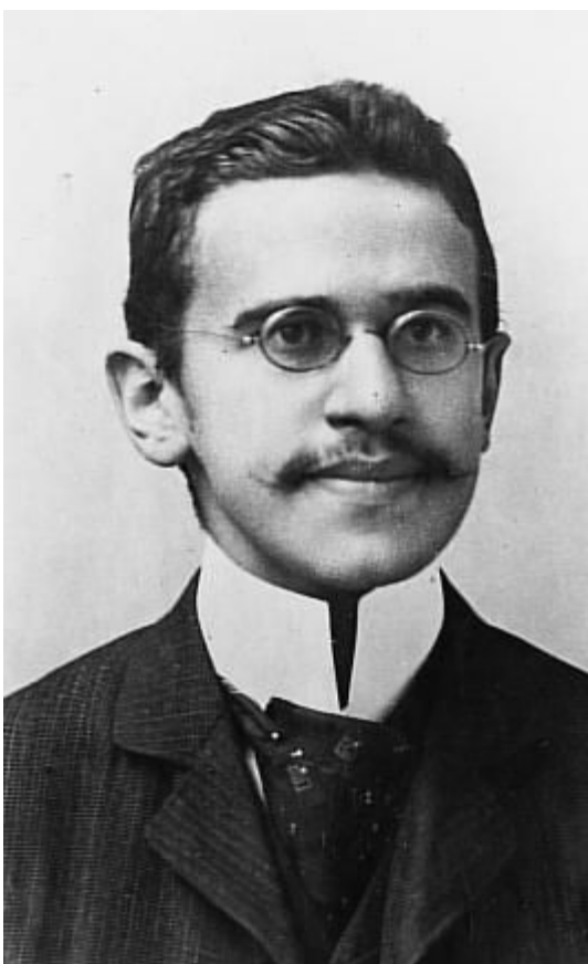
//-- Отто Вейнингер --//

Был основатель Берлинского института сексологии Магнус Гиршфельд, которому человечество обязано нынешним терпимым отношением к гомосексуализму. В институте, которым руководил Гиршфельд, были проведены первые в Европе научные сексологические исследования, а также первые в мире операции по смене пола. (Институт Гиршфельда с его огромным архивом и библиотекой был уничтожен нацистами в 1933 году, сразу после их прихода к власти, как считается, в связи с тем, что в его архиве хранились материалы, свидетельствующие о тайных сексуальных пристрастиях лидеров гитлеровской Германии.)