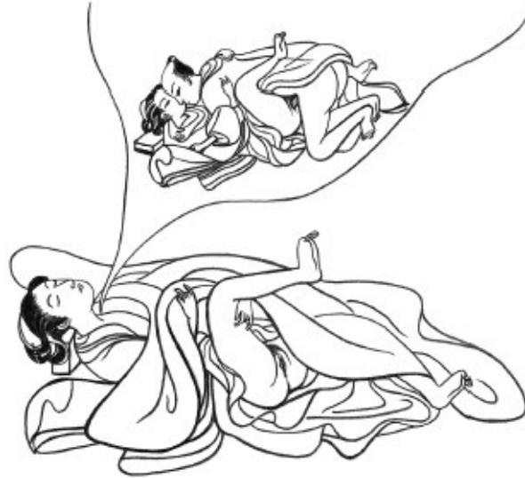
Иллюстрация изображает женщину, которой снится эротический сон. С японской гравюры, XVIII век

покрывала. Сладковатый запах создает психическую защиту и уводит человеческую душу в мир сладких сновидений. Запахи розы, лаванды, розмарина, тмина, жасмина, лотоса, сандалового дерева, пачулей, листья марихуаны и другие экзотические ароматы помогают расслабиться и способствуют естественному засыпанию.