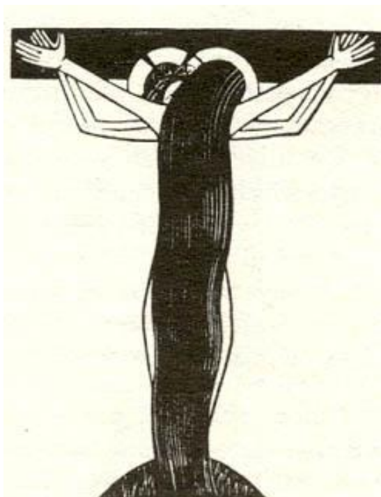
Эрик Гилл, «Бракосочетание Бога»

Как часть целого, волосы представляют земную человеческую жизнь в всей её чувственности. В 1922 году британский скульптор и каллиграф Эрик Гилл опубликовал гравюру на дереве под названием «Бракосочетание Бога», изображающую женщину, стоящую с вытянутыми руками напротив тела Иисуса, висящего на кресте. За исключением рук и двух участков ног, всё, что вы видите – это волосы во всю длину тела, покрывающие весь торс Иисуса. Для Гилла это сближение страдающего Христа и человеческого волоса представляет глубинную мистерию духовной жизни, эротическое единение Христа и его церкви.