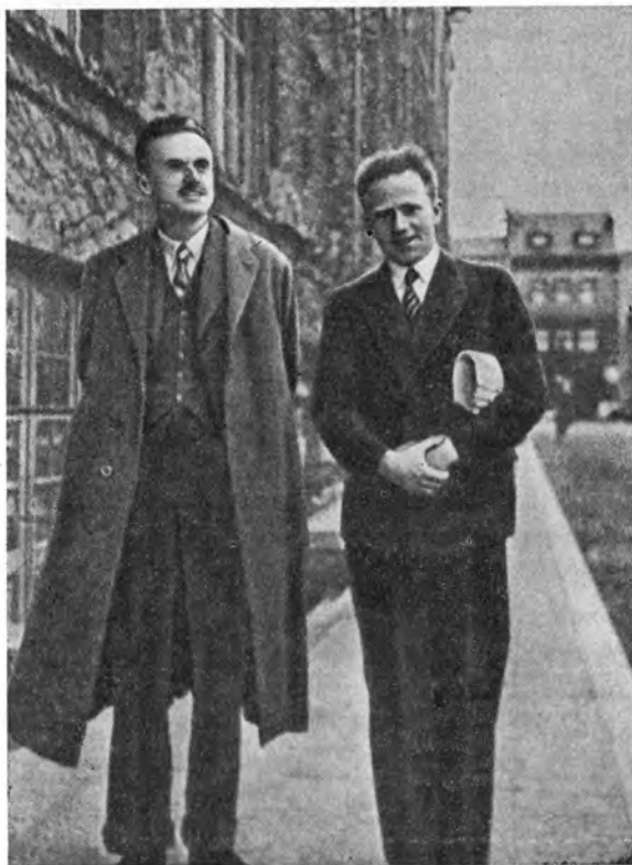
П. Дирак и В. Гейзенберг, 1933 г.

На симпозиуме в Мюнхене (18–20 сентября), посвященном теме «Влияние современных научных идей на общество», выступил Дирак.