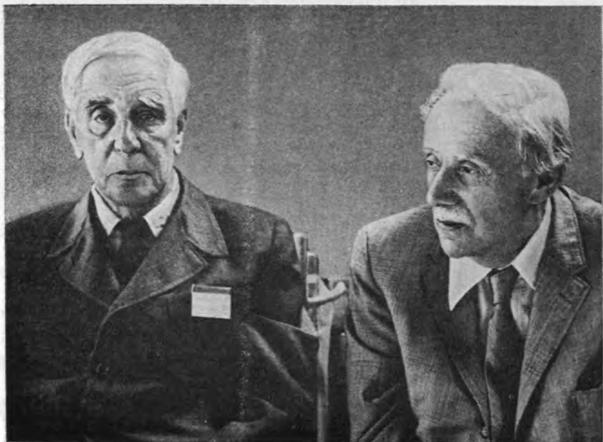
П. Л. Капица и П. Дирак на конференции Нобелевских лауреатов в Линдау, 1979 г.