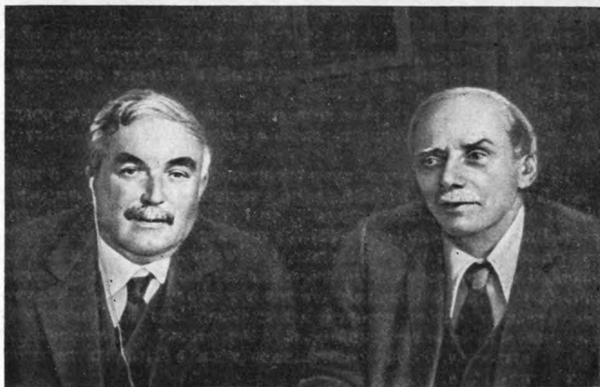
В. А. Фок и П. Дирак. Ленинград, 1973 г.

сопровождает его в письме такими словами: «Если Вы думаете, что оно подходит» и тем самым подразумевает, что я могу покритиковать Ваши замечания и высказать Вам свое мнение о том, подходят ли они для предисловия. Я нахожу первую часть предисловия очень интересной и вполне подходящей, поскольку оно объясняет, что Вы включили в свою книгу и чем при этом руководствовались. Однако вторая часть (начиная со слов «...правила, определяющие физическую интерпретацию...») представляется мне чисто предположительной и не имеющей прямого отношения к содержанию книги. Я думаю, что лучше всего было бы их полностью опустить. Ваша книга (особенно ее русское издание) адресована студентам, которые недостаточно хорошо знакомы с принципами квантовой механики, и поэтому не стоит говорить о том, о чем, по Вашему представлению, мы не имеем каких-либо идей. Между прочим, Ваш скептицизм, относящийся к индетерминизму (который я не разделяю) 2 , может быть неправильно понят в духе Бома и Вижье, и это может привести к бессмысленным дискуссиям. Я надеюсь, что Вы не будете возражать, если я опушу вторую часть предисловия. Если же вместо опущенного текста Вы сможете добавить несколько слов для русского читателя или если Вы укажете, что замечания редактора, представленные в виде подстрочных примечаний и в Приложении, сделаны с Вашего разрешения (я имею в виду то разрешение, которое Вы дали мне в Реймоунте), это было бы более чем достаточно» [4, л. 15].