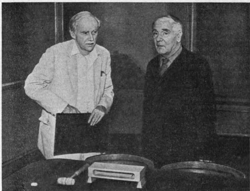
П. Дирак и П. Л. Капица в Институте физических проблем. Москва, 1973 г.