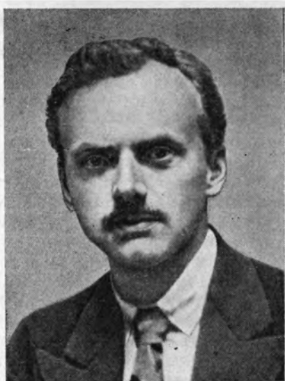
П. Дирак (30-е годы)

Не то чтобы Дирак был абсолютно убежден в существовании предсказанного им позитрона, но он осознал дилемму: или новая частица существует, или надо отказываться от теории электрона. Вторую возможность он также рассматривал (письмо Тамма Дираку 5.06.1933 г. [32]). То, что антиэлектрон не был известен экспериментаторам, ставило в критическое положение всю теорию.