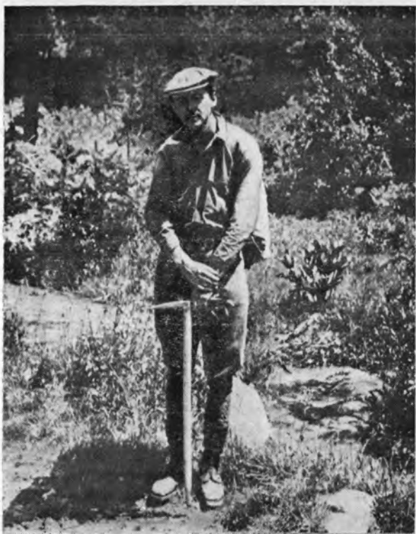
П. Дирак на Кавказе, 1936 г.