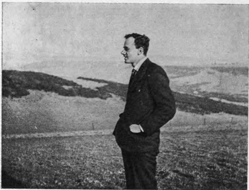
П. Дирак (30-е годы). Фотография из архива П. Л. Капицы

Как дела с ездой на мотоцикле? Я ездил на гамовском мотоцикле, и меня засняли на пленку за этим занятием (так что у меня есть положительное доказательство).