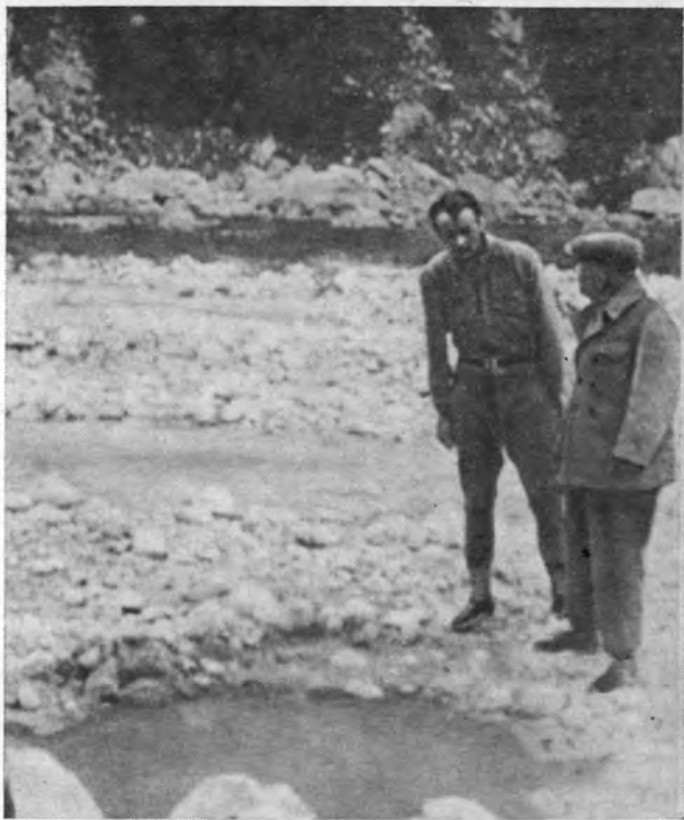
П. Дирак и И. Е. Тамм на Кавказе, 1936 г

недавно устроился в качестве профессора теоретической физики (в конце концов это оказался совсем не волжский университет). В Томске имеется университет и физический исследовательский институт, второй по значимости из наших провинциальных институтов (после Харькова) 3 .