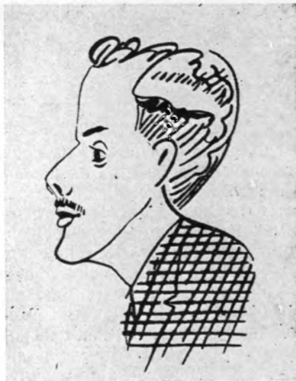
П. Дирак на 1-й Всесоюзной ядерной конференции. Ленинград, 1933 г.