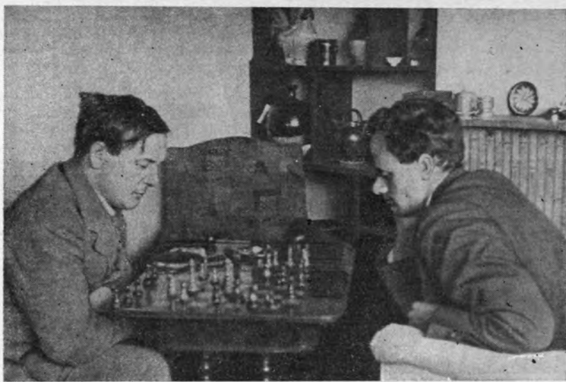
П. Л. Капица и П. Дирак. Кембридж, 1928 г.