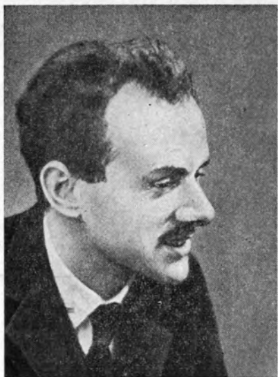
Ранний портрет Дирака