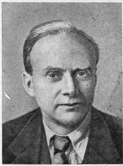
П. Дирак (50-е годы)

Таким образом, поиски Дираком прекрасных с математической точки зрения обобщений математических формализмов существующих теорий чуть ли не на протяжении всей его жизни направлялись по крайней мере двумя конкретными математическими программами (в дополнение к общей стратегии «математического прорыва» и «математической красоты»): теоретико-групповой, или теоретико-инвариантной, и ориентацией на казавшуюся ему «математически прекрасной» аналитическую механику, прежде всего гамильтонов формализм. При любых обобщениях классики или квантовой теории, с точки зрения «гамильтоновой программы», следует исходить из гамильтоновых формулировок существующих теорий. При этом «математическая красота», присущая гамильтонову подходу, не может уменьшиться. Иначе говоря, ориентация на «гамильтоновость», по мнению Дирака, обеспечивает неубывание «математической красоты» в эволюции физических теорий. О поразительной универсальности и эффективности гамильтонова, или канонического, формализма при решении задач