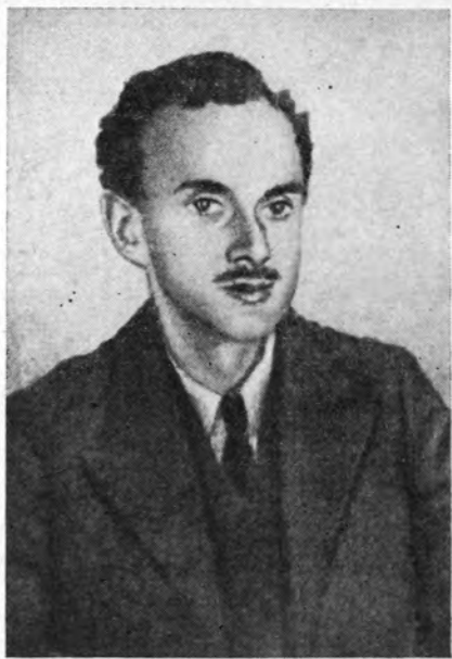
П. Дирак Портрет, написанный Я. И. Френкелем в 1936 г.