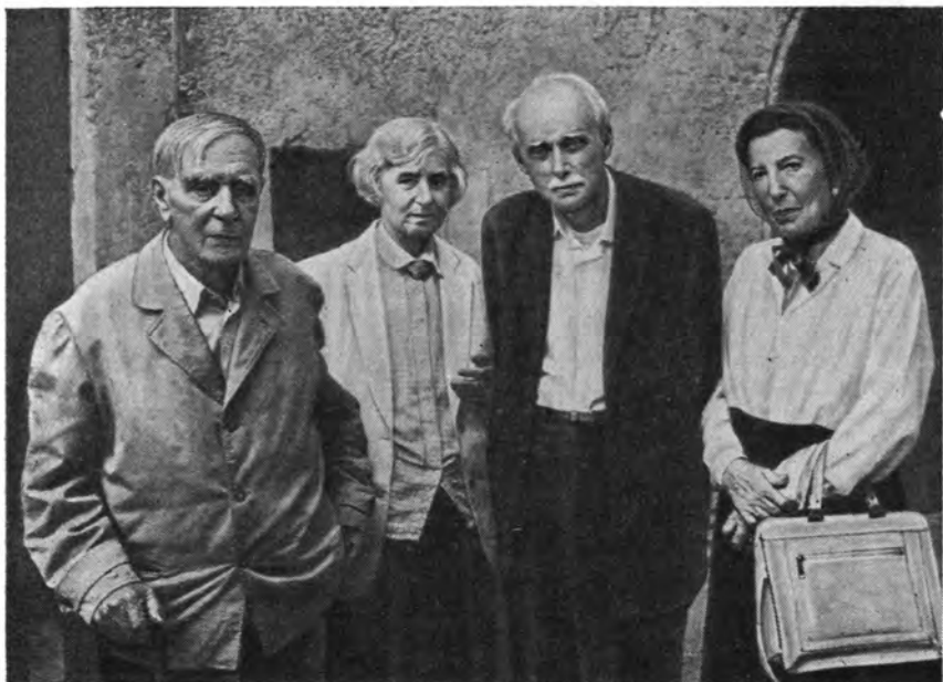
П. Л. Капица и П. Дирак с женами, Эриче (Италия), 1982 г.

помощником в магнитной лаборатории Кавендиша и в Мондовской лаборатории.