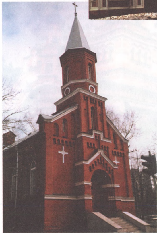
Кирха (лютеранская церковь)