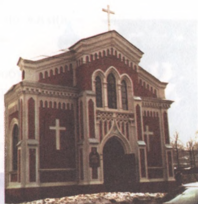
Костел (римско-католическая церковь)