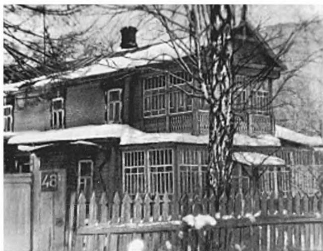
Кучино, под Москвой. Дом Шиповых, где Андрей Белый жил в 1925—1931 гг.