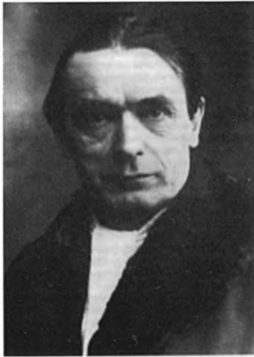
Рудольф Штейнер. 1917