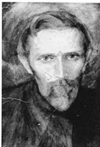
Михаэль Бауэр. Портрет работы Маргариты Волошиной. Около 1926