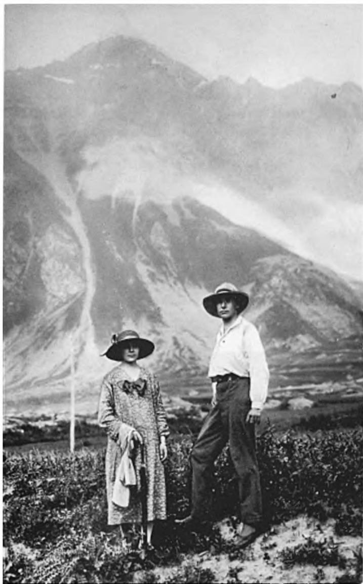
Андрей Белый и К. Н. Васильева (Бугаева). Военно-Грузинская дорога, ст. Казбек. 8 июля 1927 г.