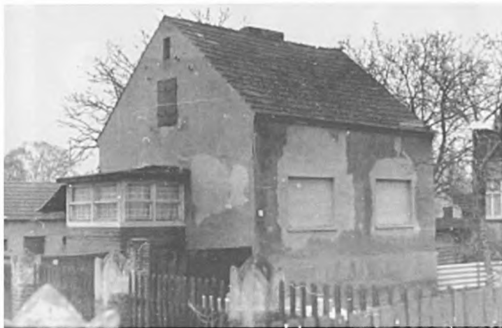
Цоссен. Штубенраухштрассе, 37 (ранее — 68). Дом, где жил Андрей Белый в июне 1922 г. Фотоснимок 1986 г.