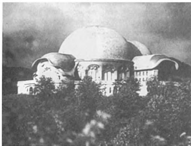
Гетеанум. Вид с юго-запада. 1920