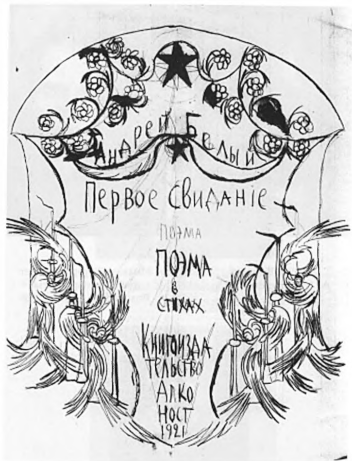
Андрей Белый. Эскиз обложки поэмы «Первое свидание» (РГАЛИ)