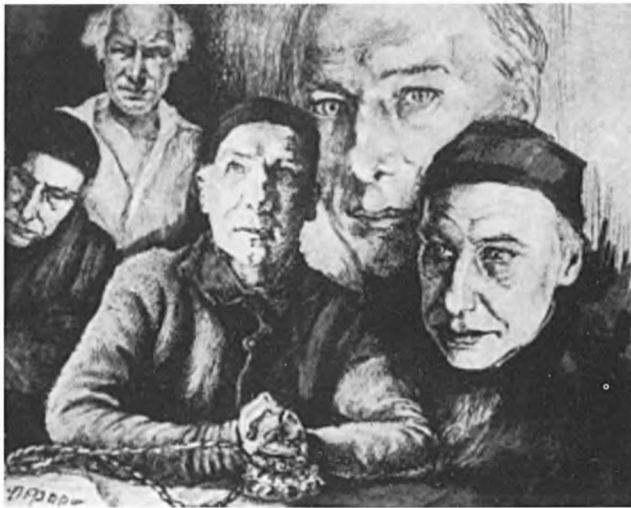
О. Д. Форш. Синтетический портрет Андрея Белого. 1933—1934