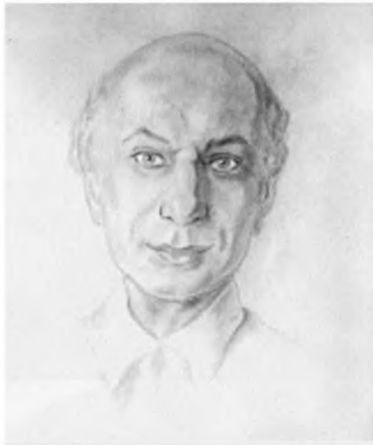
Андрей Белый. Портрет работы Н. Вышеславцева. Карандаш. 1933