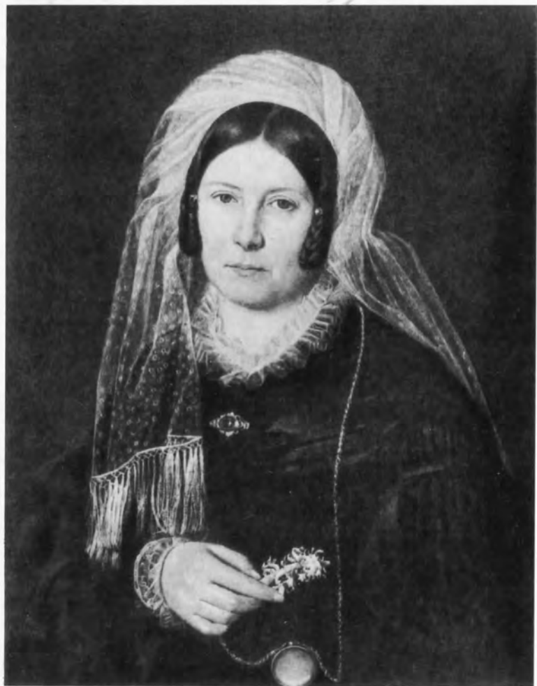
Екатерина Андреевна Карамзина. Неизвестный художник. 1830-е гг.