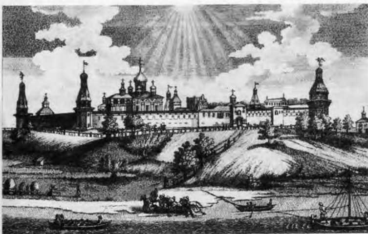
Московский Симонов монастырь. Старинная гравюра.