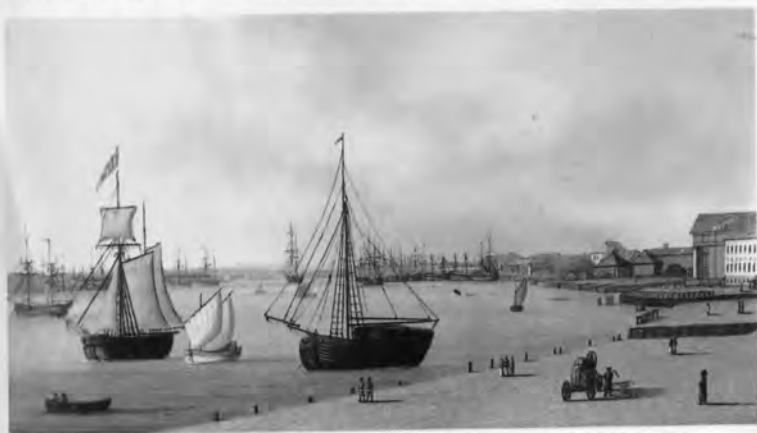
Вид на Неву и Финский залив. Акварель Ж. Делабарта.