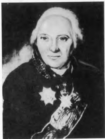
Николай Николаевич Бантыш-Каменский.