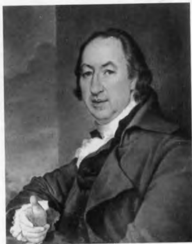
Николай Иванович Новиков.