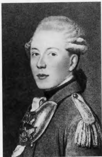
Андрей Иванович Вяземский.