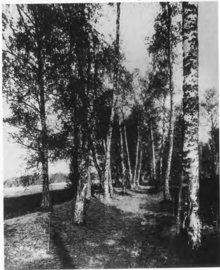
Карамзинская аллея в парке усадьбы Остафьево под Москвой. Фотография 1907 г.