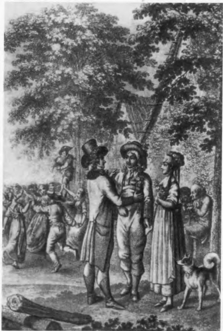
Иллюстрация к немецкому изданию «Писем русского путешественника»: «Ты очень счастлив, мой друг!» (нем.). Иллюстрация авторизована Карамзиным; «можно думать, что фигура путешественника близко воспроизводит костюм автора во время заграничной поездки» (Ю. М. Лотман).