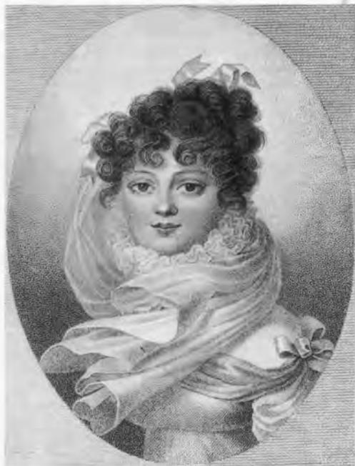
Великая княгиня Екатерина Павловна, сестра Императора Александра I.