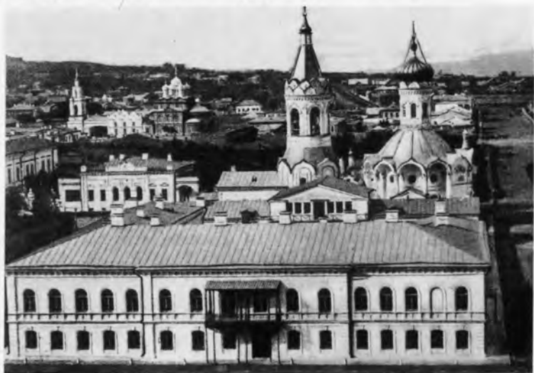
Вид города Симбирска. Фотография 2-й половины XIX в.