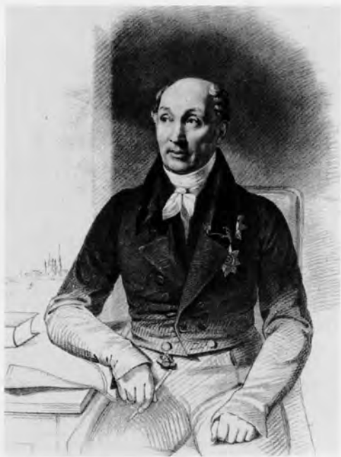
Михаил Михайлович Сперанский.