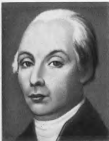
Александр Николаевич Радищев.