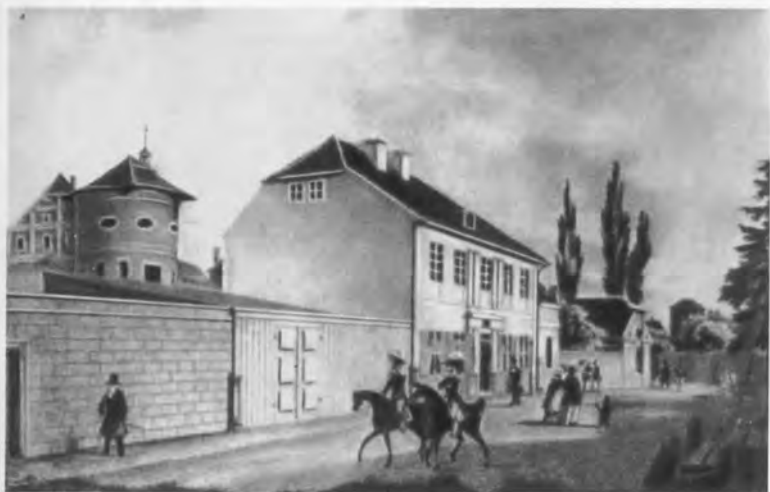
Кенигсберг. Дом Канта.