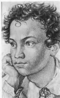
Александр Сергеевич Пушкин.