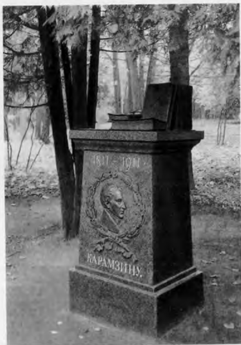
Памятник Н. М. Карамзину в усадьбе Остафьево.