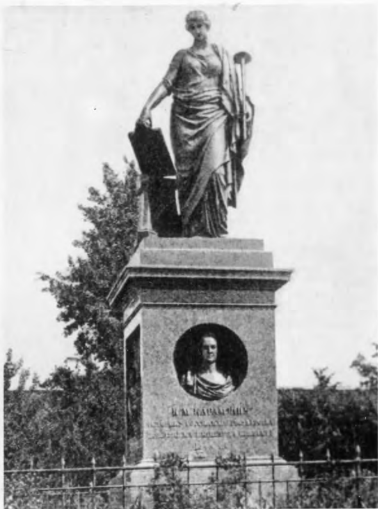
Памятник Н. М. Карамзину в Симбирске.