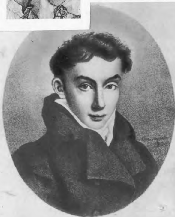
Василий Андреевич Жуковский.

победителя ученику, ать побежденного — учителя. поэт высочайшего достоинства, а по таланту — поэту Руслану и Людмиле 1820 Марта 26 Великаго пятница