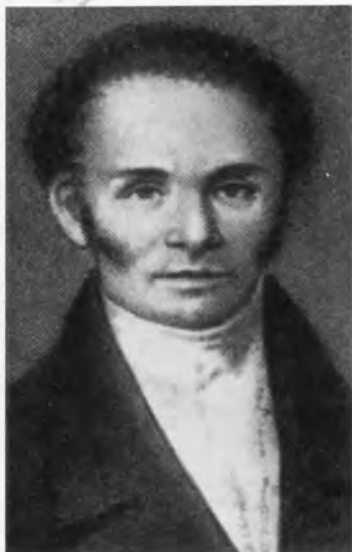
Константин Федорович Калайдович.

Здание Московского главного архива Коллегии Иностранных дел в Хохловском переулке.