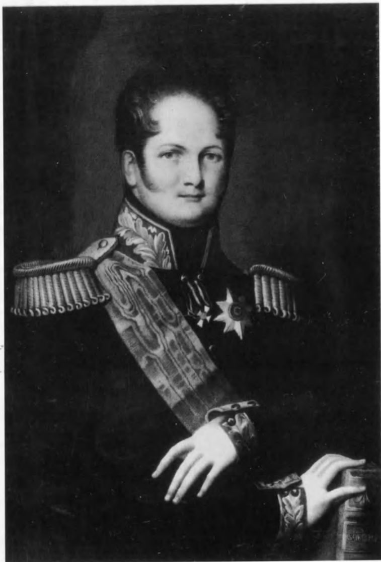
Император Александр I.