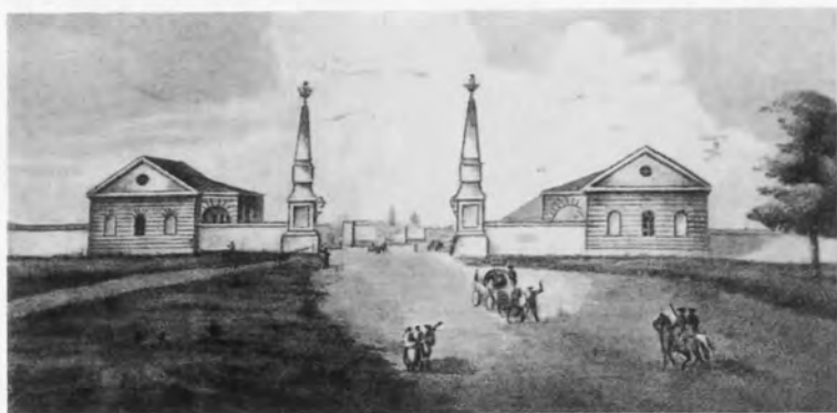
Тверская застава в Москве. Акварель. Конец XVIII в.