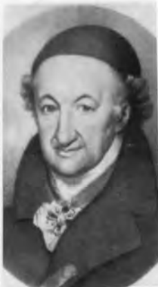
Кристоф Мартин Виланд.