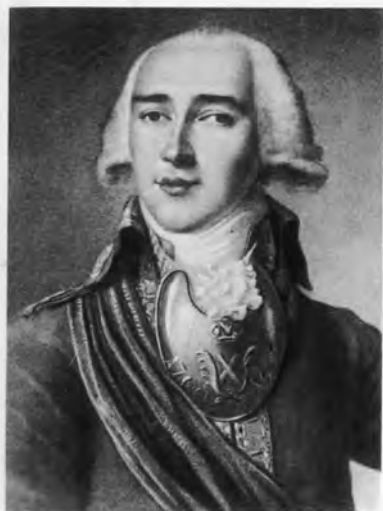
Иван Иванович Дмитриев.