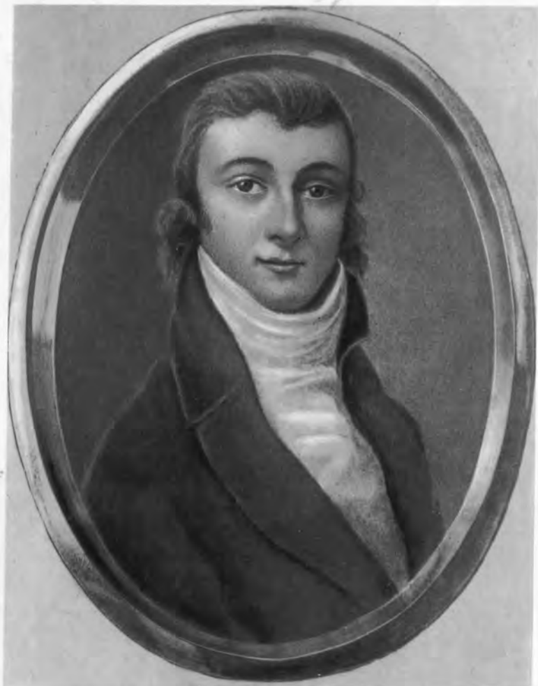
Молодой Карамзин. Миниатюра на кости неизвестного автора.

Из донесения обер-полицеймейстера Санкт-Петербурга Рыльева Императрице Екатерине II относительно лиц, прибывающих в Петербург и отъезжающих оттуда, за 1790 г. (Российский государственный архив древних актов, XVI разряд Госархива, № 534. Ч. I. Л. 127—127 об.): «Июля 16-го дня... Из Москвы отставной Поручик Николай Карамзин (в тексте ошибочно: Карамзан) и стал в той же части в доме купца Демута».