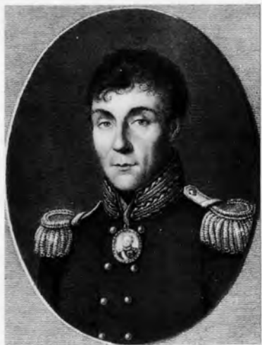
Алексей Андреевич Аракчеев.