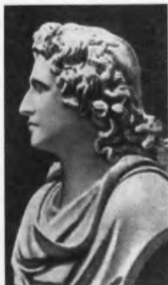
Иоганн Вольфганг Гёте. Мраморный бюст работы А. Триппеля. 1787—1788 гг.