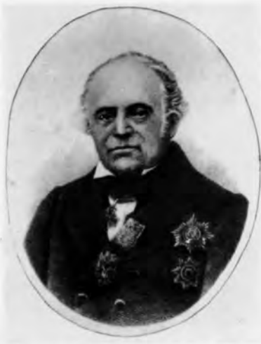
Дмитрий Николаевич Блудов.