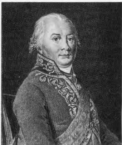
Михаил Никитич Муравьев.