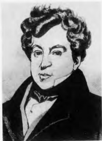
Александр Иванович Тургенев.