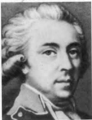
Алексей Иванович Мусин-Пушкин.

Дом А. И. Мусина-Пушкина на Разгуляе. Акварель середины XIX в.