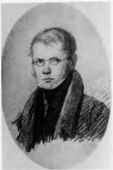
Петр Андреевич Вяземский.

Карамзинская комната в усадьбе Остафьево. Фотография 1907 г.