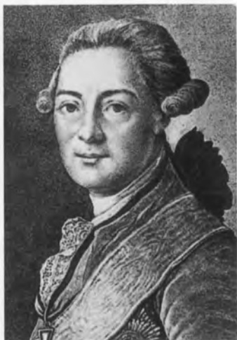
Михаил Матвеевич Херасков.

Вид Москвы от Каменного моста. С гравюры М. Эйхлера. 1796 г.