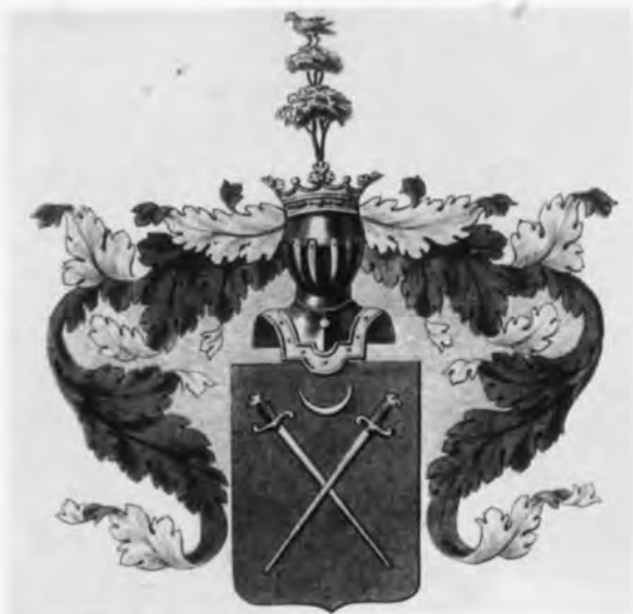
Герб рода Карамзиных.