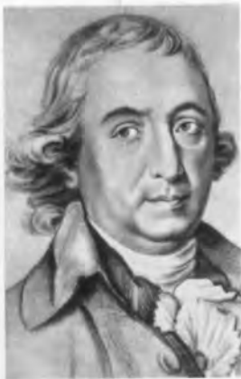
Иоганн Готфрид Гердер.

Вид Лейпцига. Акварель Гейслера. XVIII в.