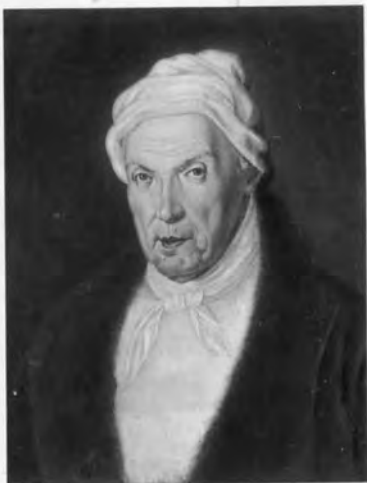
Гаврила Романович Державин.

Дом «Дружеского общества» в Кривоколенном переулке, где жил Н. М. Карамзин. Литография середины XIX в.