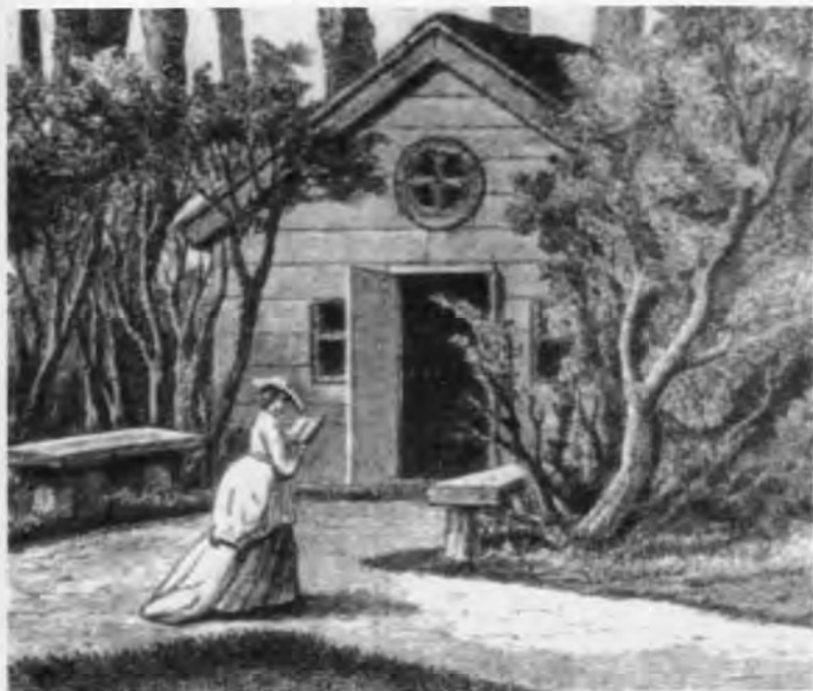
Беседка, посвященная «Бедной Лизе» и находившаяся недалеко от Симонова монастыря. Гравюра начала XIX в.