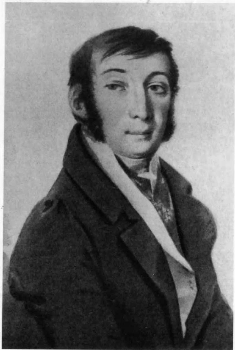
Н. М. Карамзин в 1800-е гг. Акварель художника Молинали.