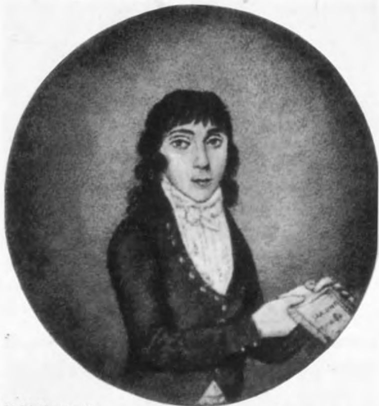
Н. М. Карамзин. Миниатюра неизвестного художника. XVIII в.