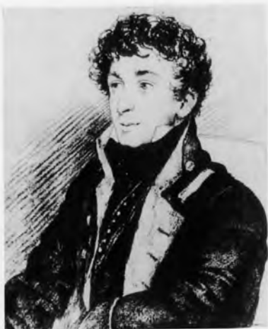
Константин Николаевич Батюшков.