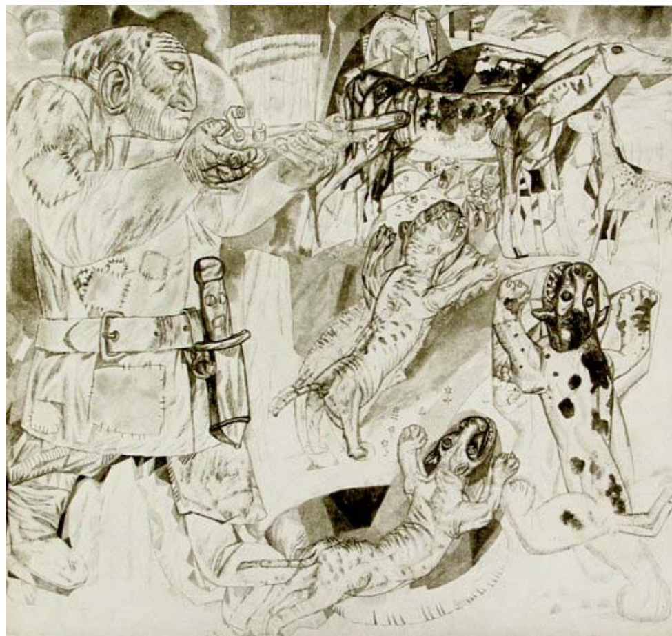
Рисунок П. Филонова из книги «Пропевень о проросли мировой» (1915)