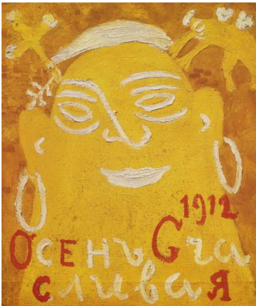
М. Ларионов. Осень счастливая (1912)