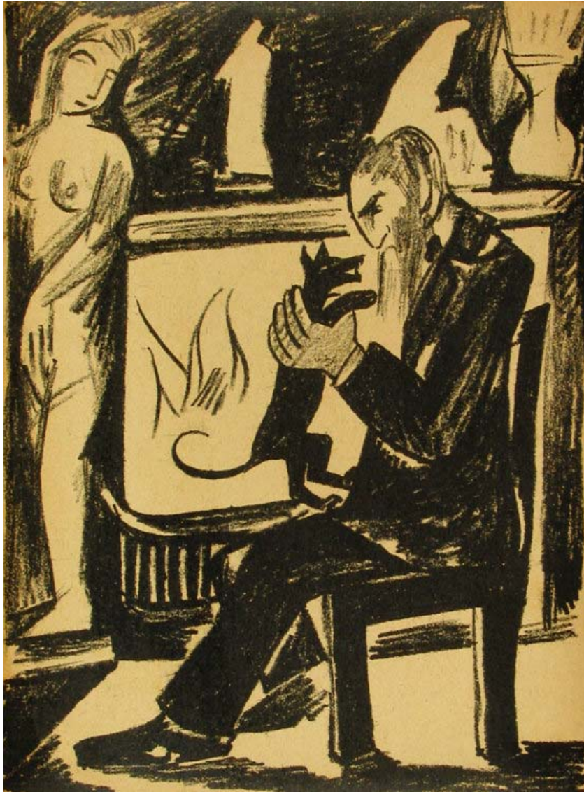
Иллюстрация Н. Гончаровой к книге А. Крученых «Две поэмы: Пустынный. Пустынница» (1913)