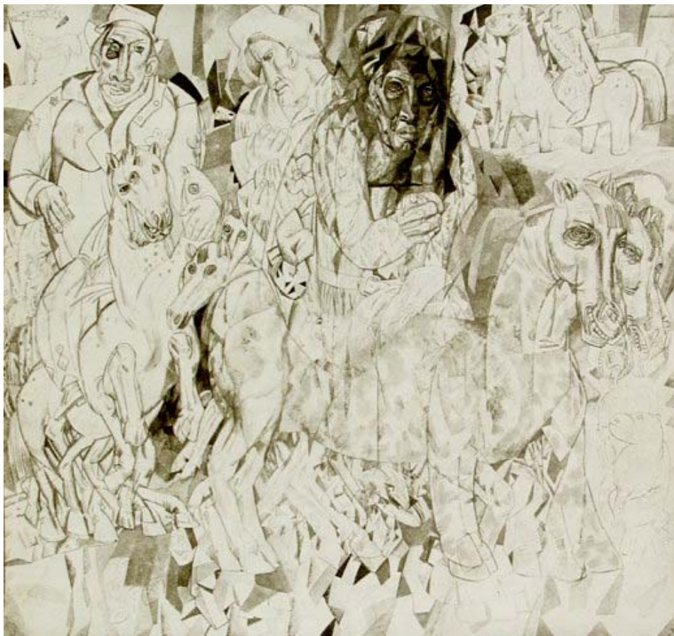
П. Филонов. Принцип чистой действующей формы . Иллюстрация к книге «Пропевень о проросли мировой» (1915)