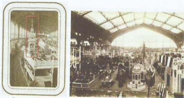
Фото атмосферной электростанции, которая очень похожа на звонницу современных церквей

О достижениях допотопной цивилизации, мы можем прочитать в фантастической литературе XIX века. На неё обратил наше внимание, ставший ныне известный новохронолог Олег Павлюченко, обнаружив у В.Ф. Одоевского описание высокого уровня развития допотопной цивилизации Землян в рассказе «Письмо китайского студента» (4338-й год). Где описаны и полёты, и подземные поезда, и фантастические сооружения. И всё это относилось к началу XIX века.