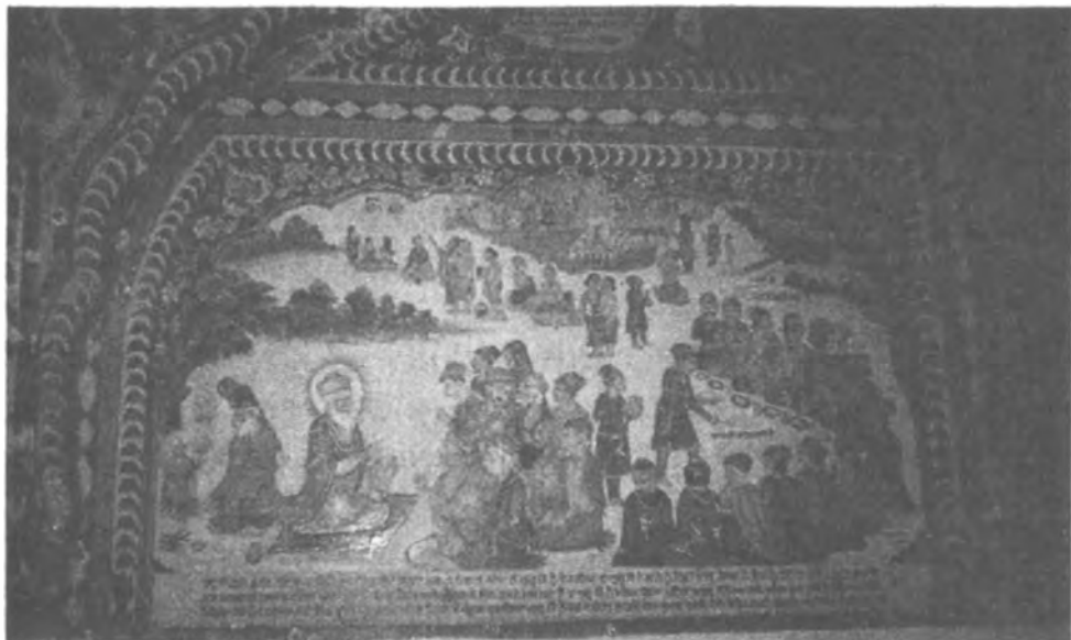
Гуру Нанак беседует с учениками. Фреска. Из комплекса «Атал Баба».

Основатель сикхизма гуру Нанак проповедовал свой путь спасения, знание которого было обретено им в Божественном откровении. Он был учителем, гуру , и звал за собой последователей, учеников, то есть сикхов (буквально: «ученик»). Гуру Нанак учил, что все люди равны — и индусы, и мусульмане, независимо от касты и рождения. Потому что все — дети Божьи и равны перед Ним. Сикхи так и называли друг друга — «братья», бхаи . Эта идея сразу привлекла к гуру Нанаку множество последователей, прежде всего жителей Панджаба. Исследователи отмечают, что основную массу сторонников сикхизма на начальном этапе его распространения составляли индуисты из каст невысокого уровня и мусульмане — земледельцы, мелкие торговцы и средние слои горожан. И учитель смог предложить им не только свою концепцию мироустройства и путь познания Бога, но и способ существования, вполне удобный