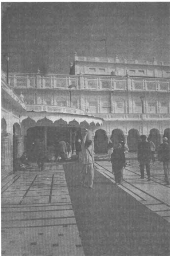
Сикх совершает сева — добровольный трудовой подвиг на пользу общины.