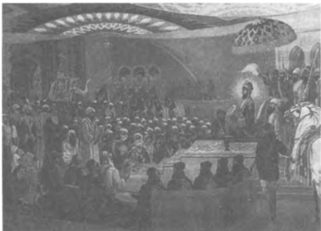
Собрание нихангов в Анандтуре