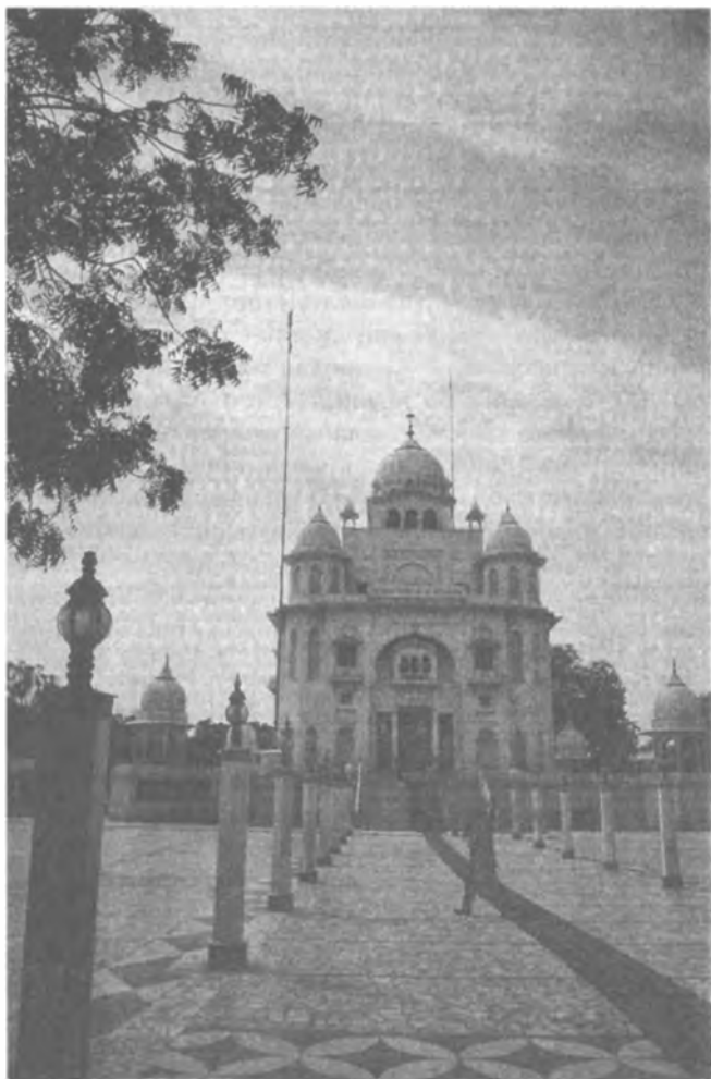
Гурдвара Рикаб Гандж, Дели.