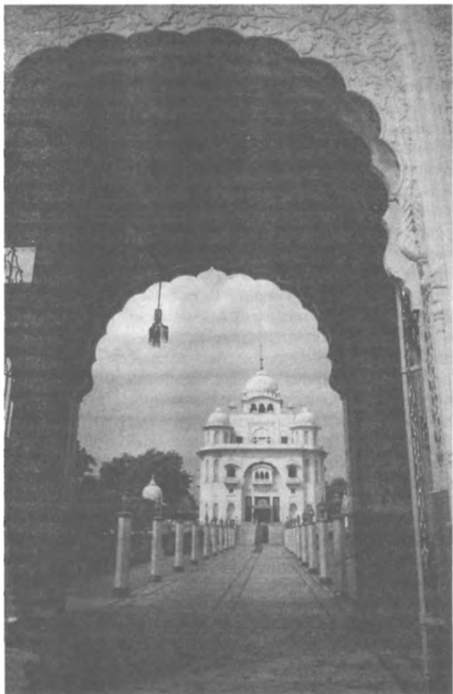
Вход в гурдвару Рикаб Гандж.