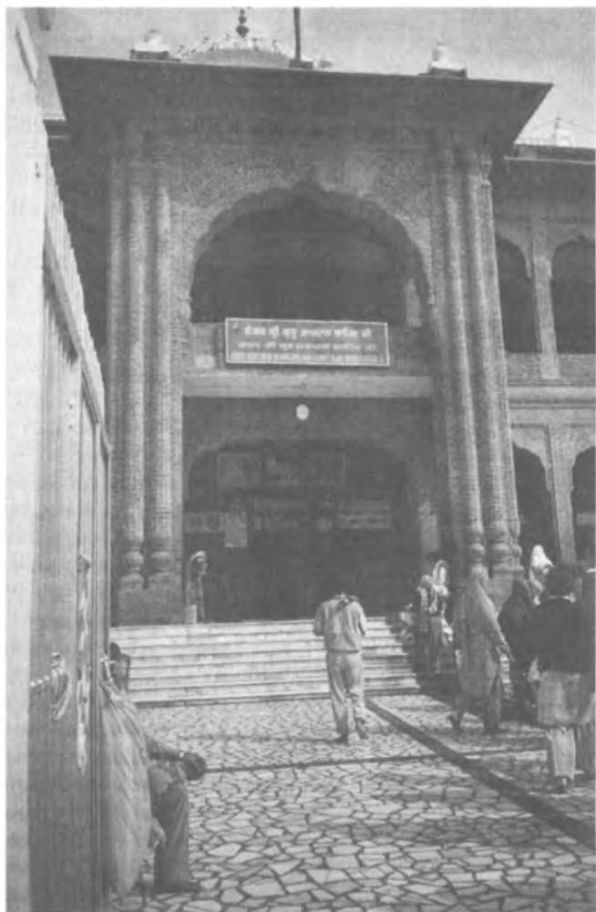
Гуру-ка лангар (общественная столовая). Амритсар.