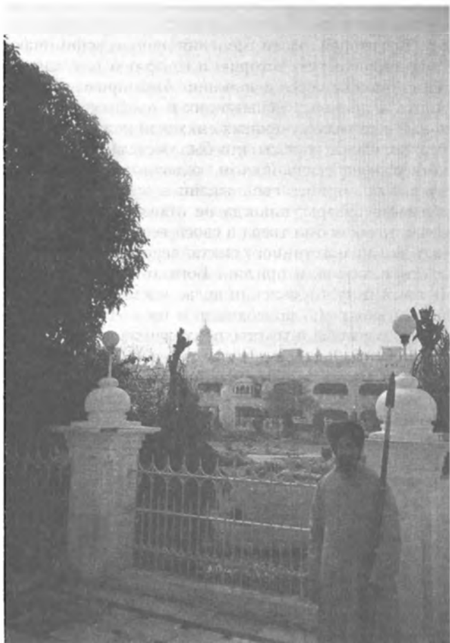
Ниханг — защитник храма.