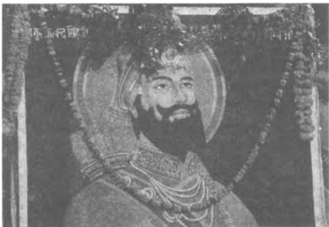
Гуру Гобинд Сингх

Сикхский Бог не имеет имени. Он может быть назван Анаам , то есть Безымянный. Лучше всего,