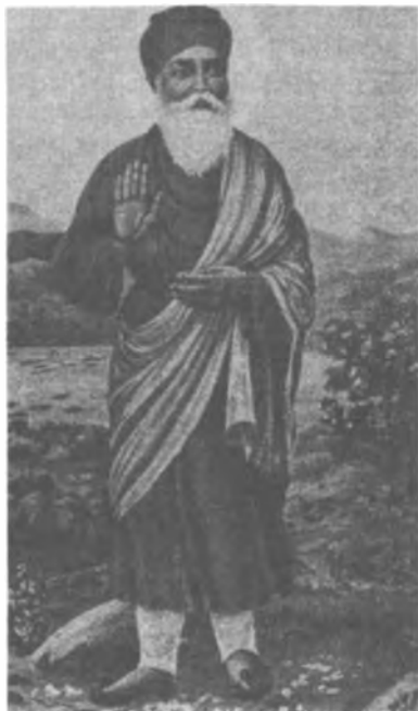
Гуру Нанак. Литография

свою гостиницу в бесплатный приют для путников и стал ревностным сторонником сикхского гуру.