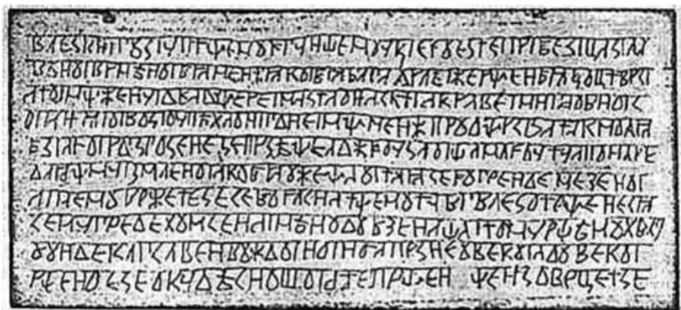
Единственная «дощечка» «Велесовой книги»