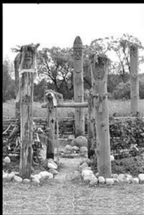
КАПИЩЕ РОДНОВЕРОВ ПОСТРОЕНО В XXI ВЕКЕ

СЛЕВА - ТО, ЧТО НЕОЯЗЫЧНИКИ ХОТЯТ РАЗРУШИТЬ, СПРАВА - ТО, ЧТО ОНИ ХОТЯТ ДАТЬ НАМ ВЗАМЕН