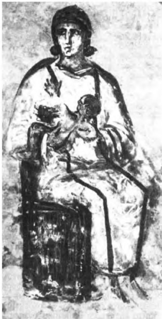
Божия Матерь. 3-4 в. Фреска

Послушаем теперь, что говорит Организация. Они считают, что, кроме Иисуса, у нее были и другие дети. На чем же они основывают свои предположения? Оказывается, на том простом основании, что несколько раз в Новом Завете говорится о неких «братьях Иисуса». Кто же такие эти та-