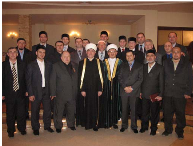
Рис. 2. Актив ДУМ Поволжья

Мусульманские религиозные группы, не являющиеся юридическими лицами, есть во всех районах области.