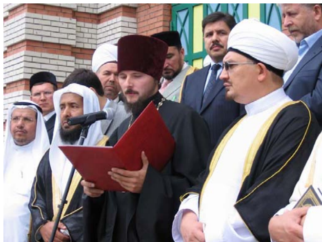
Рис. 3. Открытие мечети 21 сент. 2005 г.