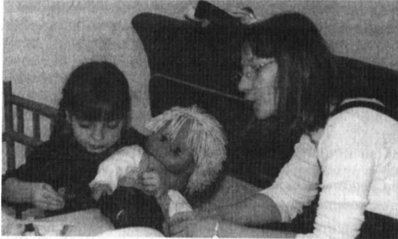
Діти звичайно проігрують сімейні сюжети з допомогою

Терапевтичні відносини можна встановити і підтримувати, тільки якщо терапевт розуміє мову дитини. Можливо передбачити, що все, що дитина робить і каже в ігровій кімнаті, має значення. Однак навіть для досвідченого терапевта непросто зрозуміти ті повідомлення, які містяться в грі дитини. Запитувати дитину про сенс його гри часто марно. Результатом цього буде опір і мовчання. Підходящі іграшки полегшують для терапевта завдання розуміння дитячої гри. Так, наприклад, діти звичайно проігрують сімейні сюжети з допомогою кукол, зображують маму, тата і дітей. В відсутність таких кукол дитина може символічно грати в сім'ю, використовуючи великі і маленькі дерев'яні кубики. Але точне значення цього повідомлення може сослизнути від терапевта. Коли дитина ударяє кубики один об одного, це може означати і покарання, і сексуальний контакт, а може бути, дитина просто випробовує терпимість терапевта до шуму. Коли дитина засовує олівець в точилку, це також може означати сексуальний контакт, а може означати тільки те, що олівець треба поточити. Однак якщо дитина кладе куклу-тата на куклу-маму, у терапевта