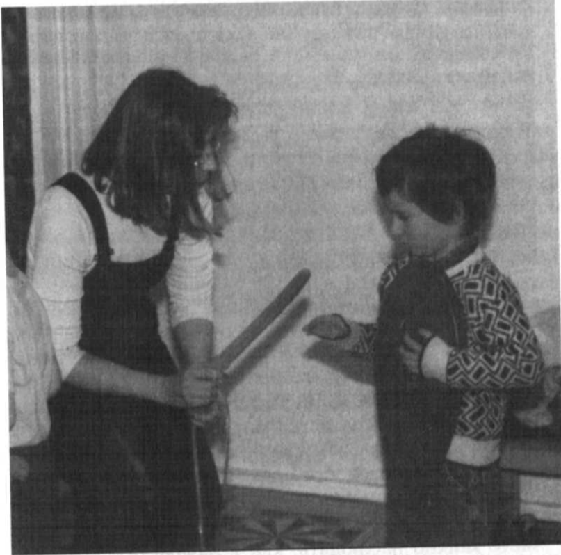
Многие дети, особенно пугливые, участвуют скрыто в качестве зрителей в тех действиях, которые они хотели бы совершить, но не решаются

другими членами группы, которые напоминают ему о реальности. С другой стороны, гиперактивные дети могут стать менее активными и более вдумчивыми под нейтрализующим воздействием их более спокойных товарищей по группе. В результате как замкнутые, так и сверхактивные дети достигают здорового равновесия между внутренним миром фантазии и внешним миром реальности.