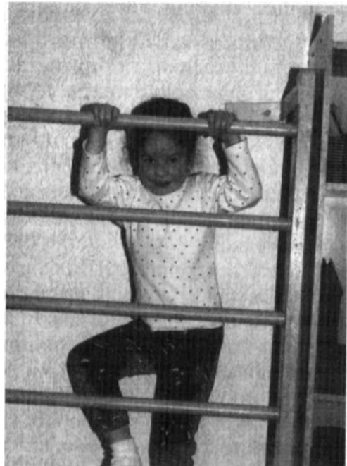
Ребенок будет испытывать свои силы до тех пор, пока не поднимется до самого верха «лестницы успеха»

Детское стремление к свободному передвижению часто подавляется родителями, которые чрезмерно беспокоятся о безопасности своего ребенка. Ограничения подвижности обычно начинаются в жизни ребенка очень рано: младенца могут ограничивать, когда он пытается встать в своей коляске, ребенка более старшего возраста — когда он пытается подняться по лестнице или бегать по всей комнате. Важно, чтобы в игровой комнате были приспособления, которые позволяли бы реализовать активные действия, например, бегать, карабкаться и прыгать в обстановке психологической безопасности. В каждой комнате должен быть вертикальный шест, веревочная лестница или крепкий шкаф. Маленькому ребенку может потребоваться много времени, чтобы добраться до верхушки снаряда. В течение этого периода он будет испытывать свои силы в отношении к растущей высоте, своему страху, ограниченности и растущему мастерству, до тех пор пока не поднимется до самого верха на этой «лестнице успеха».