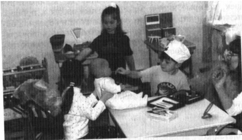
Дружелюбный взрослый, привлекательные игрушки и партнеры по игре затрудняют ребенку возможность оставаться замкнутым