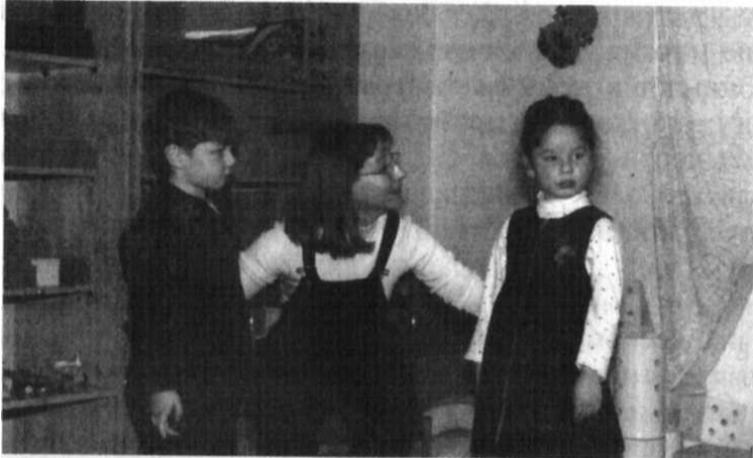
Присутствие нескольких детей, на наш взгляд, облегчает установление раппорта между терапевтом и каждым ребенком в отдельности

Варьирование в полноте и богатстве этих пяти элементов объясняют в значительной степени различия в результатах, достигнутых в ходе различных терапевтических практик. Мы воспользуемся