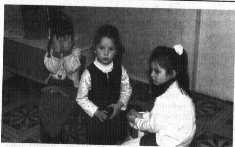
Должно пройти достаточно времени, прежде чем замкнутый ребенок почувствует себя настолько свободно, что станет активным в игровой комнате

Иногда дети боятся самостоятельно сделать выбор в игровой комнате, потому что им всегда говорили, что делать. Они могут умолять терапевта сделать выбор за них. Для терапевта особенно важно в этом случае — не входить в ожидаемую роль родителя. Лучше вербализовать затруднительное положение ребенка: «Ты привык, что тебе всегда говорят, что делать. Мама всегда говорит тебе, что делать. Тебе страшно, когда я разрешаю тебе делать то, что ты хочешь».