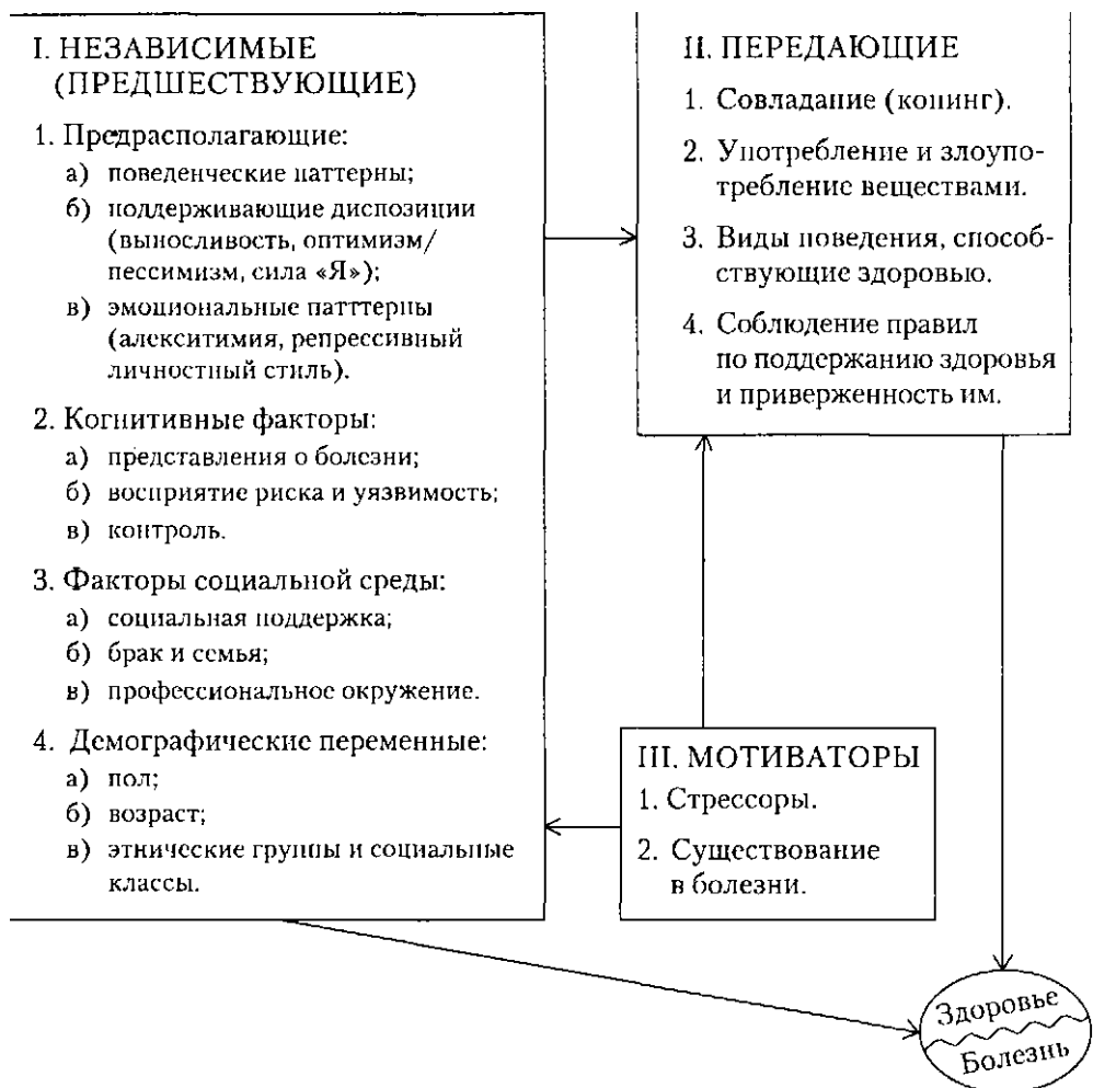
Рис. 1.1. Факторы, влияющие на болезнь и/или здоровье

Анализируя литературу по психологии здоровья, можно выделить три основные группы психологических факторов, коррелирующих со здоровьем и болезнью: независимые, передающие и мотиваторы (рис. 1.1) ЦЗ].