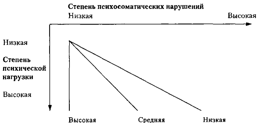
Рис. 20.3. Соотношение между социальной поддержкой, степенью психической нагрузки и психосоматических нарушений (House & Wells, 1978).

Проблематика социальной поддержки в течение многих лет находится в центре внимания исследований психической нагрузки, стратегий преодоления стресса. Многочисленные исследования показывают взаимозависимость между степенью психической нагрузки, подверженностью психосоматическим заболеваниям и мерой социальной поддержки (рис. 20.3).