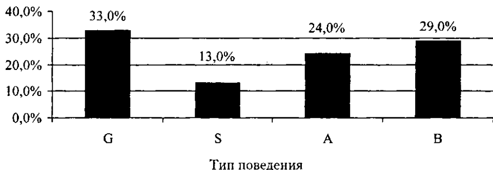
Рис. 20.2. Распределение типов поведения и переживания обследованных студентов согласно опроснику A VEM

Оценку степени психической нагрузки студентов отражают отдельные шкалы опросника AVEM . В табл. 20.2 представлены средние значения и стандартные отклонения показателей шкал опросника.