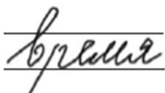
Рис. 1. «Время»

Трудно сказать, учитывали ли это современные графологи, однако в своем анализе основной элемент письма – букву – они тоже делят на три части. Посмотрите на эту схему.