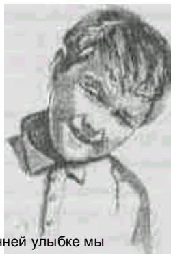
При искренней улыбке мы сощуриваем глаза и приподнимаем

Антропологи считают, что улыбка соответствует звериному оскалу, который впоследствии стал жестом выражения доверия, доброй воли, симпатии, готовности к перемирию, доб-