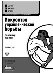
ВЛАДИМИР ТАРАСОВ ИСКУССТВО УПРАВЛЕНЧЕСКОЙ БОРЬБЫ