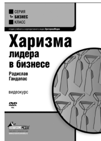
РАДИСЛАВ ГАНДАПАС ХАРИЗМА ЛИДЕРА В БИЗНЕСЕ