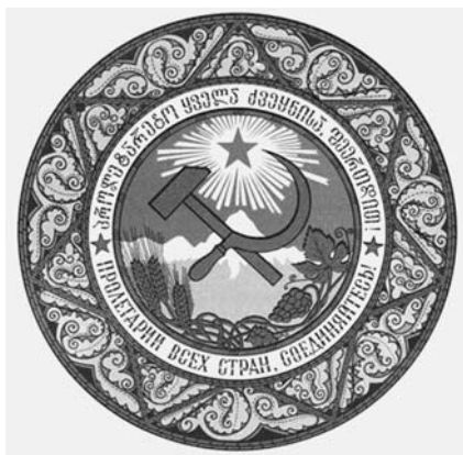
Герб Грузинской ССР

В 1924 году, после подавления прокатившихся по Грузии беспорядков, Сталин предложил для умиротворения (!!!) грузинского общества расширить территорию Советской Грузии за счет соседних народов. Помимо уже входивших в неё Аджарии, Абхазии и Южной Осетии Сталин предложил присоединить к Грузинской Республике Северную Осетию, Ингушетию и Сунженский округ. В результате этих преоб-