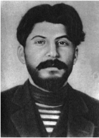
И.В. Сталин (1912 г.)

ного проживания национальных меньшинств прокатились восстания, начали образовываться национальные правительства, объявлявшие о своей независимости от Грузии. Все эти выступления были подавлены Тбилиским режимом с такой неслыханной жестокостью, о которой ненавистные ему российские власти не могли даже помыслить.