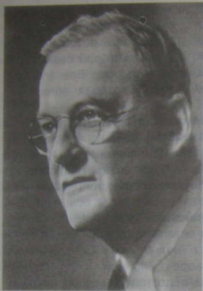
Джон Ф. Даллес

Какова же была реакция советского правительства? В памятной записке правительству США от 20 ноября 1950 г. оно просило разъяснить, в частности, как следует понимать содержащееся в меморандуме предложение о передаче вопроса относительно статуса Формозы, Пескадорских островов, Южного Сахалина и Курильских островов на новое решение США, Великобритании, Китая и СССР, а в случае, если эти государства не достигнут в течение года соглашения, — на решение Генеральной Ассамблеи ООН. Ведь известно, говорилось в памятной записке, что вопрос о возвращении Китаю Формозы и Пескадорских островов уже решен Каирской декларацией от 1 декабря 1943 г., подписанной США, Великобританией и Китаем, и Потсдамской декларацией от 26 июля 1945 г., подписанной теми же странами, к которым присоединился Советский Союз. Равным образом Ялтинское соглашение от 11 февраля 1945 г., подписанное США, Великобританией и СССР, решило вопрос о возвращении Советскому Союзу южной части Сахалина с прилегающими островами и о передаче СССР Курильских островов 1 .