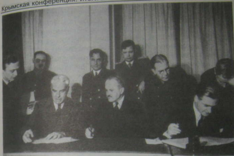
Ялта. Э. Стеттиниус, В. М. Молотов и А. Иден подписывают соглашение

демократии ничего не могли сделать, для того чтобы не позволить русским вступить в эти районы" 1 .