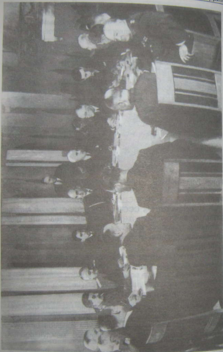
Ялта. Ливадийский дворец. И. В. Сталин, Ф. Рузвельт, У. Черчилль со своими делегациями заседают "за круглым столом".

отношений послевоенного времени, то мы не можем, хотя бы вкратце, не остановиться на этих решениях и не дать им своей оценки. При этом полный текст коммюнике о Крымской конференции и ее результатах приводится в конце книги в виде Приложения № 1.