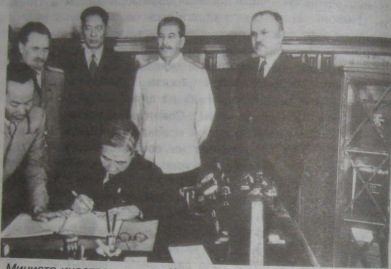
Министр иностранных дел Китайской Республики Ван Шицзе подписывает 14 августа 1945 г. Договор о дружбе и союзе между СССР и Китаем. Присутствуют Сун Цзывэнь, И. В. Сталин, В. М. Молотов, С. А. Лозовский

Были также заключены соглашения о Порт-Артуре, о порте Дальний, о Китайской Чанчуньской железной дороге и соглашение о взаимных отношениях между советским военным командованием и китайскими властями Маньчжурии после вступления в Маньчжурию советских войск.