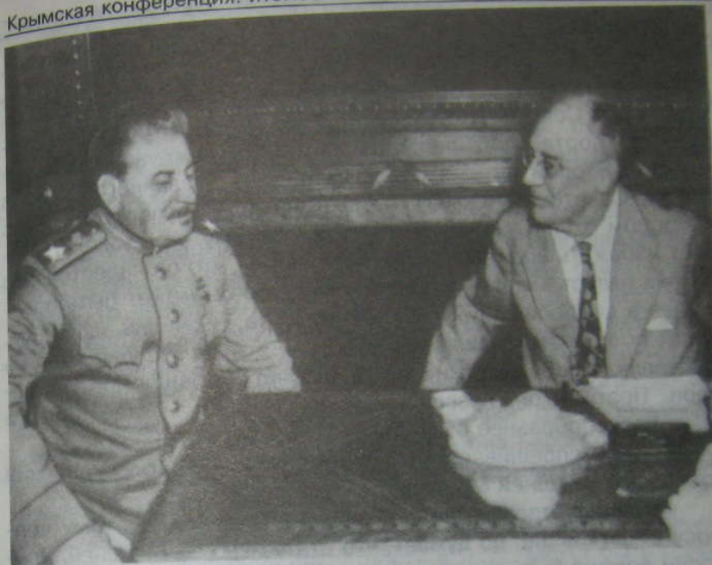
Беседа И. В. Сталина и Ф. Рузвельта

Сталин говорит, что в послании президента сказано, что нужно будет держать открытыми линии снабжения. Непонятно, что это означает.