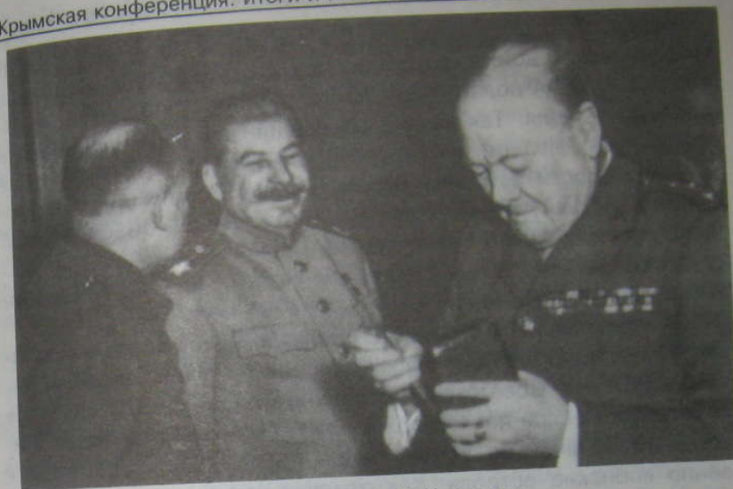
И. В. Сталин и У. Черчилль

пользование средств экономического давления против СССР сможет дать какой-то эффект. Он заявил Ванденбергу, что сокращение поставок по ленд-лизу нанесет такой же урон Соединенным Штатам, как и русским 1 .