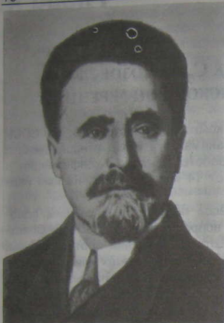
С.А. Лозовский (1946 г.)

в его войне против Германии, а Советский Союз отказывается помогать Англии и особенно США в их войне против Японии.