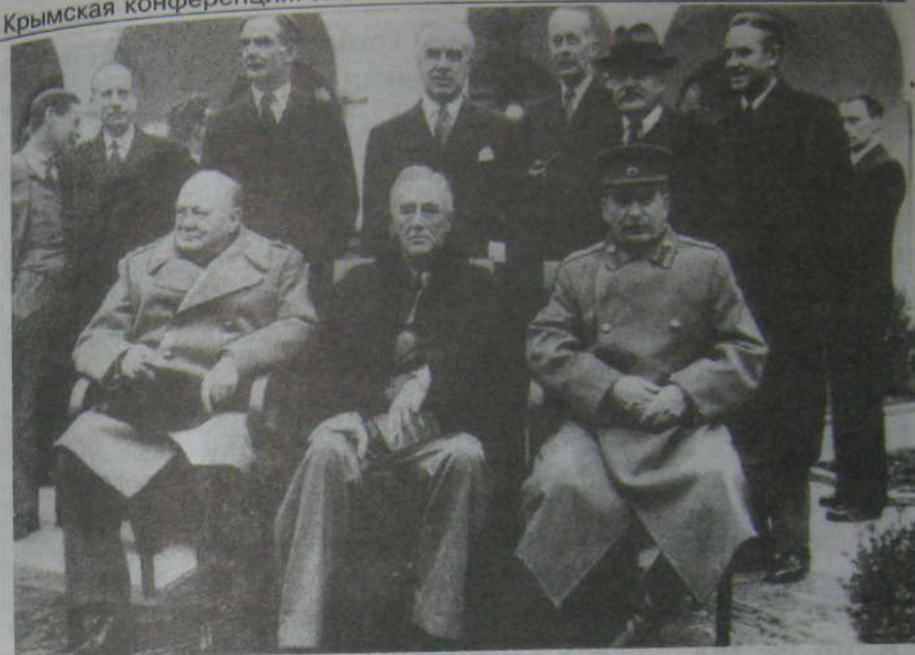
Ялта. И.В. Сталин, Ф. Рузвельт и У. Черчилль с руководителями своих внешнеполитических ведомств: Э. Стеттиниус, В. М. Молотов, А. Иден, А. Гарриман и др.

известно историкам, что статус Курильских островов никаким образом не затрагивался той войной. Они были переданы Японии царским правительством еще в 1875 г. в соответствии с Петербургским договором.