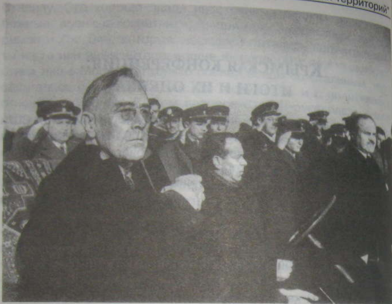
Крым. Аэропорт "Саки". Звучат гимны "Звездно-полосатый стяг" и "Интернационал". В джипе — президент США Ф. Рузвельт

ского ренессанса по проекту русского архитектора Краснова. Из дворца, расположенного на 150 футов над уровнем моря, открывалась великолепная панорама гор и моря на восток и север.