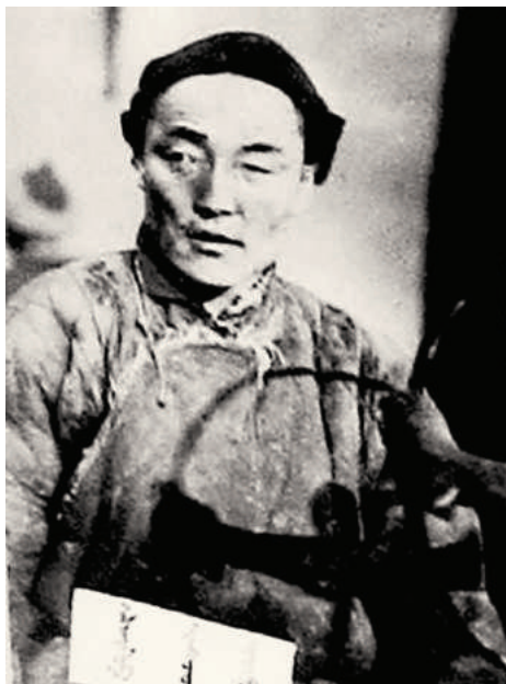
Ш. Жур (Монгольский национальный музей, Улаанбаатар).