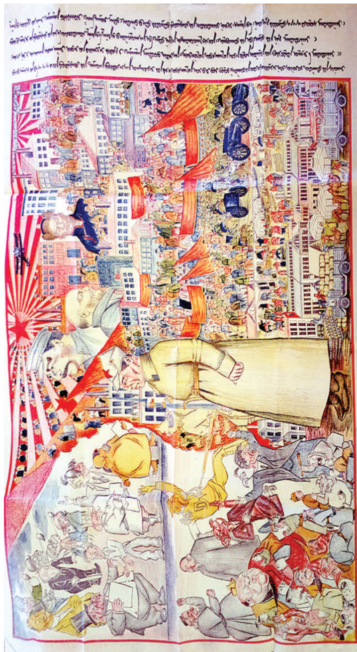
Плакаты 1931 г., изображающие во "враждебном окружении" МНР, идущую по пути социализма (РГАСПИ, ф. 495, оп. 152, д. 163, л. 1, 7).