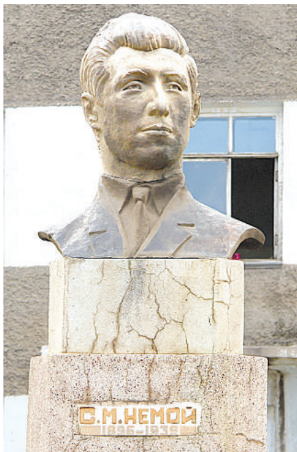
С.М. Немой (фото памятника, в настоящее время находящегося на территории городской больницы г. Цэцэрлэг. Легенда тур. 2011).