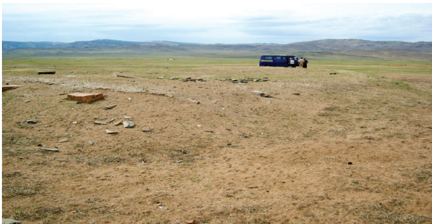
Тэсийн хурээ (Дуурэгч вангийн хурээ) после разрушения при строительстве социализма.