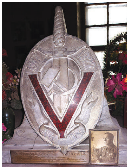
Е.Н. Исаков (колумбарий Донского кладбища, Москва).