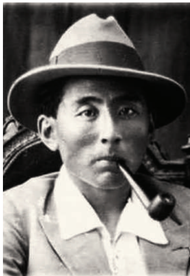
Г. Содном (Монгольский национальный музей, Улаанбаатар).