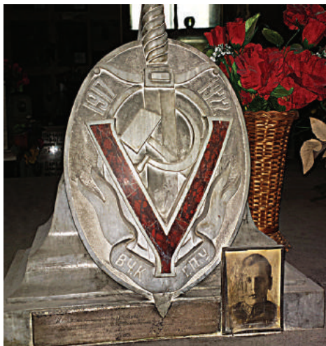
В.С. Кияковский (колумбарий Донского кладбища, Москва).