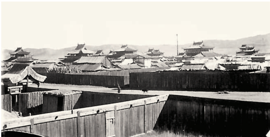
Тэсийн хурээ (Дуурэгч вангийн хурээ) до разрушения (Институт образования и культуры при монастыре Гандантэгченлин, Улаанбаатар).