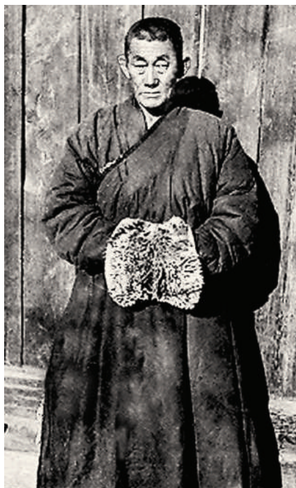
Буяндэлгэр (Институт образования и культуры при монастыре Гандантэгченлин, Улаанбаатар).