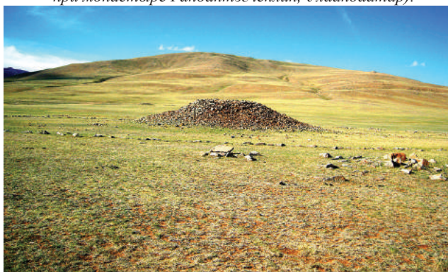
Жалханз хурээ после разрушения при строительстве социализма (Copyright Arts Council of Mongolia. Taken in the summer of 2007 as part of the Documentation of Mongolian Monasteries project).