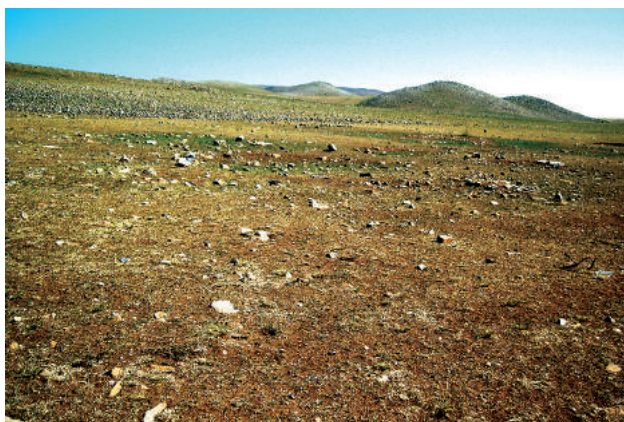
Хялгант хурээ после разрушения при строительстве социализма.