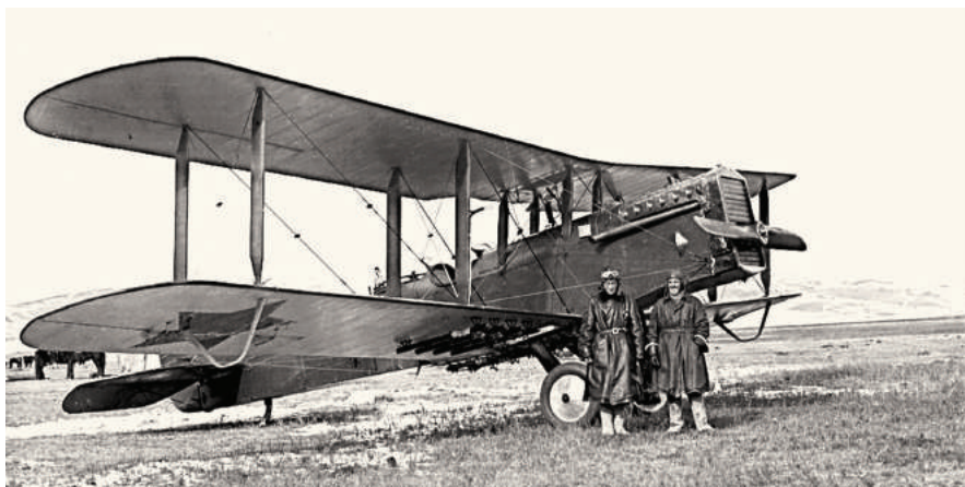
Самолет Поликарпов Р-1 (EAP264_1_6_9-EAP264ML_Box112_004_L: http://eap.bl.uk/database/large_image.a4d?digrec=754847;r=15724 ; определил С.Л. Кузьмин).