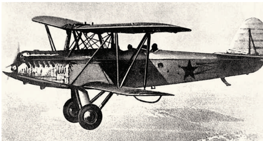
Самолет Поликарпов Р-5 ( http://upload.wikimedia.org/wikipedia/commons/d/dc/Polikarpov_R-5.JPG ).