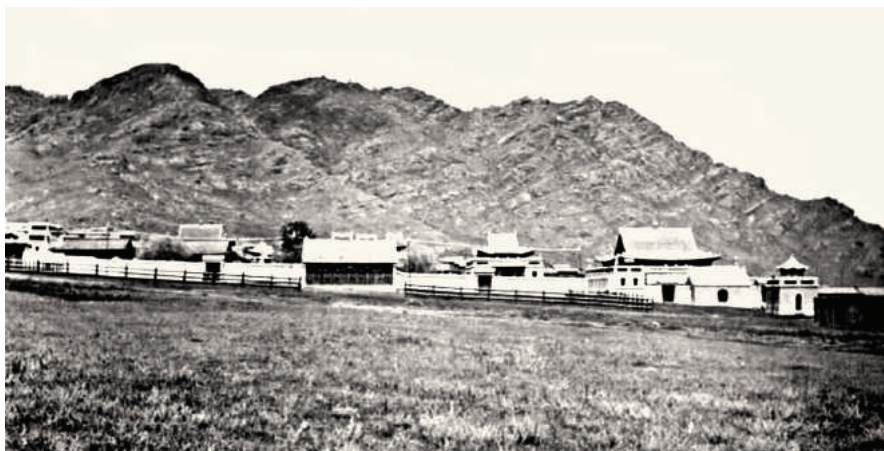
Рашиантын хурээ до разрушения ( https://www.facebook.com/media/set/?set=pcb.511732242272214&type=1 ).