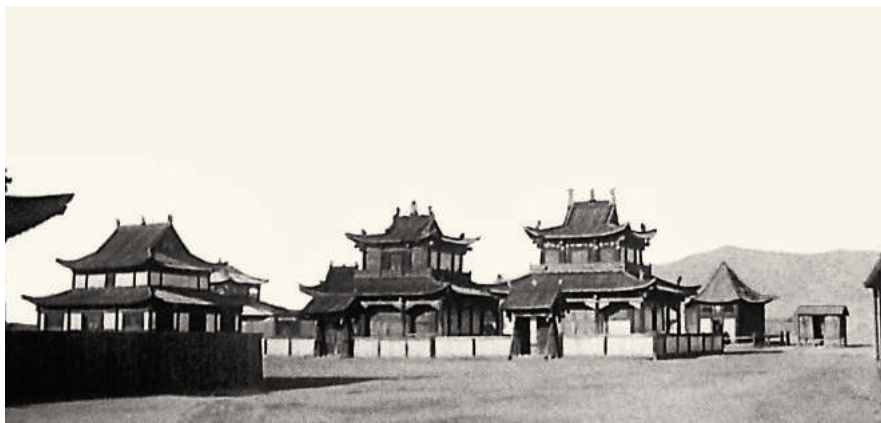
Мурунгийн хурээ до разрушения (Институт образования и культуры при монастыре Гандантэгченлин, Улаанбаатар).