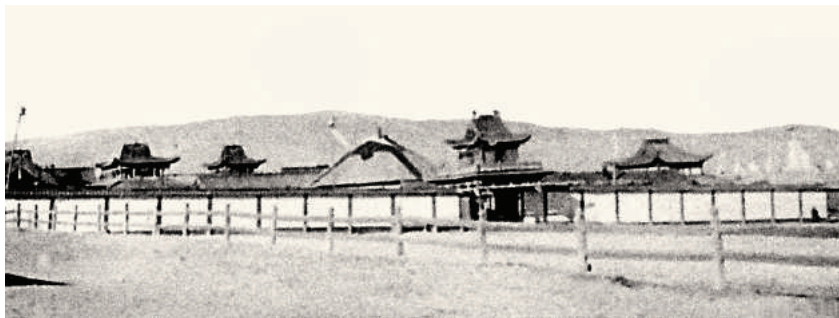
Жалханз хурээ до разрушения (Институт образования и культуры при монастыре Гандантэгченлин, Улаанбаатар).