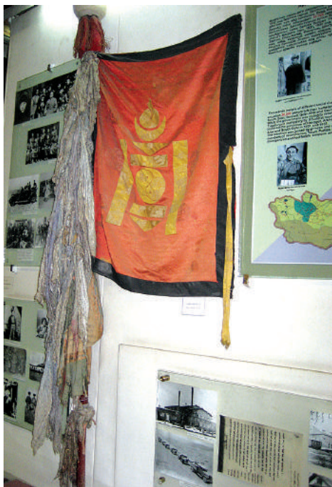
Знамя Ч. Самбуу дувчина (Монголын Үндэсний музей).