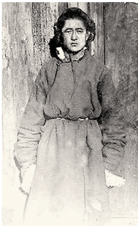
Ананд (Институт образования и культуры при монастыре Гандантэгченлин, Улаанбаатар).