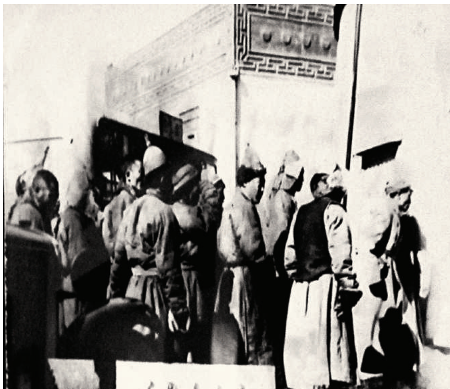
Контрреволюционеры идут на суд (Музей репрессий, Улаанбаатар).