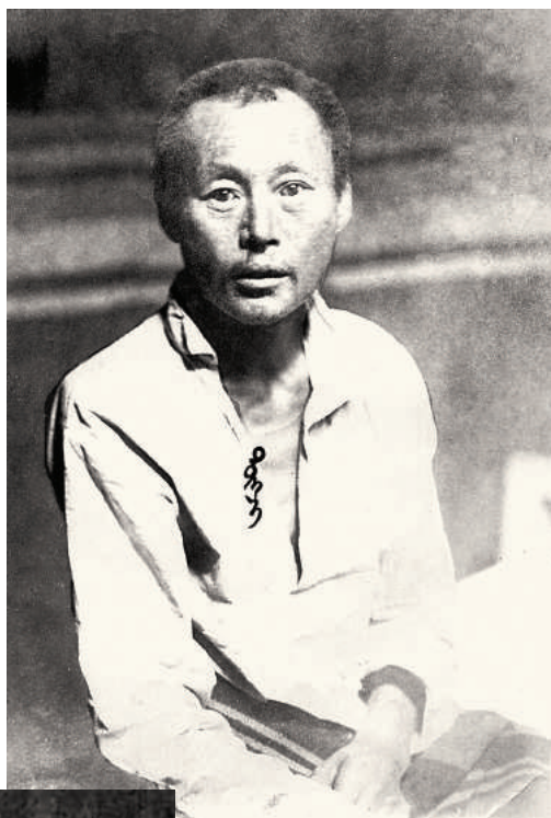
Б. Тугж (Монгольский национальный музей, Улаанбаатар).