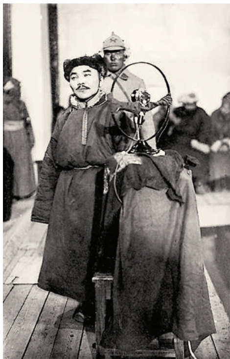
Руководители повстанцев на суде (Монгольский национальный музей, Уланбаатар).