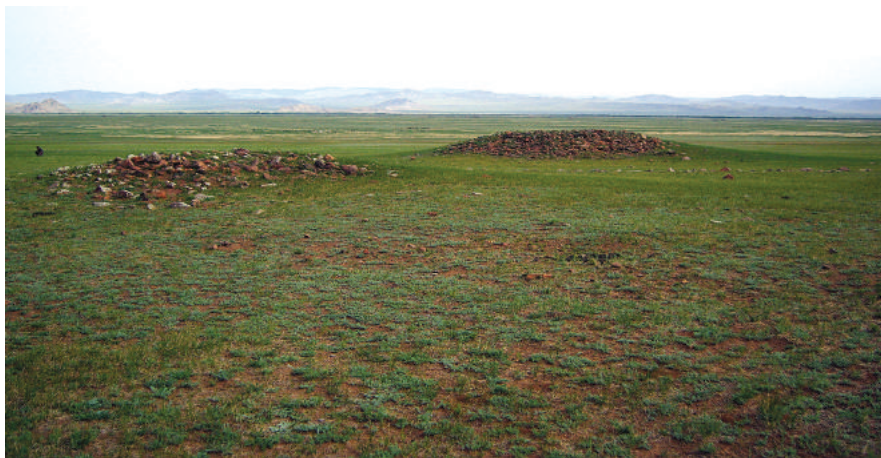
Бугсийн хурээ после разрушения при строительстве социализма (Copyright Arts Council of Mongolia. Taken in the summer of 2007 as part of the Documentation of Mongolian Monasteries project).