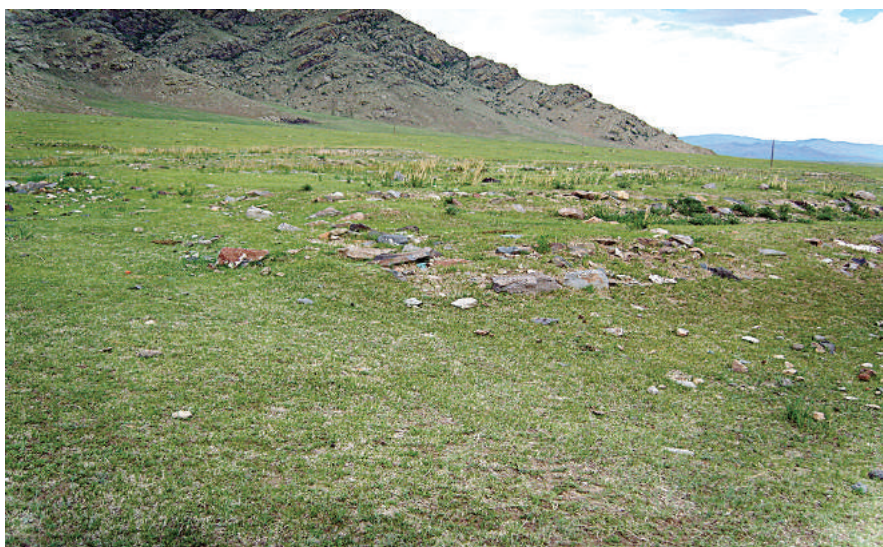
Рашаантын хурээ после разрушения при строительстве социализма (Copyright Arts Council of Mongolia. Taken in the summer of 2007 as part of the Documentation of Mongolian Monasteries project).