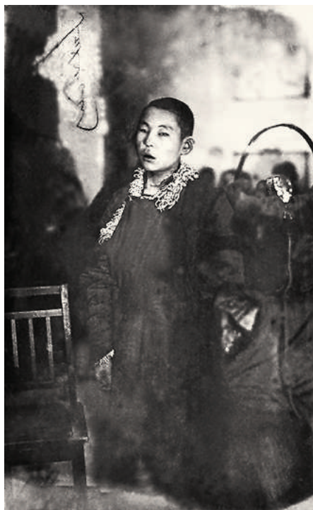
Хамба гэгээн Очиржанцан (Институт образования и культуры при монастыре Гандантэгченлин, Улаанбаатар).