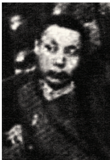
Ц. Жамц (Гадаадас турхирсан..., 2013, с. 125).