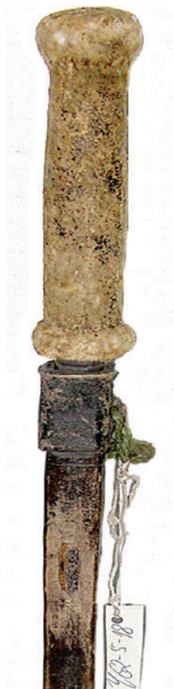
"Палка" (вероятно, пика) (Монгольский национальный музей, Улаанбаатар).