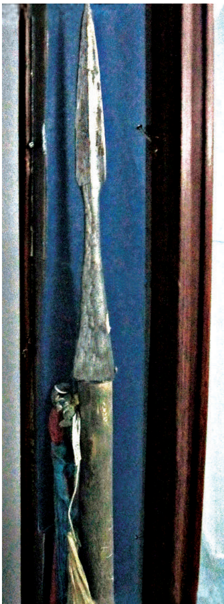
Оружие, которое использовали повстанцы (Музей репрессий, Улаанбаатар).