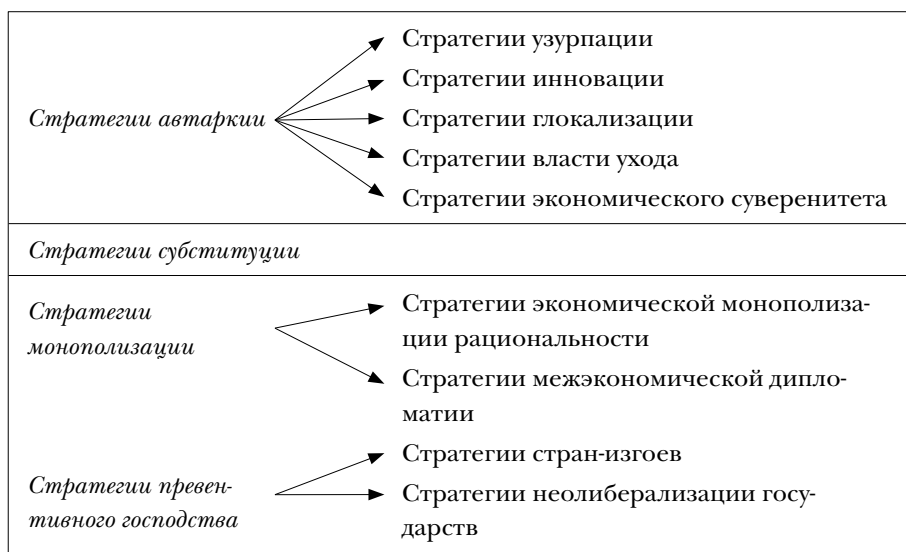
Таблица 7. Всемирно-экономические стратегии капитала

Этот идеал государства, приспособленного к мировому рынку, находит свое соответствие в том, что для государственных акторов (а также НПО и т. п.) исключаются определенные опции, возможности; другие же альтернативы для принятия решений им, напротив, задаются . Это означает, что метавласть ограничивает пространство опций того, что вообще еще можно выбрать среди политических альтернатив.