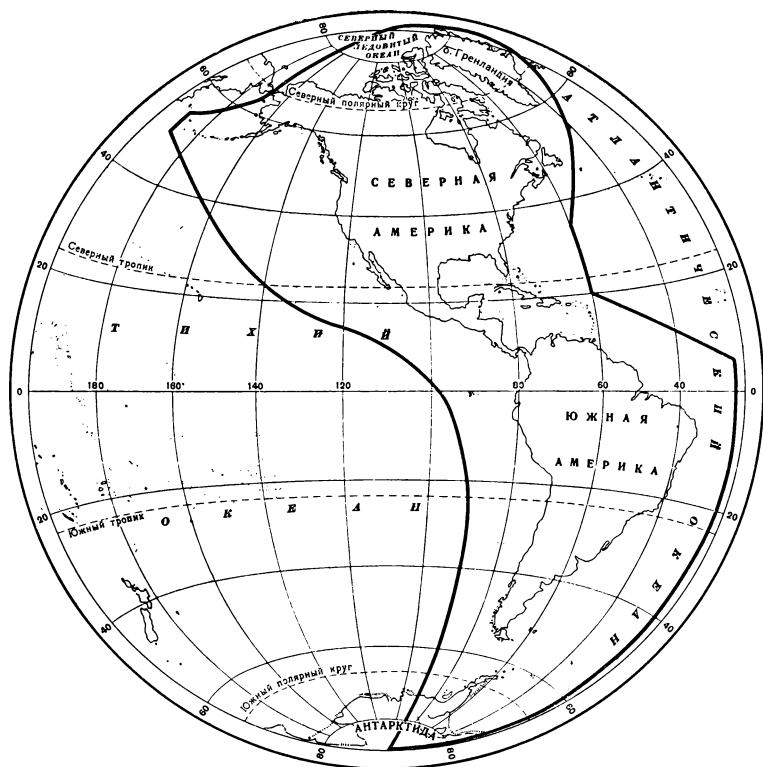
«Межамериканская зона безопасности»

сударства будут затронуты агрессией, не представляющей собой вооруженного нападения, или же внутриконтинентальным или внеконтинентальным конфликтом, или любым другим фактом или ситуацией, которые могут угрожать миру Америки, Консультативный орган должен немедленно собраться с целью согласования мер, которые должны быть приняты в случае агрессии, чтобы оказать помощь жертве агрессии, или — в любом другом случае — мер, которые должны быть приняты для общей обороны и для сохранения мира и безопасности континента. Статья 6 ничего не говорит о том, что указанные действия требуют одобрения со стороны ООН. Это не случайно. Договор 1947 г. вообще никакого контроля со стороны ООН в отно-