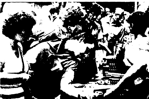
А 23 и 24 июля тысячи книголюбов