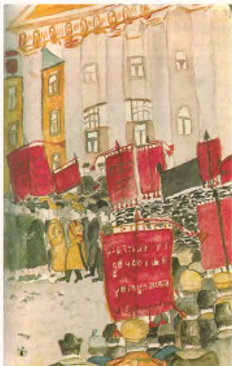
Детский рисунок. На рисунке изображены события февраля 1917 г. в Москве. 1917