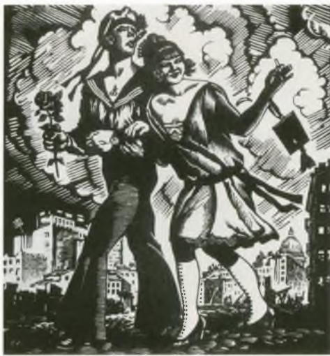
Б.М. Кустодиев. «Матрос и милая». Линогравюра. 1926