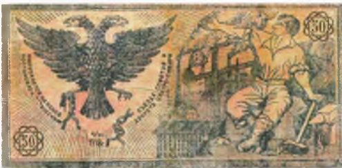
Кредитный билет Центрального Исполнительного комитета Советов Сибири. Август 1918

Открытка: «Свободная Россия свободной армии». Для художника двуглавый орел, освещенный «солнцем свободы», продолжает оставаться национальным символом России. Однако короны заменены старинными шлемами, а держава и скипетр – мечом и свитком с надписью «Просвещение». Свободную армию символизирует воин с красным стягом