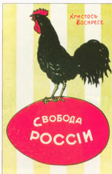
Пасхальные почтовые открытки. 1917