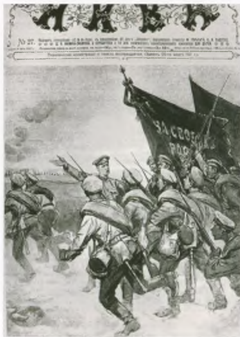
Обложка журнала «Нива», посвященного Июньскому наступлению