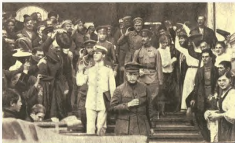
Московское государственное совещание (август 1917 г.). Фотография. Морской адъютант А.Ф. Керенского в новой летней форме