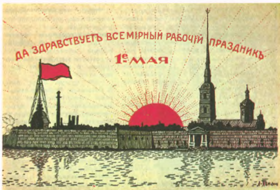
Петропавловская крепость, бывшая «русская Бастилия», изображается как символ «новой жизни»: над ней водружен красный флаг, над крепостью встает «солнце свободы». По воле художника солнце встает на севере. Почтовая открытка. 1917