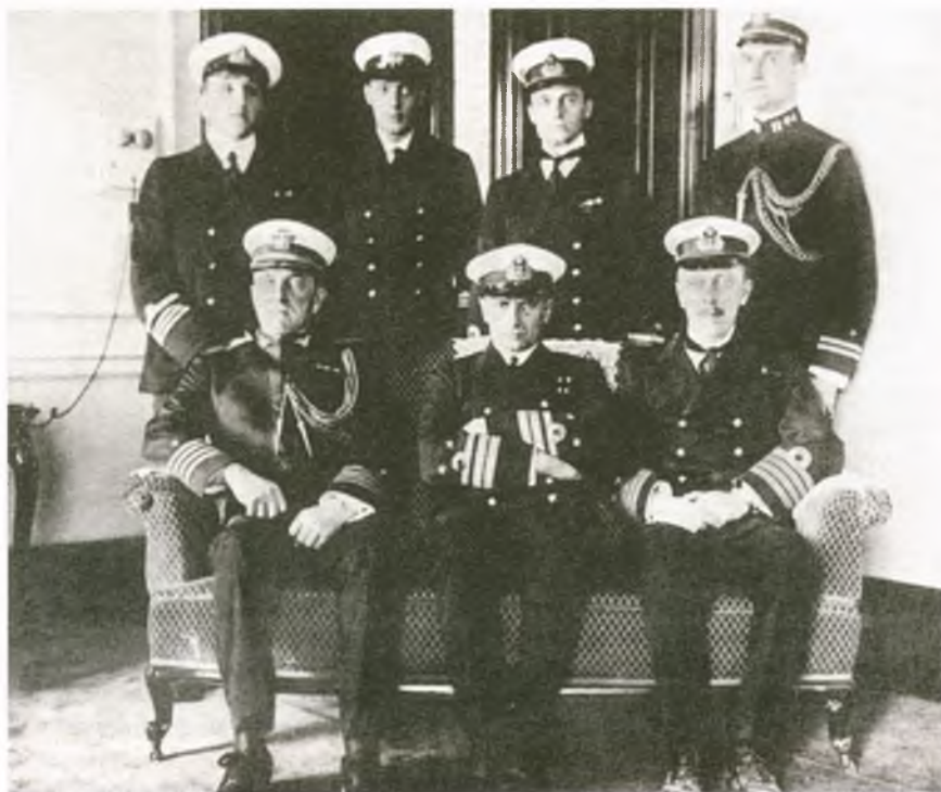
Группа русских морских офицеров во главе с адмиралом А.В. Колчаком в Нью-Йорке. Фотография. 1917.