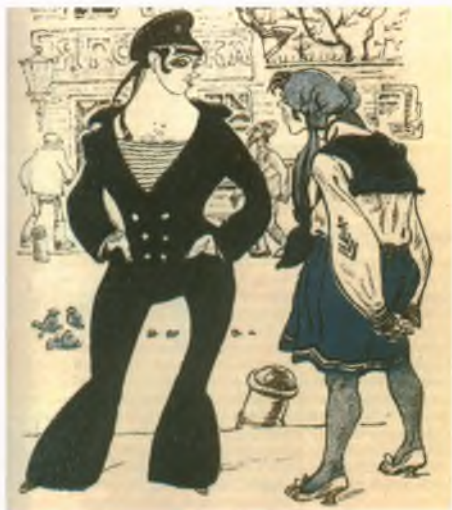
Рис. Ре-ми (Н.В.Ремизова). Новый сатирикон. № 37. 1917