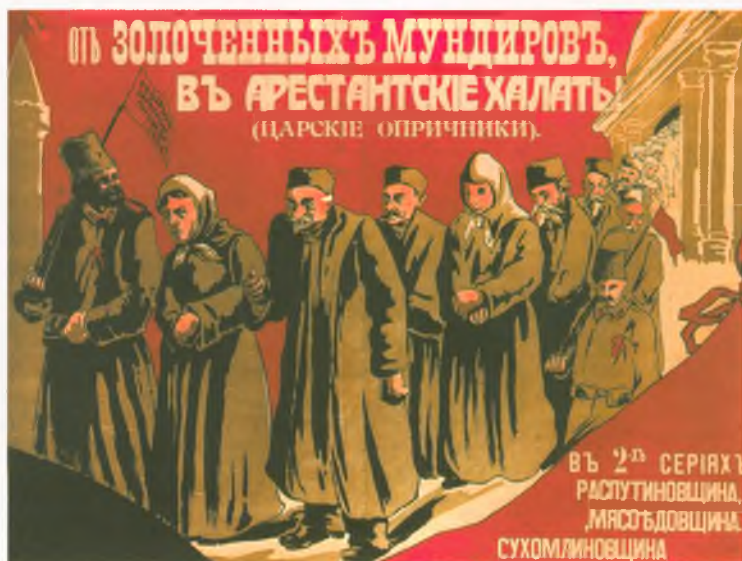
Афиша кинофильма. 1917

Открытка: «Отречемся от твердого знака, прочь, долой букву ять навсегда!» Гимназист с красным флагом, изменивший слова «Рабочей Марсельезы», символизирует борьбу со «старым правописанием». Реформа правописания проводилась Временным правительством и вызвала большую полемику в обществе. Впоследствии «старые» буквы превратились в политический символ