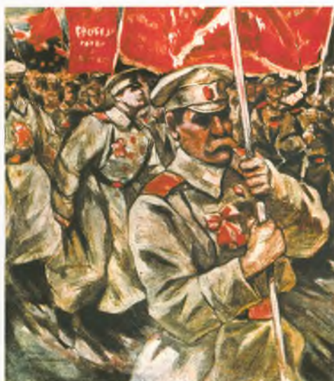
Обложка журнала. 1917. Солдаты революционизируют все элементы своей формы: кокарды и пряжки выкрашены в красный цвет или обернуты красной материей