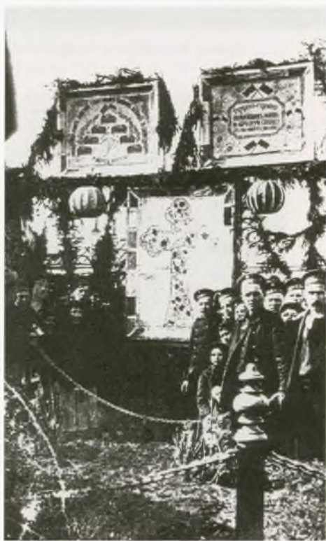
Могила матросов, погибших во время Февральской революции. Кронштадт. Революционные и религиозные символы соседствуют. Фотография. 1917