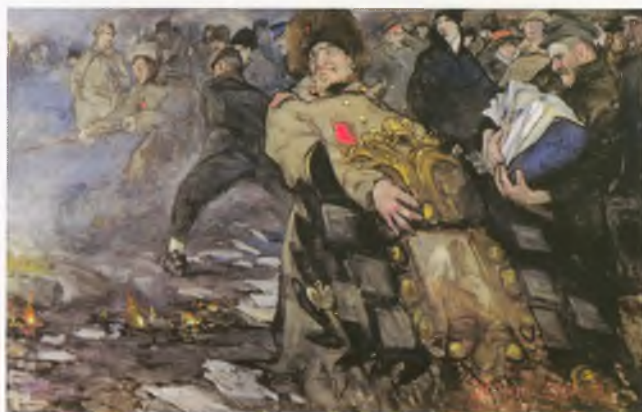
Фрагменты картины А.И. Вахрамеева. «Жгут орлов» (1917)