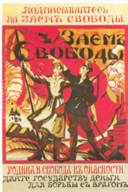
«Заем свободы». Открытка А.И. Кравченко. 1917