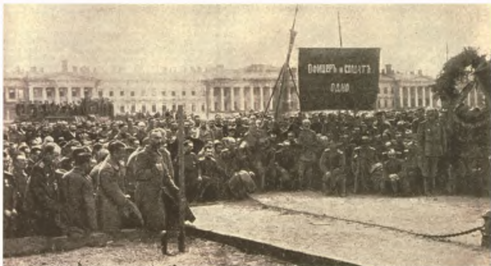
Манифестация делегатов Всероссийского съезда офицерских депутатов на Марсовом поле 14 мая 1917 г. Искры. 1917. № 20 (28 мая). С. 159. Фотография 1917