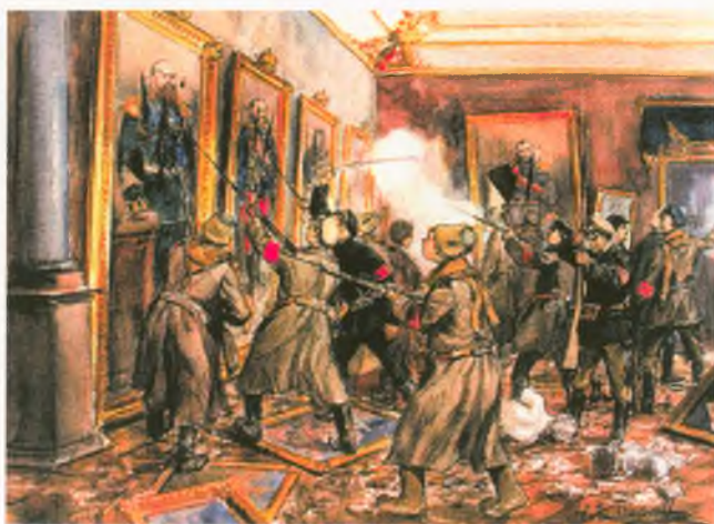
Картина И.В. Владимирова (1918?)