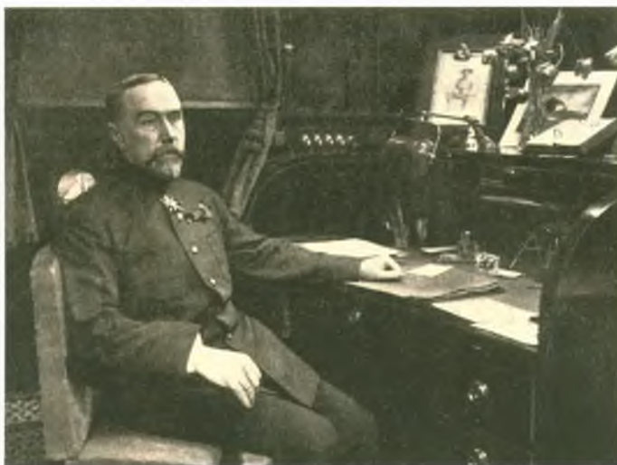
Командующий флотом Балтийского моря вице-адмирал А.С. Максимов. Адмирал не имеет знаков различия своего ранга, его китель украшен орденом и красным бантом. Фотография. Апрель 1917