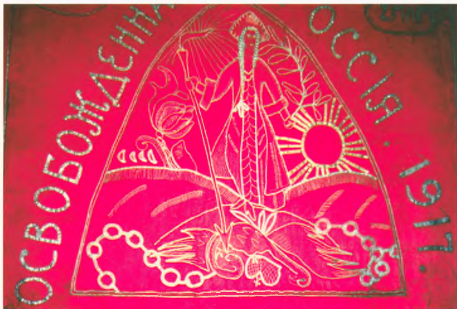
Новое знамя войсковой части. Женщина в национальном костюме, символизирующая «Освобожденную Россию», уничтожает двуглавого орла, который в данном случае олицетворяет «старый режим». 1917