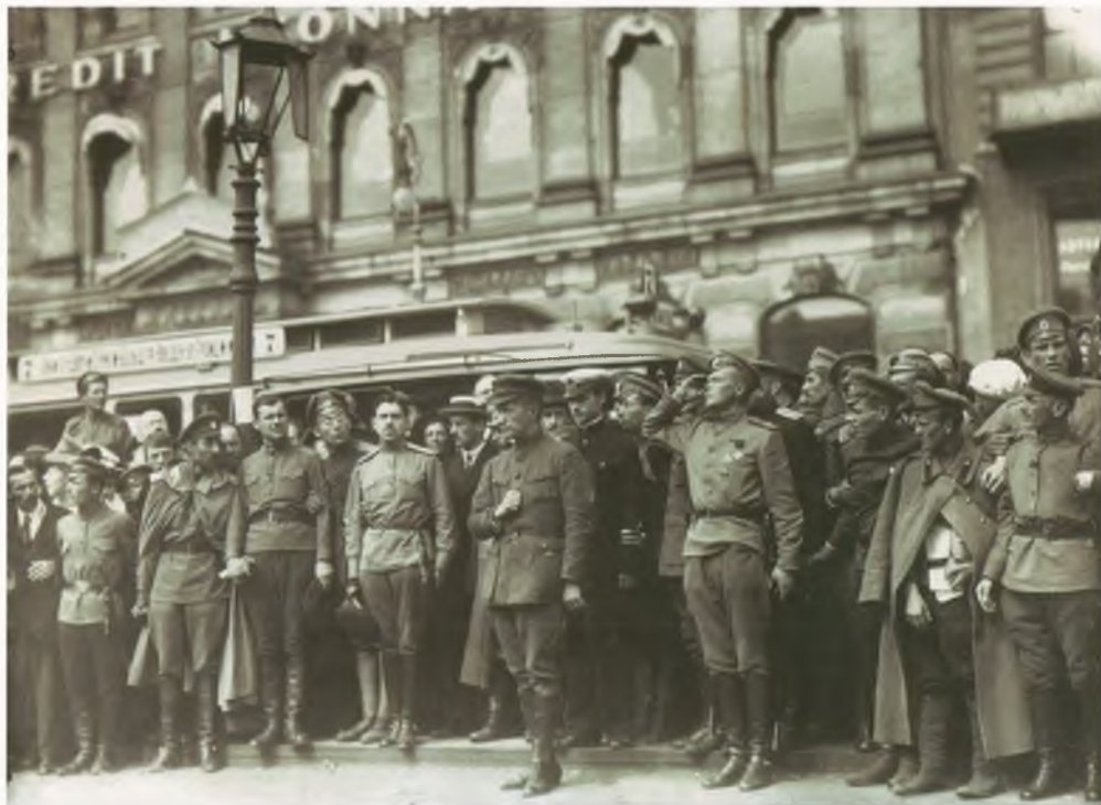
Торжественные похороны казаков, погибших в Июльские дни. Петроград, 15 июля 1917 г., фотография. За спиной А.Ф. Керенского стоит его морской адъютант, который не рискнул одеть летнюю форму даже во время такой церемонии. Военнослужащие, находящиеся в нескольких шагах от военного министра, не заботятся о соблюдении формы одежды