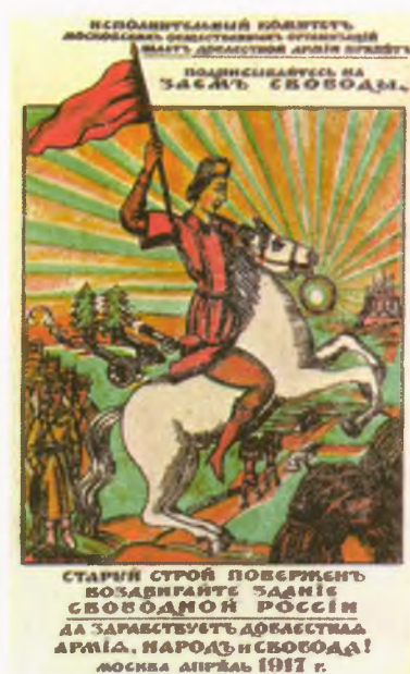
«Заем свободы». Открытка П. Кузнецова. 1917