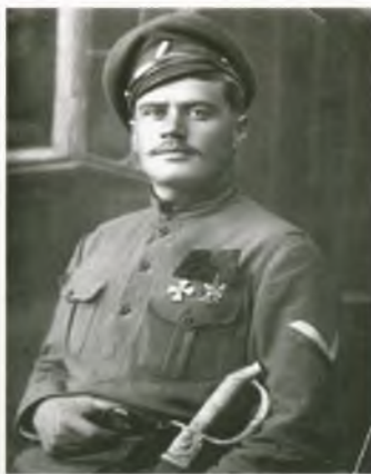
А.Н. Пепеляев. Полковник. В мае 1918 г. поднял антибольшевистское восстание в Томске. С августа 1918 г. командующий Средне-Сибирским корпусом. Фотография (1918)