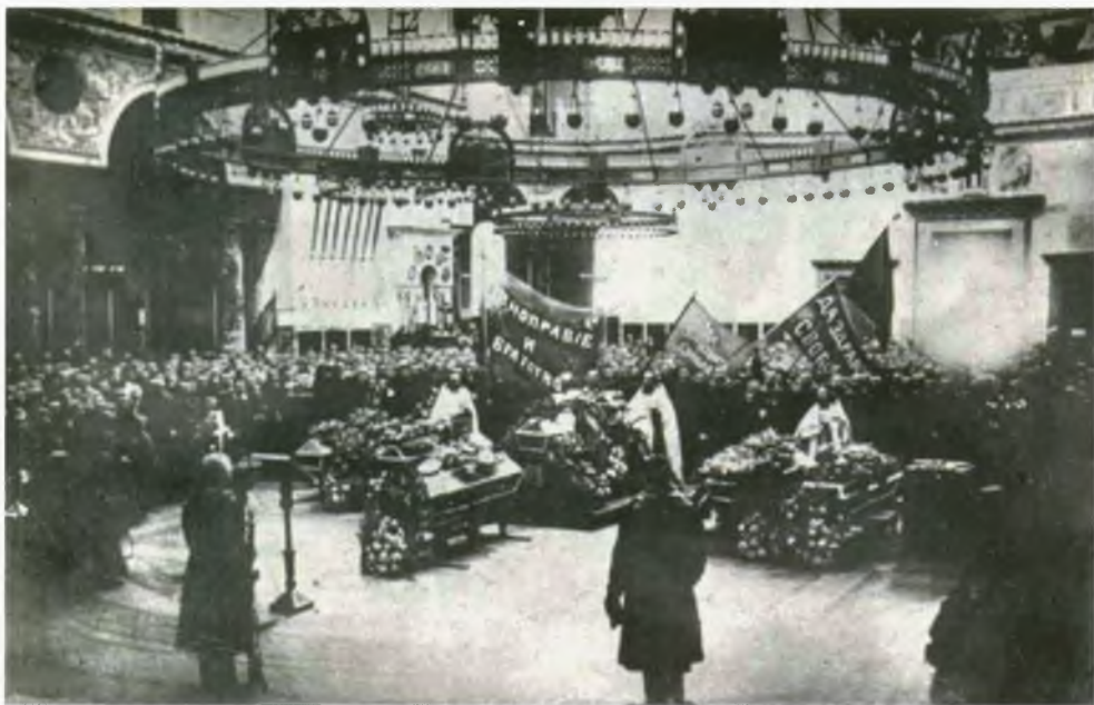
Отпевание матросов, погибших во время Февральской революции в Кронштадтском соборе. В собор внесены красные флаги. Фотография. 1917