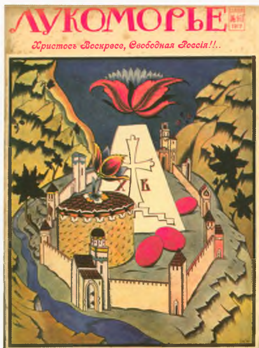
Обложка пасхального номера иллюстрированного журнала. 1917