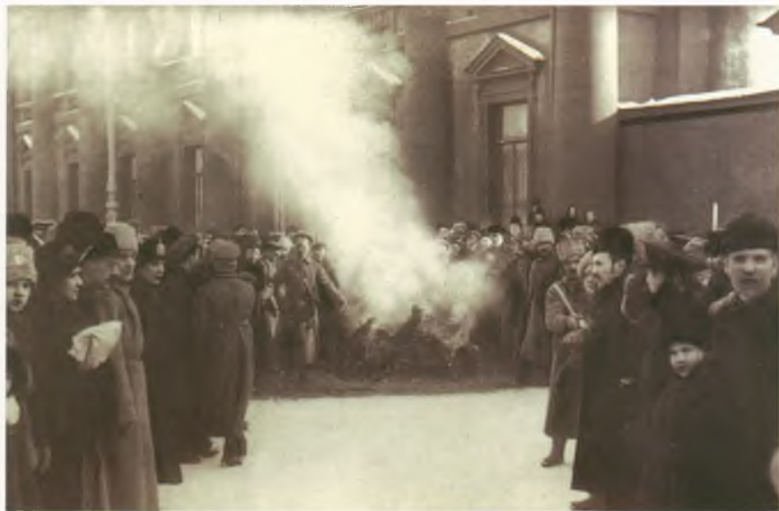
Февральская революция в Петрограде. Сожжение царских эмблем у Аничкова дворца. Фотография. 1917