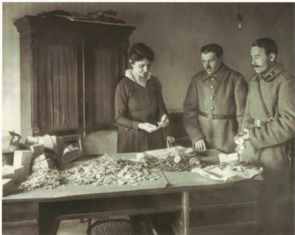
Прием медалей и орденов в Петроградском Совете. Фотография. 1917