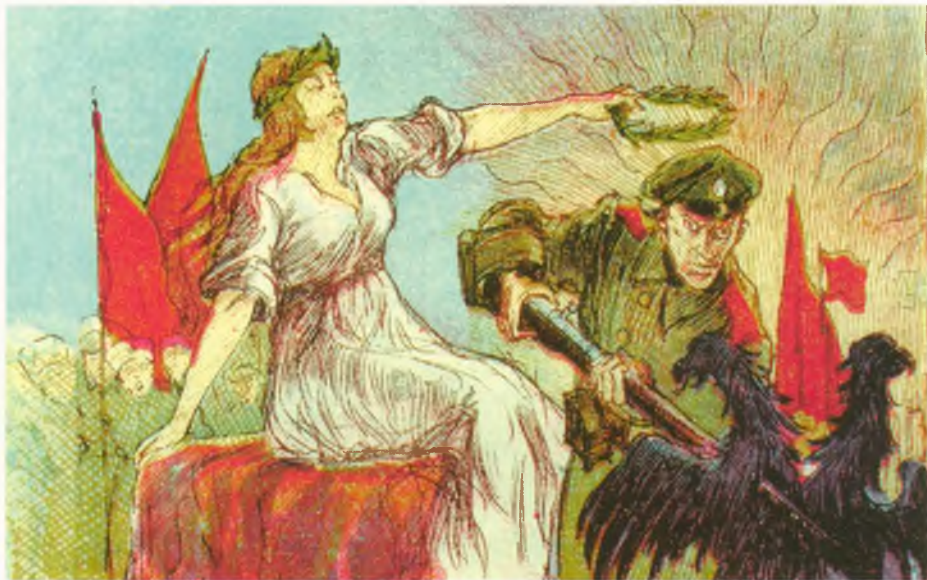
«Свобода» венчает лавровым венком русского солдата, уничтожающего двуглавого орла. Последнего не спасает даже отсутствие корон. Почтовая открытка. 1917