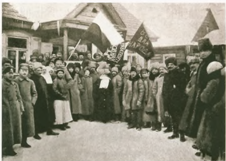
«Праздник свободы» в провинции. Служащие Всероссийского земского союза в местечке Волжин, Виленской губернии, приветствуют 5 марта зарю новой жизни. Искры. 1917. № 12 (26 марта). С. 91. Национальный флаг и красные флаги мирно соседствуют. Фотография. 1917