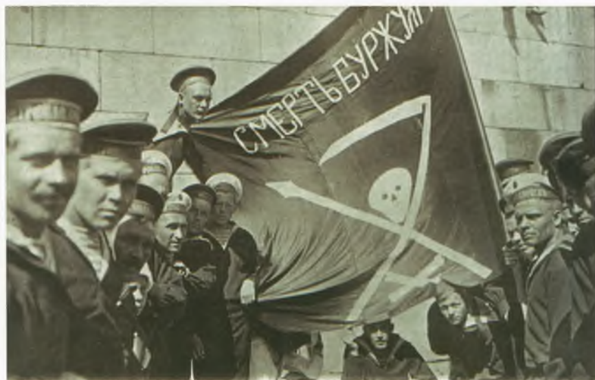
Матросы линейного корабля «Петропаловск» на демонстрации. Большинство моряков одеты опрятно, однако единообразие формы отсутствует. Многие сняли кокарды с бескозырок. Фотография. Гельсингфорс. Лето 1917