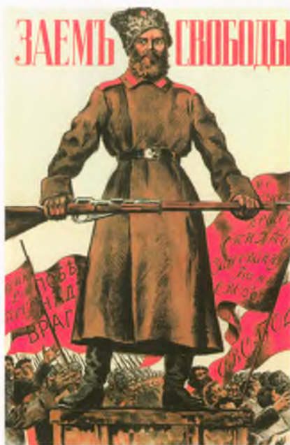
«Заем свободы». Плакат Б.М. Кустодиева. 1917