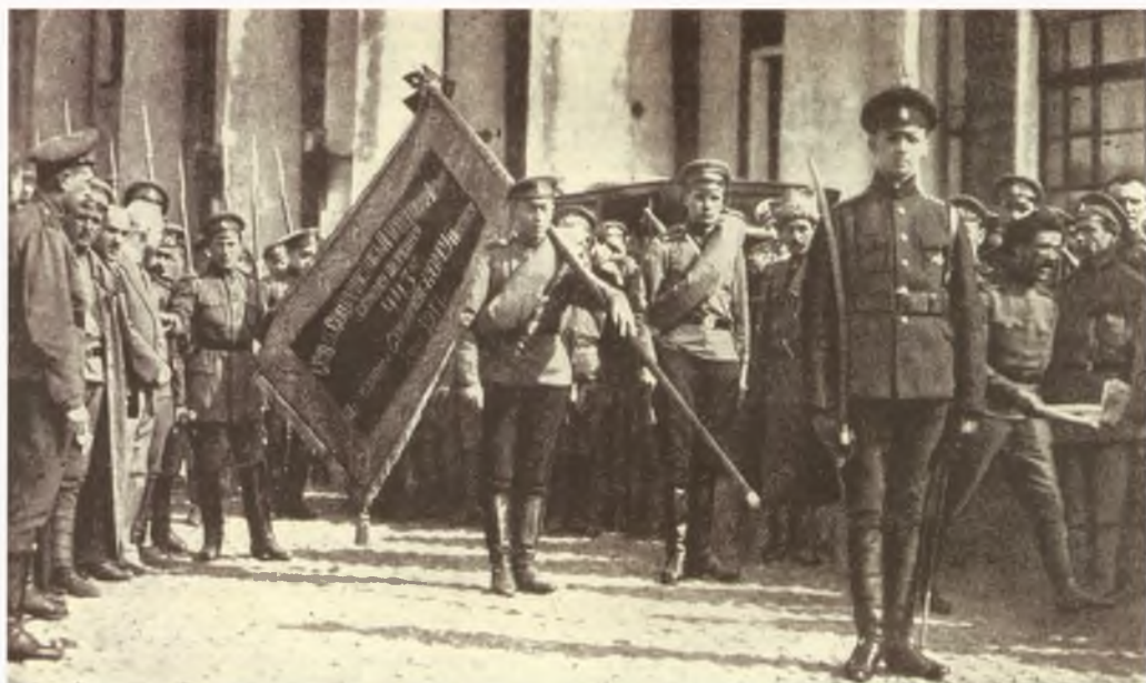
Знамя Союза социалистов народной армии вручается почетному караулу для передачи 443 Соснинскому полку, 20 мая 1917 г. Фотография. В церемонии участвовал главнокомандующий войсками Петроградского военного округа генерал П.А. Половцов, который выступил с торжественной речью