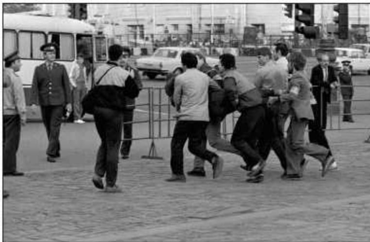
Арест пропагандиста, лето 1988 г.