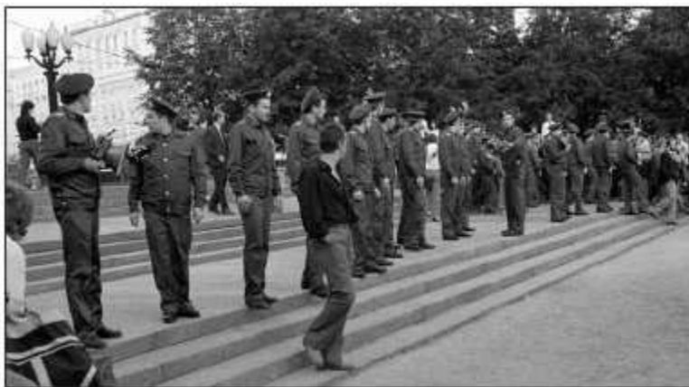
Ожидается митинг, лето 1988 г.