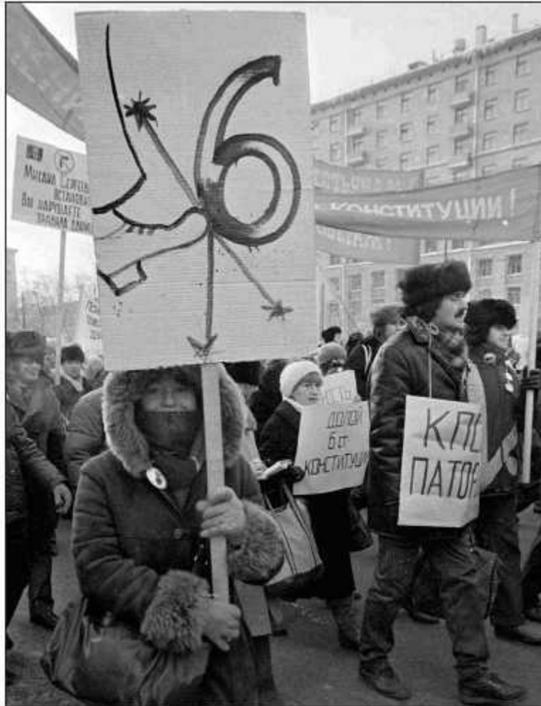
Демократы против 6-й статьи, 1989 г.