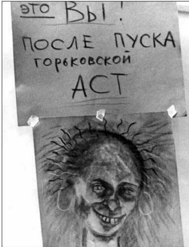
Плакат горьковских экологов