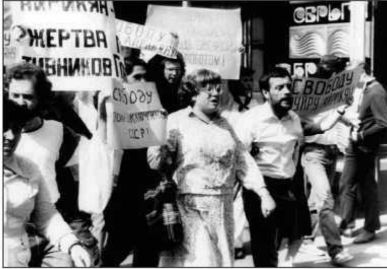
Дээсовцы идут, июнь 1988 г.