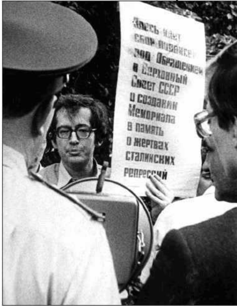
Пикет «Мемориала», 1988 г.