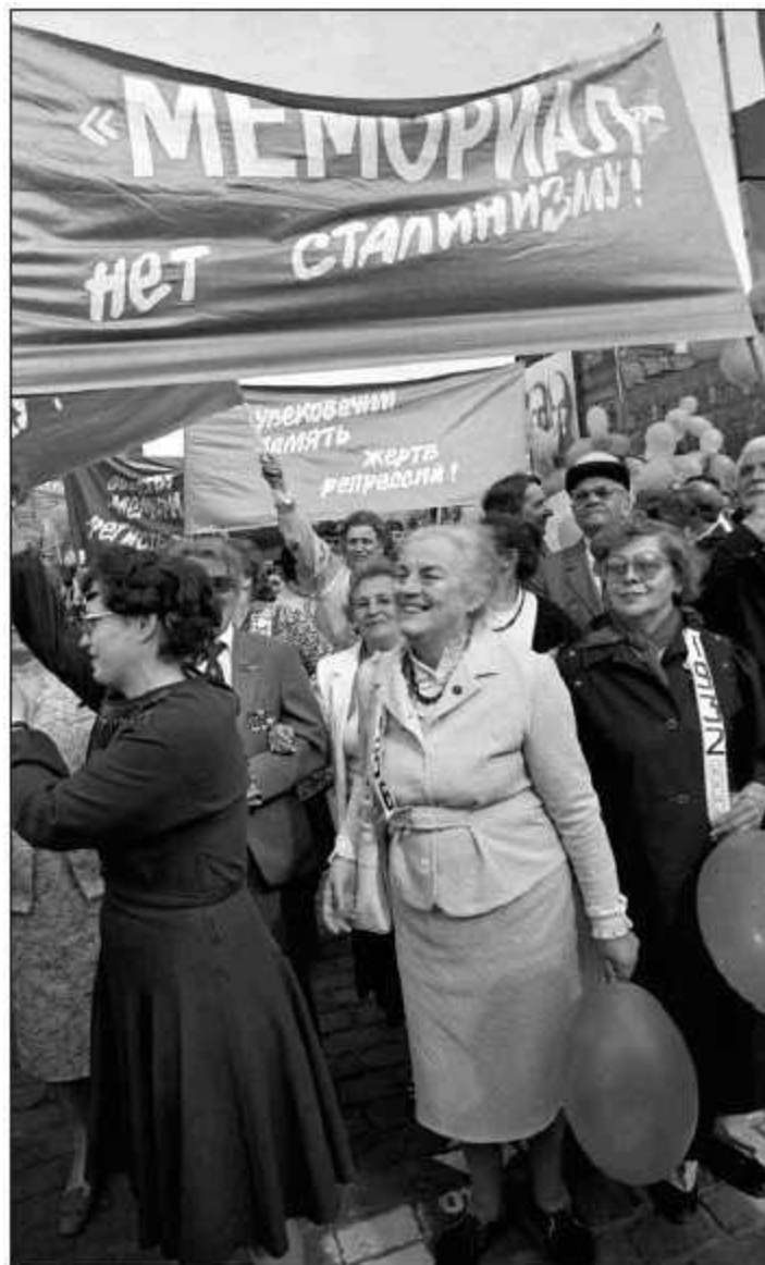
«Мемориал» на демократической демонстрации