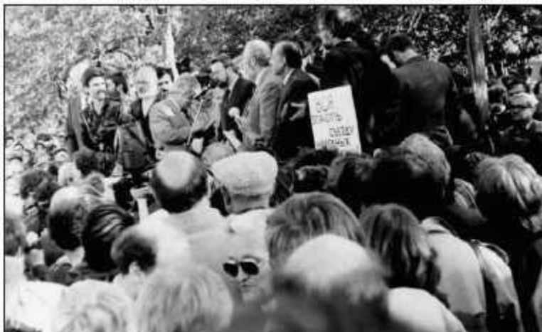
Давка на трибуне, 21 мая 1989 г.