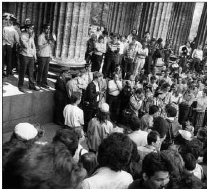
Ленинград, 28 мая 1988 г.