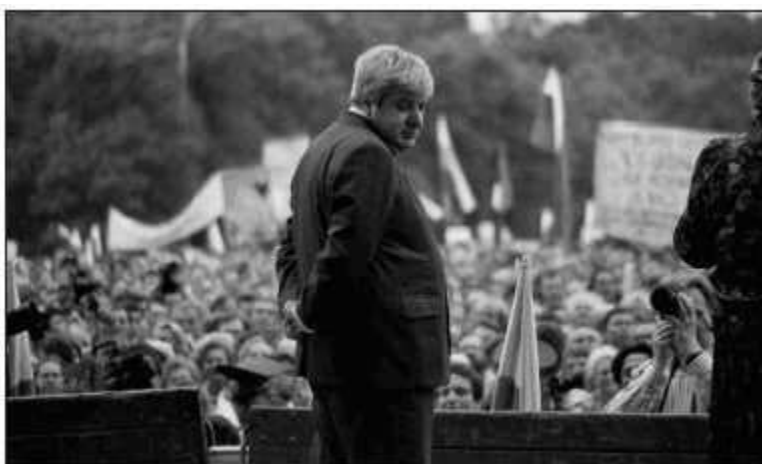
Гавриил Попов готовится вести митинг, май 1989 г.