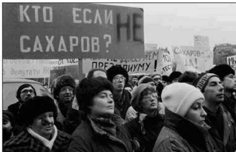
Предвыборная кампания 1989 г.