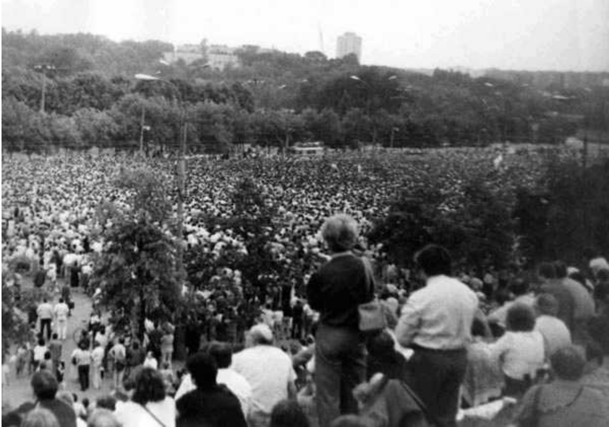
Лужники, 21 мая 1989 г.