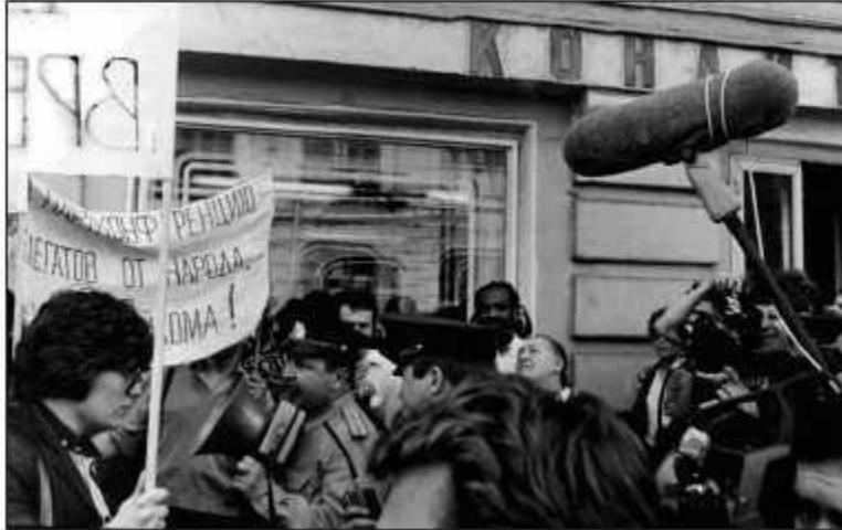
Критический момент демонстрации 28 мая 1988 г.