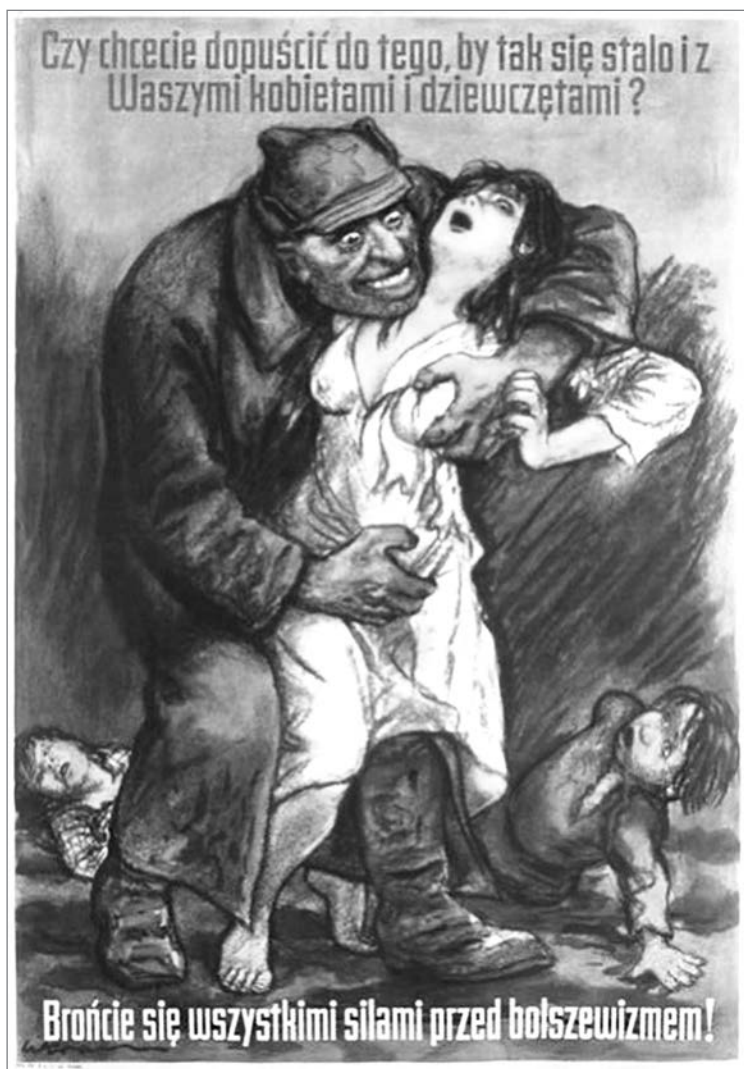
Польский плакат 1920 года