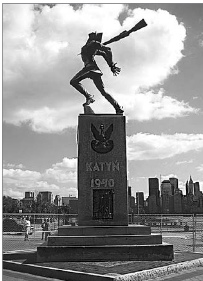
Памятник жертвам Катыни в Джерси-Сити, США

на которую были обречены поляками в 1920 году десятки тысяч наших соотечественников.