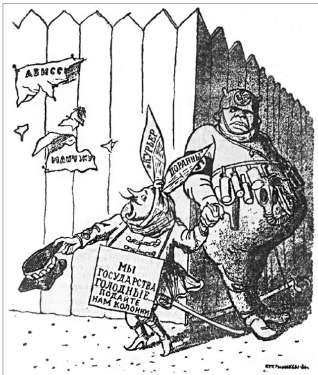
Карикатура из газеты «Правда», высмеивающая польские колониальные амбиции

рективы о единой подготовке вооружённых сил к войне на 1939–1940 гг.». Одновременно главнокомандующие видами вооружённых сил получили предварительный вариант плана войны с Польшей, которому было присвоено условное название «Вайс» 39 . 11 апреля «Директива», составной частью которой являлся план «Вайс», была утверждена фюрером 40 . 28 апреля, выступая в рейхстаге,