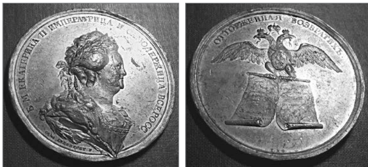
«Отторженная возвратих». Медаль в честь разделов Польши

Верельским мирным договором 3 (14) марта 1790 года закончилась русско-шведская война 19 . И тут выяснилось, что поляки жестоко просчитались. Разобравшись с внешними врагами, Россия весной 1792 года направила в Польшу свои войска, и уже к лету русская армия контролировала всю территорию Речи Посполитой. Что же касается Пруссии, то вместо «взаимопомощи» она предложила новый раздел Польши, договор о котором был подписан с Россией 23 января 1793 года. На этот раз Россия получила Белоруссию (Минск, Слуцк, Пинск) и Правобережную Украину (250 тыс. кв. км), а к Пруссии отошли Гданьск, Торунь, Познань и значительная часть Великой Польши (58 тыс. кв. км) 20 .