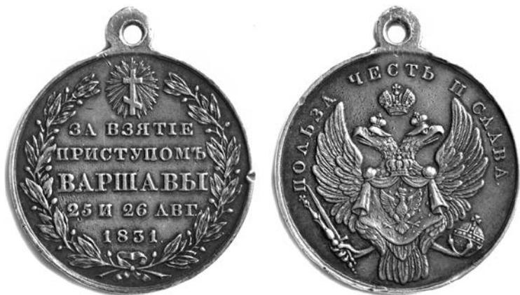
Медаль в честь взятия Варшавы

во главе с Адамом Чарторыйским, которое потребовало от России отдать территории Белоруссии, Украины и Литвы. Началось формирование повстанческой армии, достигшей 80 тыс. человек при 158 орудиях.