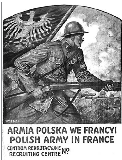
Польская армия во Франции. Агитационный плакат

воспользоваться плодами победы. Однако как мы видим, даже в то время, когда русские солдаты продолжали сражаться и гибнуть за интересы Антанты, «союзники» уже вовсю готовили расчленение России.