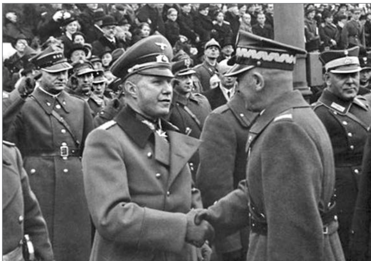
Парад 11 ноября 1938 года в Варшаве. На переднем плане маршал Эдвард Рыдз-Смиглы (справа) и немецкий военный атташе полковник Богислав фон Штудниц

«Польша и Венгрия, как стервятники, отрывали куски умирающего разделённого государства» 26 .