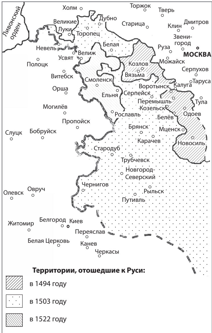
Изменение русско-литовской границы