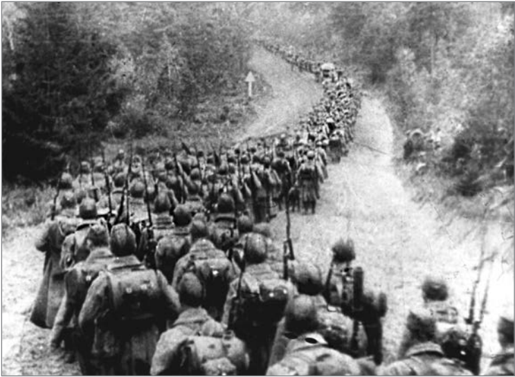
Советские войска пересекают границу