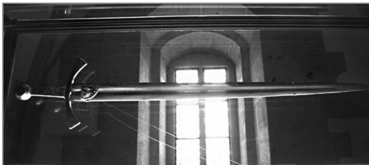
Меч польских королей «Щербец»

В благодарность за оказанную помощь Святополк отдал тестю «червенские грады» — Перемышль, Червен и другие города по левому берегу Западного Буга, присоединённые к Руси в 981 году. Кроме того, Болеслав вывез киевскую казну и угнал многочисленный полон (около тысячи человек), включая сестру Ярослава Предславу, которую сделал своей наложницей 6 .