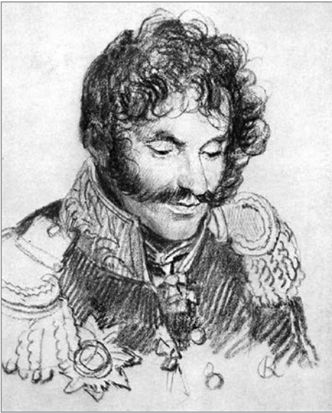
О. А. Кипренский. Портрет генерала Е. И. Чаплица. 1813

России и принял бой с русским авангардом 29 января (10 февраля) 1813 года под Рогачёвом 13 .