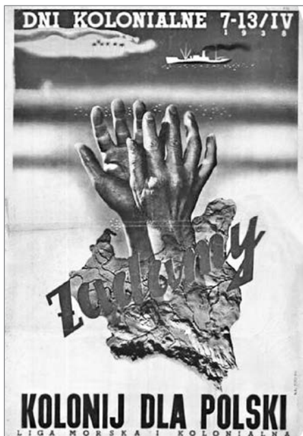
Плакат польской «Морской и коло- ниальной лиги»

коридора» 37 , казалось, ничто не предвещает осложнений. Однако ответом неожиданно стал решительный отказ. Как и на последующие аналогичные германские предложения. Дело в том, что Польша неадекватно оценивала свои силы и возможности. Стремясь получить статус великой державы, она никоим образом не желала становиться младшим партнёром Германии. 26 марта 1939 года Польша окончательно отказалась удовлетворить германские претензии 38 .