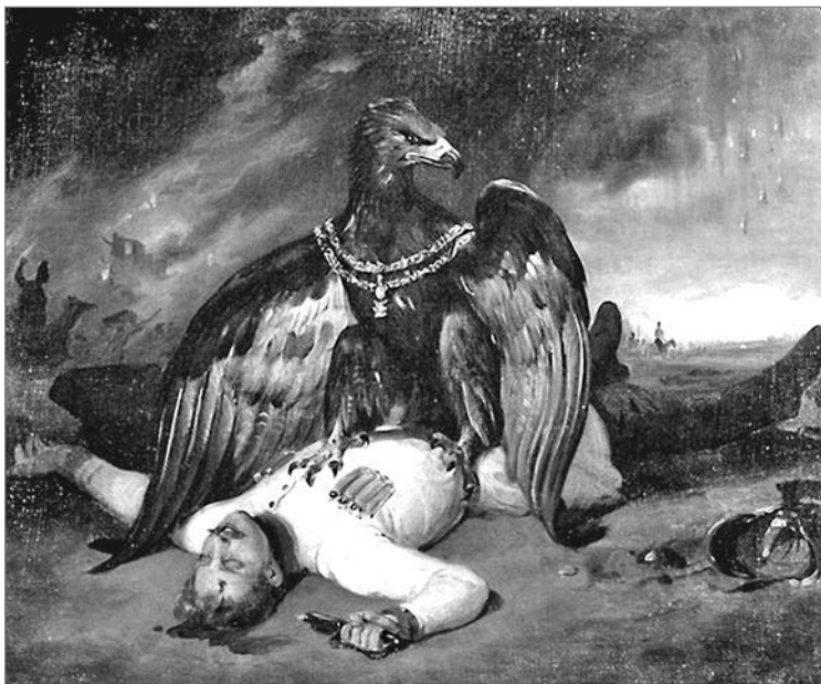
Польский Прометей. Художник Орас Верне, 1831 год

Вскоре началась эпидемия холеры, жертвами которой стали как великий князь Константин, так и русский главнокомандующий. Ликвидацию мятежа пришлось довершать назначенному на место Дибича генерал-фельдмаршалу И. Ф. Паскевичу. 26 августа (7 сентября), в годовщину Бородинского сражения, Варшава была взята штурмом, особенное ожесточение которому придала учинённая поляками 15 (27) августа зверская расправа над русскими пленными. С известием о победе Паскевич отправил в Петербург внука Суворова, как бы напоминающая о том, что он повторил достижение великого полководца — взятие Варшавы в 1794 году 18 . Вскоре были