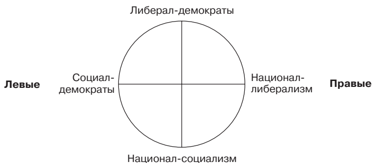
Рис. 8. Типы партий и их идеологические основы

Многие партии берут не одну, а две идеологические основы, и отсюда двойное название (рис. 8)