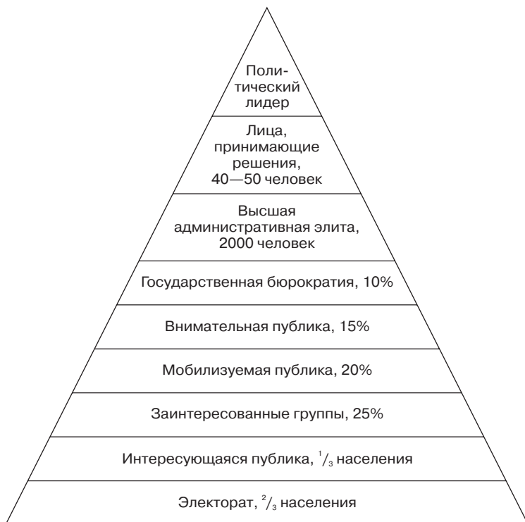
Рис. 4. Конус политической стратификации

сти, что добьется власти; 4) обладает минимумом качеств, необходимых профессиональному политику.