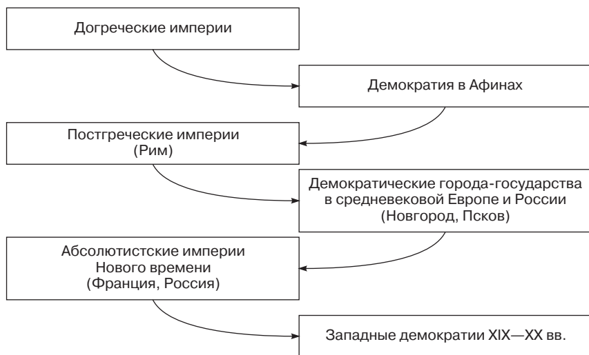
Рис. 2. Маятник власти в политической истории мира

ниципальные свободы сохранялись во Франции вплоть до конца XVII в. «Встречаются города, представляющие маленькие демократические республики, где должностные лица свободно избираются всем народом... где деятельна муниципальная и общественная жизнь, где община еще гордится своими правами» (Токвиль А. Старый порядок и революция. М., 1911. С. 52).