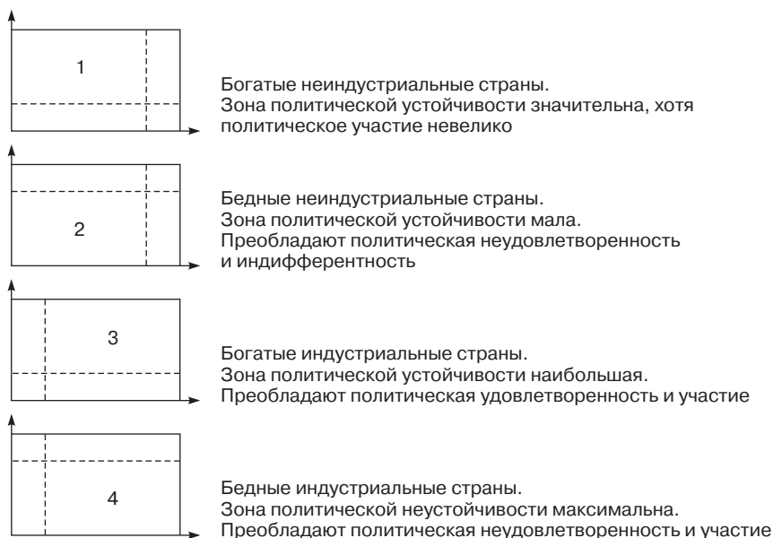
Рис. 6. Группы стран с разными уровнями удовлетворенности политической системой

Арабские Эмираты, Кувейт; 2) страны с низким душевым доходом и уровнем социокультурного развития — большинство развивающихся и отсталых стран; 3) индустриальные страны с высоким душевым доходом и уровнем социокультурного развития (много людей с высшим образованием, живущих в городах и занимающихся умственным трудом) — большинство развитых стран; 4) индустриальные страны с низким душевым доходом и высоким уровнем социокультурного развития — Россия (рис. 6).