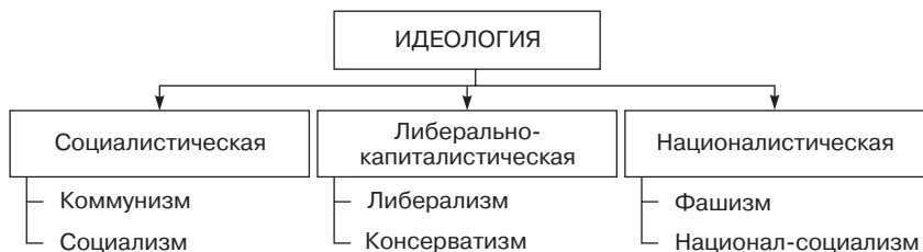
Рис. 7. Разновидности идеологий

Основные течения в рамках националистической идеологии — фашизм (в традиционной трактовке Муссолини) и национал-социализм (господствовавший в Германии с 1933 по 1945 г.). Второму присуща наибольшая степень агрессивности и милитаризма (рис. 7).