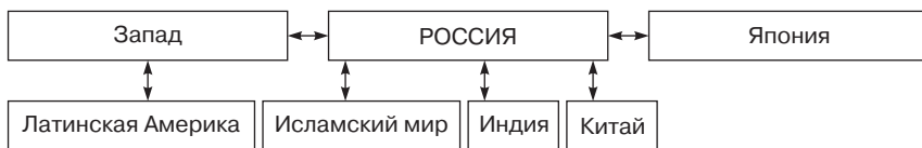
Рис. 3. Точки мирового влияния на Россию

После распада СССР мир внезапно стал однополюсным с растущими точками влияния: Китай, Япония, Индия, Латинская Америка, исламский мир (рис. 3).