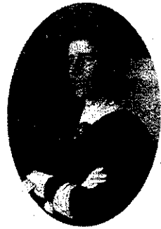
Шарлотта Перкинс Гилман