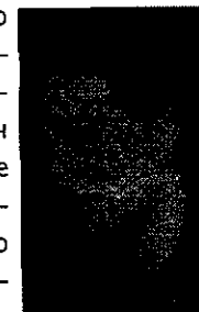
Симона де Бовуар

В середине XX в. во Франции по многим причинам было особенно маловероятно возникновение феминистской теории. Женщины здесь не торопились завоевывать юридические и политические права, как в Америке и большинстве стран Европы. В политической культуре доминировали сильные патриархатные установки и представители всего политического спектра от католиков и антиреспубликанцев справа до социалистов слева соглашались с тем, что место женщины — дом. Не было там и сильной традиции «ведущего направления феминизма», который к 1945 г. представлял собой «монополию горстки женщин из высшего класса» (McMillan, 1981,