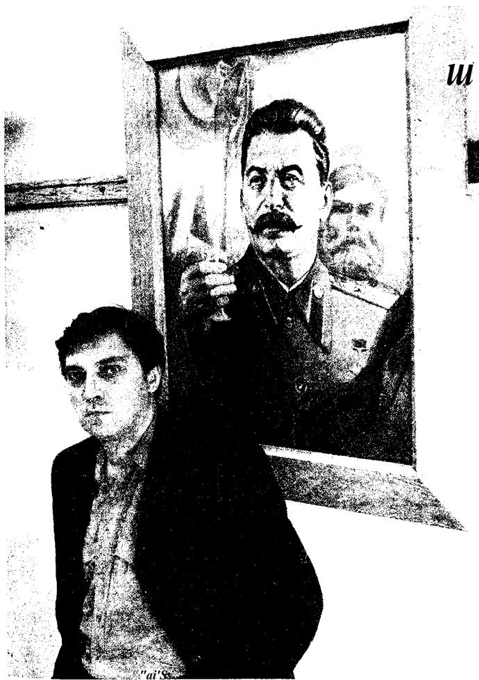
В кабинете депутата А. Невзорова. Государственная Дума 1994 год