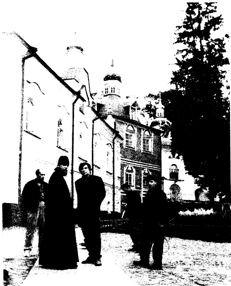
Псково-Печерский Свято-Успенский монастырь. Июль 1995 года. Съёмки программы «С нами Бог».