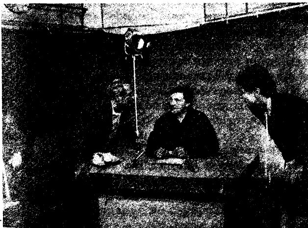
Студия Ленинградского ТВ, прямой эфир А.Невзорова. 1993 год.

сотрудников РОВД желательно в первом или втором рядах». И подпись: «Замполит». Бумажечка тут же перефотографируется. Буквально через день — я у начальника управления внутренних дел этого РОВД. Знаю, что он зажимает от меня информацию. Я пришел к нему не как какой-нибудь садист, размахивая документом: вот у меня компромат. Нет! Я пришел к нему, как к умному, хорошему человеку посоветоваться, как подавать информацию в эфир: с музыкой или в полной тишине. Он начинает меняться в лице, негнущимися пальцами тычет в кнопки селектора, и из-под паркета вырастают оперуполномоченные, постовые и прочие. Он им отдает строжайший приказ давать больше информации Александру Глебовичу, а то Александр Глебович обижается на милицию. Я отдал ему фотокопию: Другую положил себе под стекло, на случай осложнения наших отношений.