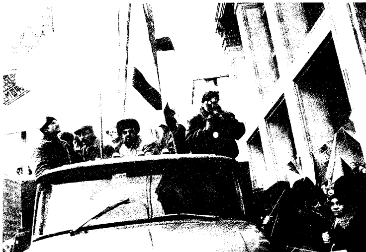
г. Москва, 23 февраля 1992 года. Съемки «Народного Вече».