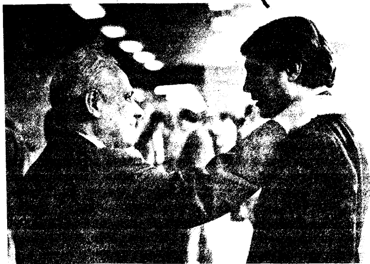
Анатолий Лукьянов и Александр Невзоров. Государственная Дума. Январь 1995 года

практически ко всей этой Государственной Думе... Вы же для них все равно... ведь они улыбаются, мило говорят... Приходит с моржовыми усами Лысенко и что-то объясняет про часы в эфире... Но мы же прекрасно знаем, как много они могут сделать в деле «разжигания национального согласия», что мы для них все равно «красно-коричневые псы», что мы для них все равно нечто, безумно мешающее этой стране на ее пути к «светлому будущему», что мы все равно фашисты и нелюди. И они это знают твердо, и в решительные минуты у них всегда это проскальзывало - и 19 августа, и в марте 1993 года, и в октябре 1993 года. Поэтому они будут лгать, поверьте мне. Исходя из этого считаю необходимым поддержать