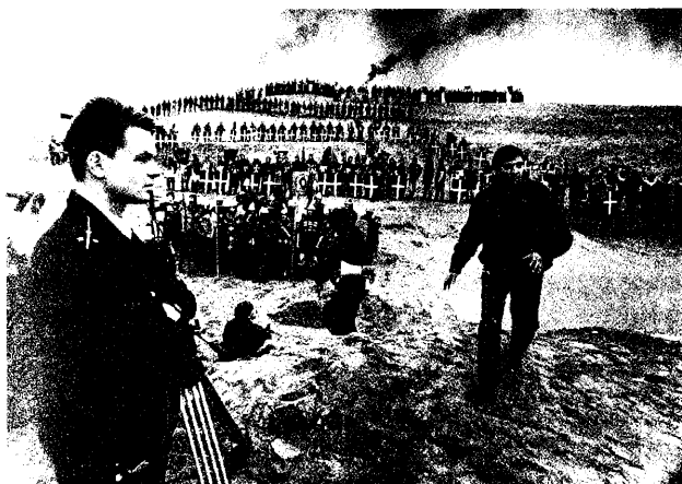
Август - сентябрь 1994 года. Съемки на дамбе.