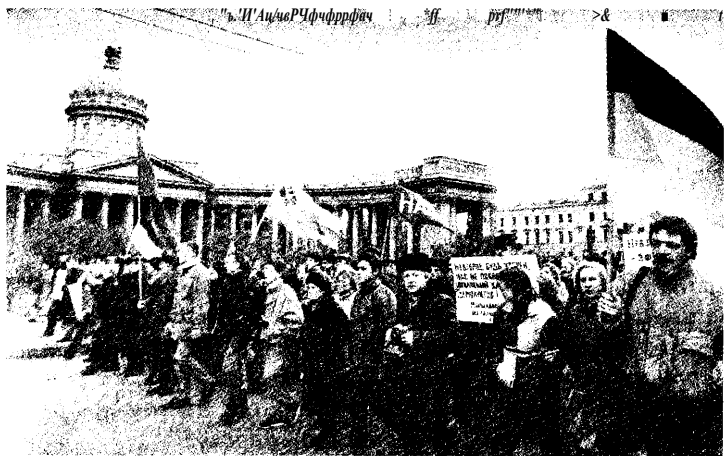
Демонстрация в защиту «600 секунд».

А Тбилиси, помните? Человек 800 штурмовало резиденцию Звиада, человек двести ее обороняло. Для гражданской войны (по крайней мере, для первой вспышки) больше-то и не надо. На проспекте Руставели шел бой, а на соседних улицах беззаботные тбилисцы спокойно жрали мороженое.