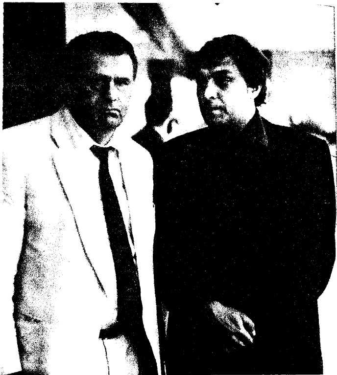
Государственная Дума. Январь 1995 года, г. Москва.

чудовищное побоище, в котором был утоплен и перерезан цвет европейского дворянства. Разве это не экстремизм?