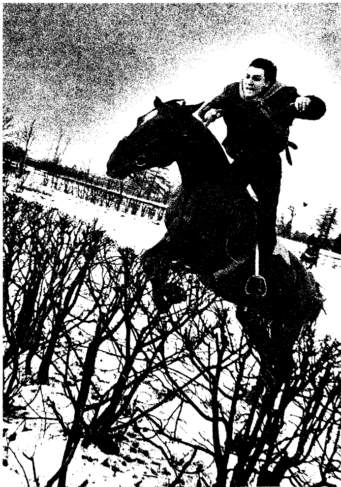
г. Стрельна. 1991 год.