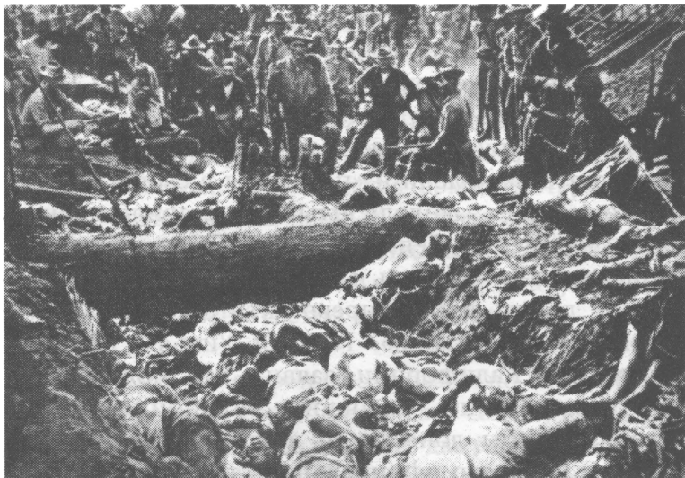
Бойня в Моро 9 марта 1906 г.