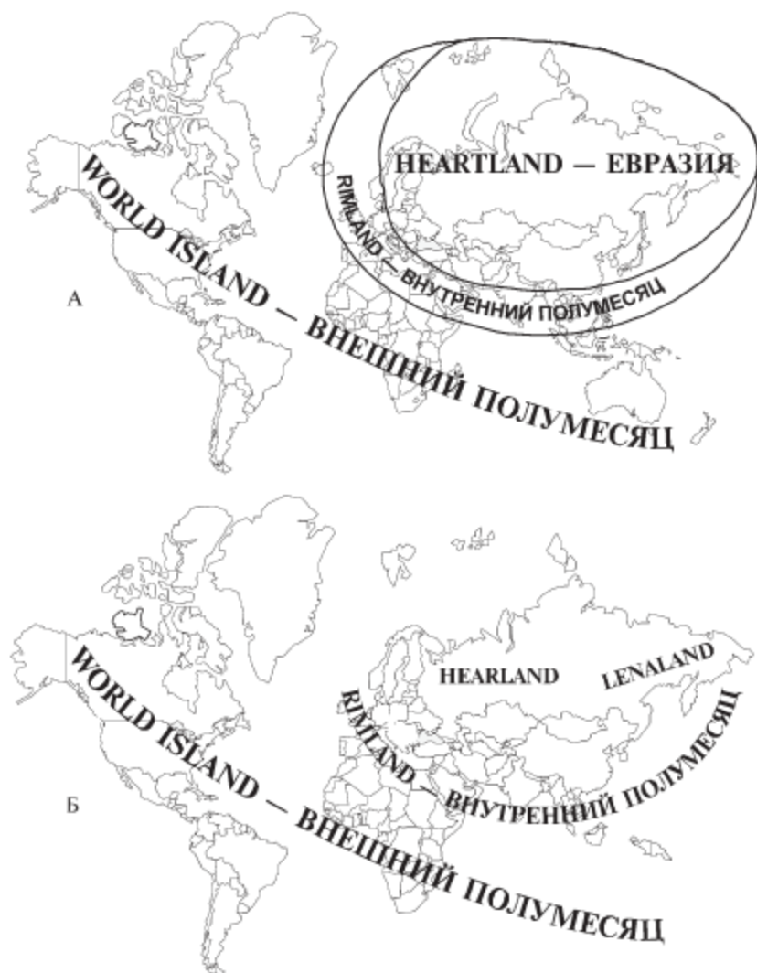
Рис. 2.1. Две версии геополитического деления Хартленда: а — базовая, впервые использованная Маккиндером в 1905 г. («Географическая ось истории»); б — пересмотренная, предложенная Маккиндером в 1943 г.

Евразия. «Внутренний полумесяц», по мнению ученого, — зона наиболее интенсивного развития цивилизации (рис. 2.1).