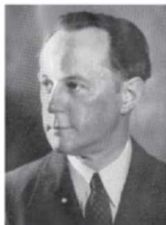
Николас Дж. Спайкмен

Николас Дж. Спайкмен (1893—1943) — американский ученый голландского происхождения, профессор международных отношений, директор Института международных отношений при Йельском университете, продолжатель теории адмирала Т. Мэхэна. Он утверждал, что термин «геополитика» — подходящее название для анализа и упорядочивания дан-