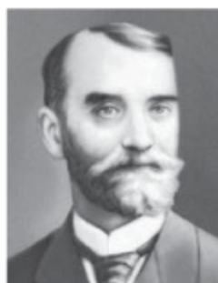
В. де ла Блаш

Основатель французской геополитической школы Видаля де ла Блаш (1845—1918) — географ. В свое время он увлекся политической географией Ф. Ратцеля и на ее основе создал свою геополитическую концепцию, в которой тем не менее подверг глубокой критике многие ключевые положения немецких геополитиков. В книге «Картина географии Франции», вышедшей в 1903 г., он, в частности, пишет: