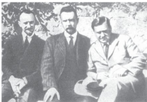
П.Н. Савицкий, Н.С. Трубецкой, П.П. Сувчинский

Истоки евразийского движения, как полагают многие его исследователи, связаны с именами князя Николая Сергеевича