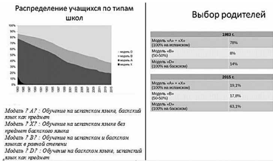
Рисунки: Данные представлены доктором Эктором Ало-и-Фонтом, Centre de Recerca en Sociolingüística i Comunicació, Universitat de Barcelona, исследование в рамках регионального досье «Меркатор»

Как удалось вернуть утраченные позиции? Прежде всего, за счет создания сильной общеобразовательной школы с региональным языком обучения. Регионы, которые вообще не имели учительских кадров, умеющие преподавать на региональном языке, смогли практически с нуля создать такую систему образования. Если в Уэльсе в 1970-е гг. лишь 15% молодежи региона знали валлийский язык, то к началу прошлого десятилетия их число достигло почти 40. Число школ с валлийским языком обучения и их популярность среди родителей растет. Почему? В конечном счете оказалось, что ученики таких школ лучше сдают математику – настоящая билингвальность заставляет интенсивнее работать мозг. Так, например, в Каталонии каталаноязычное образование стало более популярнее, чем школа с испанским языком обучения. Вслед за школой сформировалось и высшее образование на региональных языках.