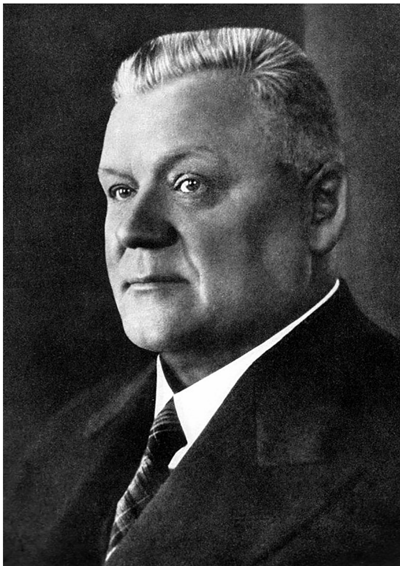
КАРЛИС УЛМАНИС, официальный фотопортрет