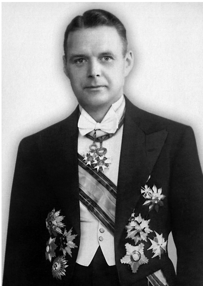
Вильгельм Мунтерс, парадный фотопортрет