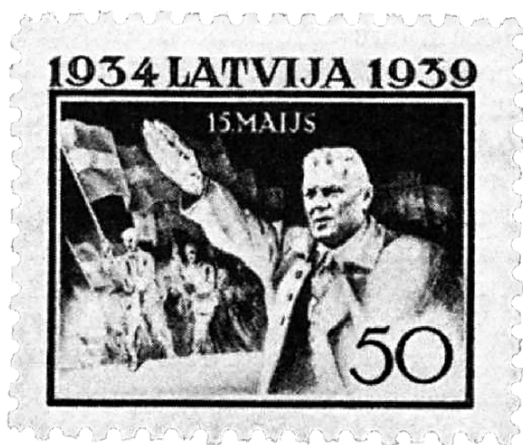
Почтовая марка из серии к 5-летию режима Карлиса Улманиса