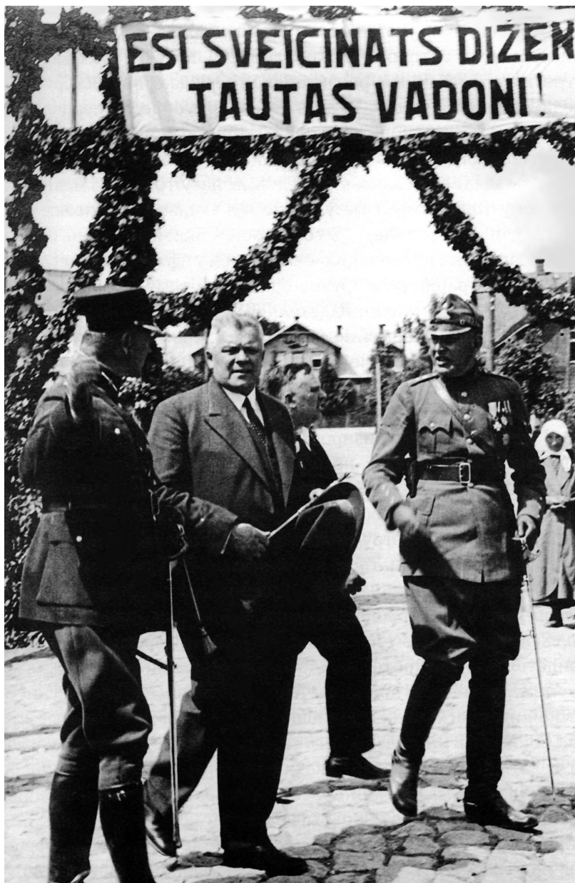
Прославление «великого вождя народа» Карлиса Улманиса во время посещения городка Мадоны, июнь 1934 г.