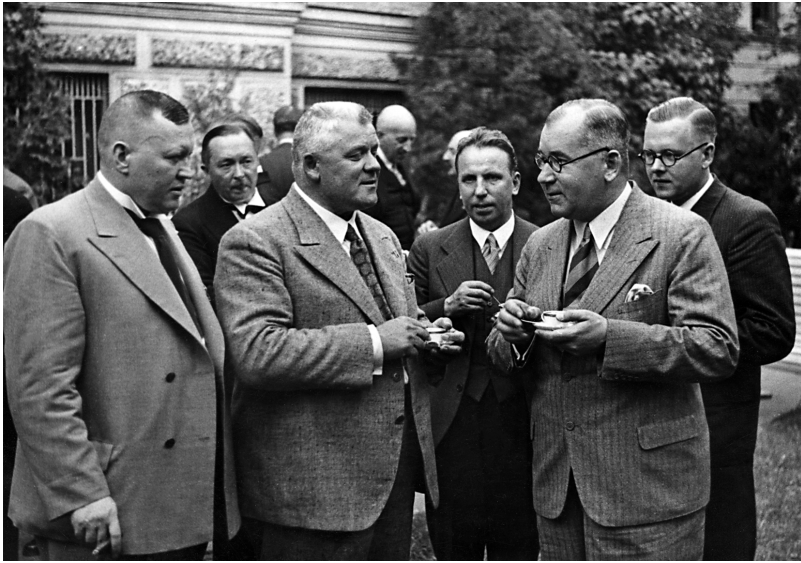
КАРЛИС УЛМАНИС в окружении латвийских дипломатов, 1937 г.