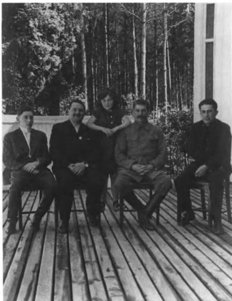
Сталин с детьми: Василием (слева), Светланой (стоит) и Яковом (справа), рядом с Василием — Жданов, 1 июля 1938 года.