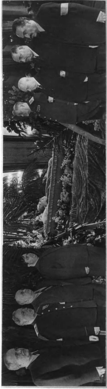
Гроб Сталина, март 1953 года. Молотов, Ворошилов, Берия и Маленков (слева); Булганин, Хрущев, Каганович и Микоян (справа).