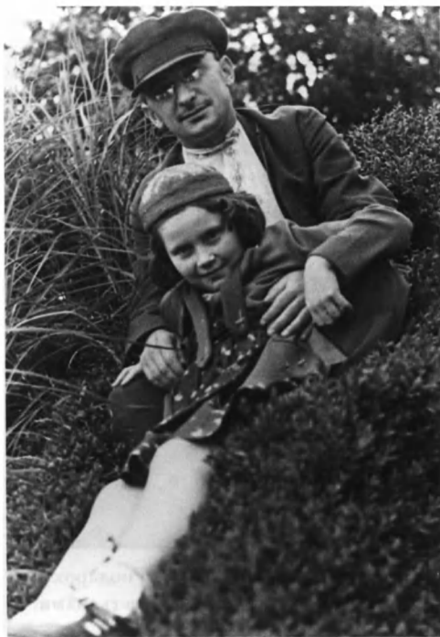
Берия со Светланой Сталиной, середина 1930-х годов.