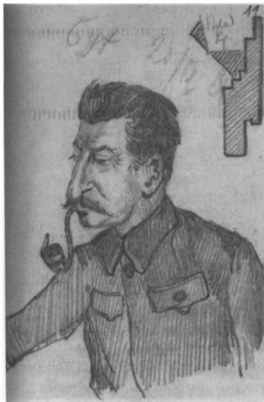
Набросок портрета Сталина, сделанный Бухариным, 20 февраля 1928 года.