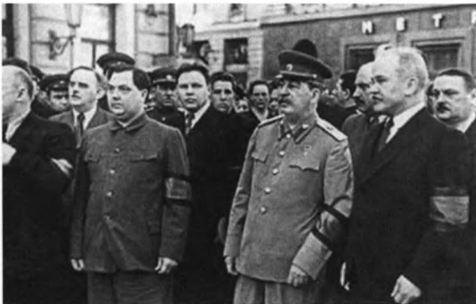
Команда на похоронах Калинина, 1946 год: Берия, Маленков, Сталин и Молотов (впереди), Вознесенский (в следующем ряду, между Маленковым и Сталиным), Кузнецов (виден за плечом Вознесенского), Каганович (позади, между Сталиным и Молотовым) и Жданов (сзади, крайний справа).