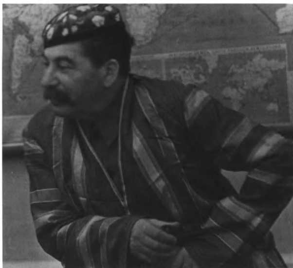
Сталин в восточном одеянии (вероятно, это подарок от делегатов из Средней Азии) на встрече с крестьянами, 1935 год.