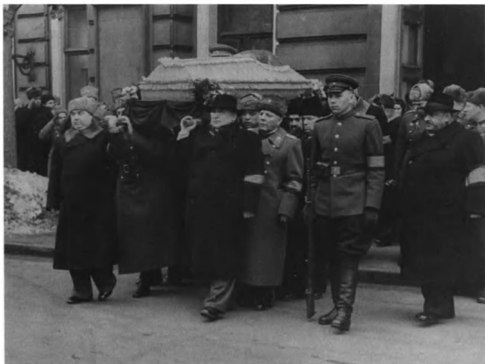
Вынос гроба на похоронах Сталина, март 1953 года. Маленков слева, Берия справа, чуть позади него Ворошилов. Сзади справа — Микоян и Хрущев.