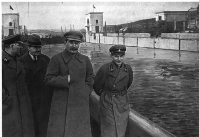
Ворошилов, Молотов, Сталин и Ежов на канале Москва — Волга, 1937 год.