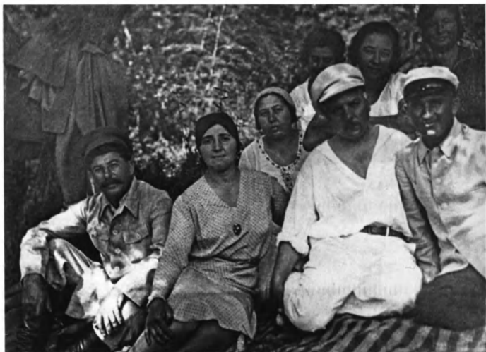
Сталин, его жена Надежда, Ворошилов с женой и Енукидзе в Сочи, 1932 год.