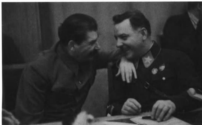
Сталин и Ворошилов на приеме в Кремле, 1936 год.