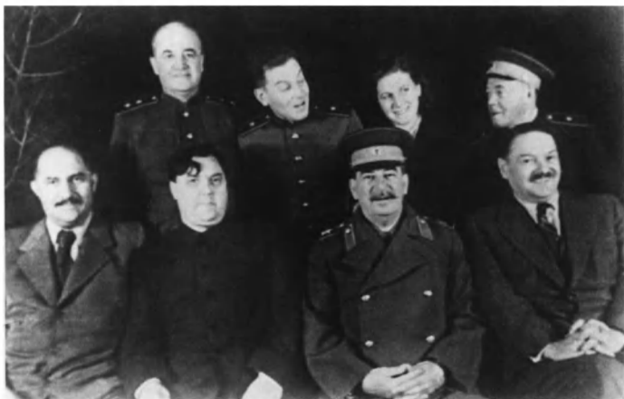
На кунцевской даче, 1 октября 1947 года. В переднем ряду, слева направо: Каганович, Маленков, Сталин и Жданов; в заднем ряду: неизвестный, дети Сталина Василий и Светлана, рядом со Светланой Поскребышев.