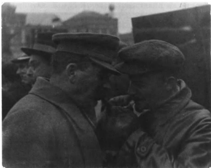
Сталин и его коллега (Так фотография называется в архиве: «коллега» — вероятно, Бухарин, а время — конец 1920-х годов.)