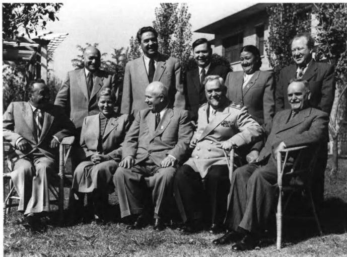
Члены «коллективного руководства» в Китае, 1954 год. Передний ряд: Микоян, Екатерина Фурцева (первый секретарь московской партийной организации), Хрущев, Булганин и Шверник.