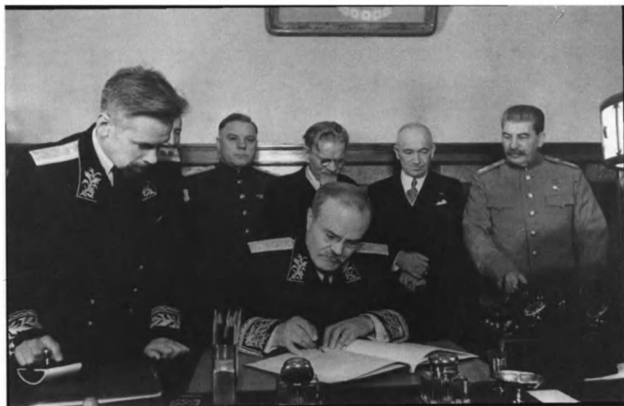
Молотов подписывает советско-чешский договор, 1 декабря 1943 года. На заднем плане: Ворошилов, Калинин и Сталин.