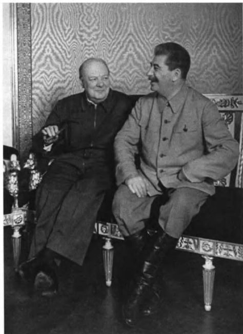
Черчилль и Сталин в Кремле, 1942 год.