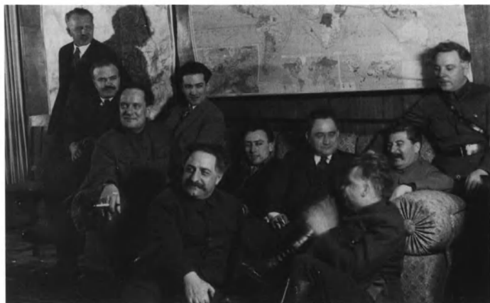
Встреча команды с руководителем Коминтерна, героем дела о поджоге Рейхстага Георгием Димитровым, 1934 год. Орджоникидзе на переднем плане слева, Димитров и Сталин сидят на диване, Молотов и Куйбышев облокотились на диван слева, Ворошилов — справа.