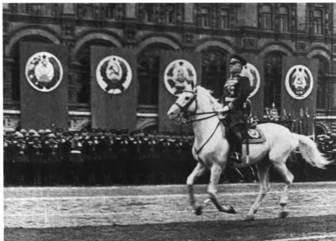
Жуков на белом коне на Параде Победы на Красной площади в Москве, 24 июня 1945 года.