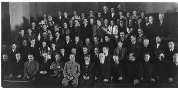
Руководители партии на встрече с народом Западной Украины, 4 октября 1939 года. В переднем ряду слева направо: неизвестный, Шверник, Андреев, Молотов, Ворошилов, Сталин, Калинин, академик Цицинов, неизвестный, Каганович, Жданов, Маленков и Хрущев.