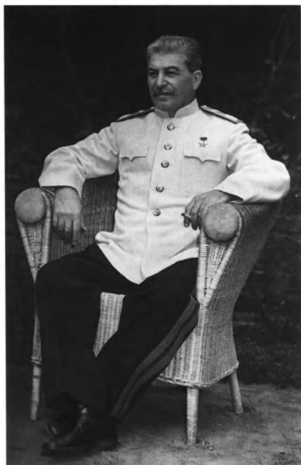
Сталин на Потсдамской конференции, 1945 год.