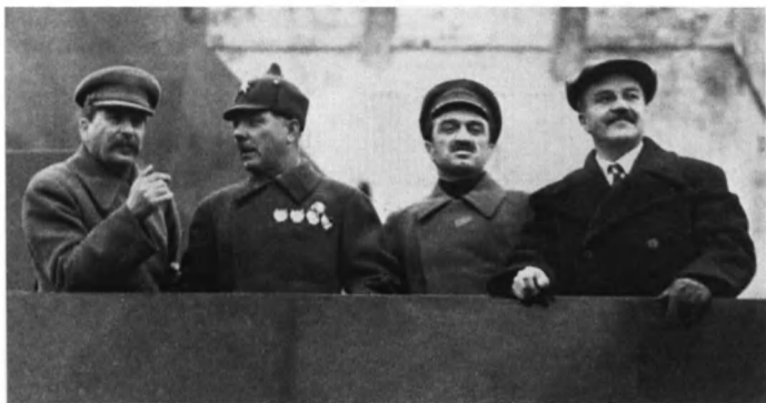
Сталин, Ворошилов, Микоян и Молотов на трибуне Мавзолея на праздновании восемнадцатой годовщины революции, 7 ноября 1935 года.