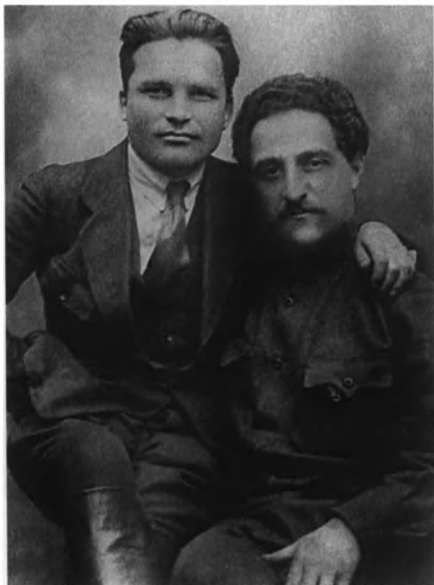
Сергей Киров и Серго Орджоникидзе, 1920 год.