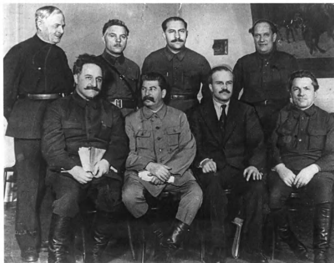
Вожди на XVII партийном съезде, 1934 год. Второй ряд слева направо: Енукидзе, Ворошилов, Каганович и Куйбышев; передний ряд: Орджоникидзе, Сталин, Молотов и Киров.