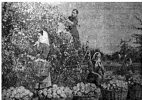
Сбор яблок в колхозах Винницкой обл.

Резко сократились потери сельхозпродукции. Началась борьба с погодно-климатическими невзгодами. На колхозных полях производились снегозадержательные, ирригационные и осушительные мероприятия. Велась борьба с «черными бурями» и «суховьями» – вдоль дорог сажались известные «сталинские лесополосы». На засушливых полях устраивался искусственный полив. При нападении вредителей производилась химическая обработка растений.