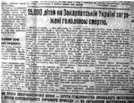
15000 детям в Закарпатье угрожает голодная смерть

Румыния ожидают случая, чтобы напасть на Советскую Украину». В статье «15000 детям в Закарпатье угрожает голодная смерть» («УЩВ» 05.04.32 р., ф.16.5) излагаются заявления депутатов оппозиционных партий в чешском парламенте. «В горных округах много сел, где пища детей состоит из незначительного количества овсяного хлеба и нескольких полусгнивших картофелин. Цены на домашних животных и имущество необыкновенно низкие из-за высоких налогов: корова – 3 долл., конь – 20 центов. Чешская власть виновата, перед Украинским Закарпатьем и тем, что в эту бедную провинцию, где недостаточно хлеба для полумиллионного населения, переселила 50 тысяч чешских колонистов, в основном бывших военных и госслужащих, которые с жестокостью средневековых завоевателей осуществляют там политику чехизации и экономической эксплуатации».