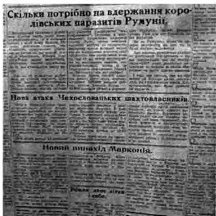
Сколько необходимо на содержание королевских паразитов Румынии

Апрель 1933 г. Румынские, Австрийские, Венгерские и Украинские газеты сообщали о массовой смертности населения на почве голода в боярской Румынии. Более 120 тысяч детей там умирают