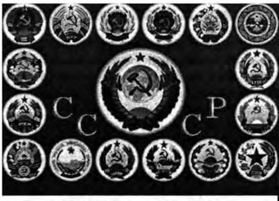
Герб СССР и союзных республик

7. Литовская ССР, Латвийская ССР и Эстонская ССР вошли в состав СССР в 1940 году. До вхождения в состав СССР Латвия была вымирающей страной. В составе СССР она начала возрождаться, численность ее населения выросла с 1,9 млн в 1940 г. до 2,7 млн чел. в 1988 г., или в полтора раза. После выхода Литвы из состава СССР ее население сократилось до 2,3 млн человек; она опять превратилась в вымирающую страну.