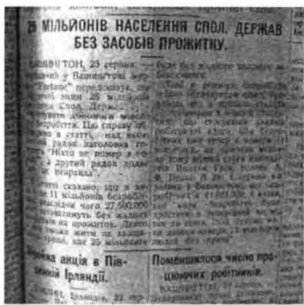
70 000 000 населения мира страдают от кризиса капитализма