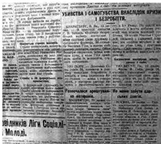
Убийства и самоубийства, как следствие кризиса и безработицы

В подшивке этой газеты за 1932 г., хранящейся в Национальной библиотеке США, и других стран, более 200 сообщений о голодных походах рабочих и безработных в различных штатах, более 170 – о самоубийствах в связи с кризисом, безработицей и голодом: банкиров, предпринимателей, фермеров, рабочих и безработных в Европе и США. («УЩВ» 20.07.32 р., фото ниже.)