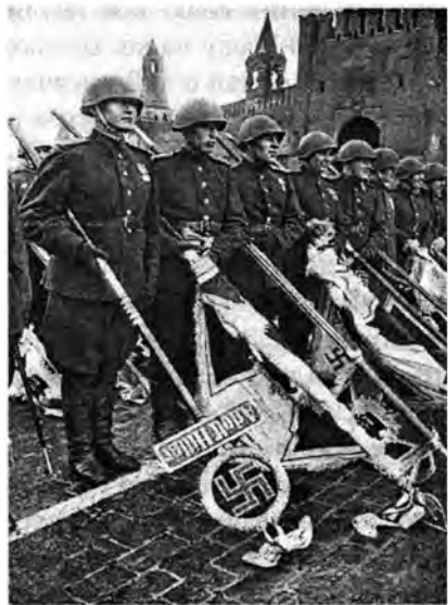
Повергнутые фашистские штандарты у Кремлёвской стены

При Сталине успешно закончилась суровая борьба с силами, пытавшимися реставрировать капитализм в СССР, вернуть страну в эпоху господства частной собственности, в эпоху кризисов, безработицы и нищеты, вернуть страну в эпоху экономической отсталости.