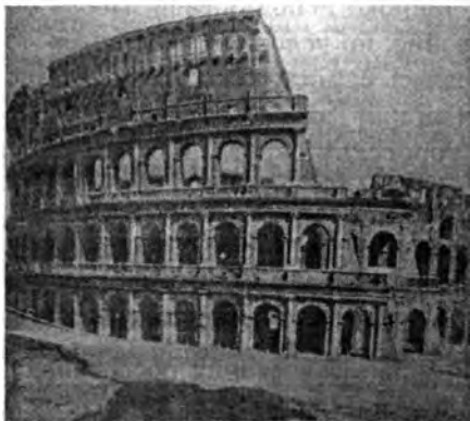
Фото 1. Колизей (амфитеатр Флавиев в Риме). 75-82 г. Современность.

Позже, при распределении рабов и земли, в период разложения родового строя, формирования у индийцев рабовладельческого способа производства и рабовладельческого государства, образовались варны (касты) . Они сложились как замкнутые социальные группы, неравные по своему социальному правовому положению и тем привилегиям, которыми наделялись их члены. Земля и монополии постепенно перешли в частные руки. Единое государство распалось и на его месте образовалось большое число самостоятельных государств. Острая классовая борьба во II-I вв. до н.э. отразила глубокий кризис рабовладельческого хозяйства в индийских государствах, которые вновь стали легкой добычей завоевателей.