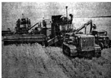
Сбор зерновых комбайнами в колхозе им. Энгельса. Николаевская обл.

Таблица показывает динамичный рост численности тракторов в сельском хозяйстве на 229,3 %, мощность их выросла на 288,4 % по сравнению с 1933 г. Численность тракторов в сельском хозяйстве СССР и их мощность с каждым годом росла, и в 1988 году, перед преднамеренным развалом социалистической страны, составляла 2 269,3 тыс. штук (НХ СССР в 1988 г., с. 441, М., 1989).