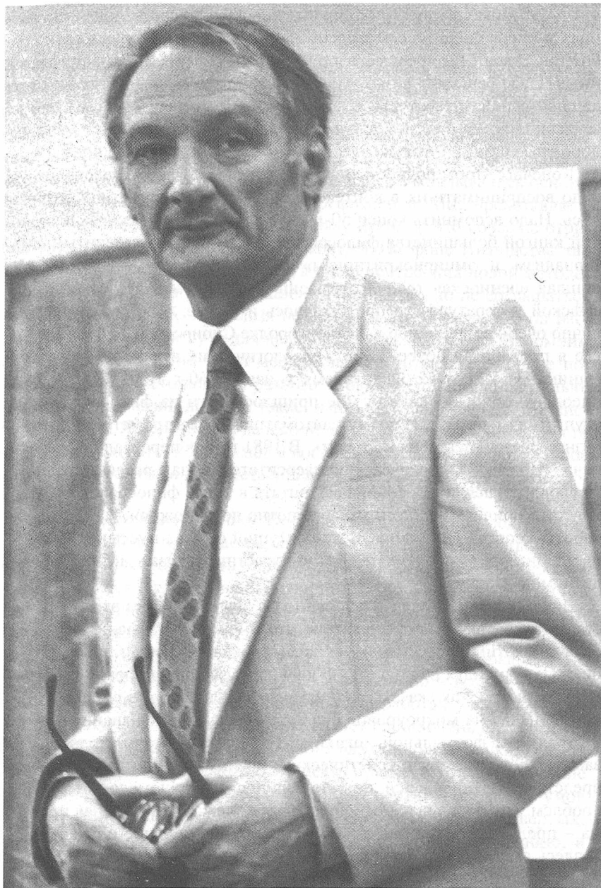
Георгий Петрович Щедровицкий