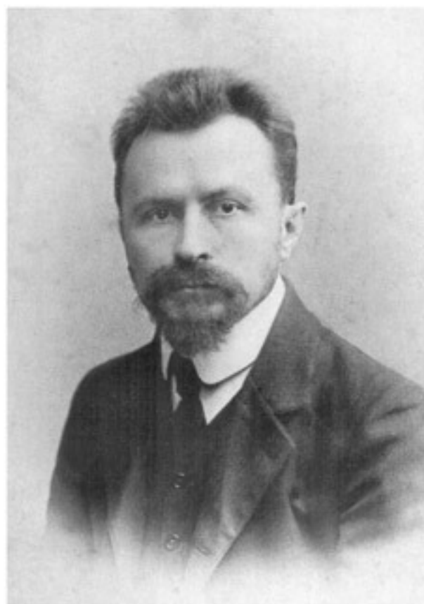
Сергей Николаевич Булгаков