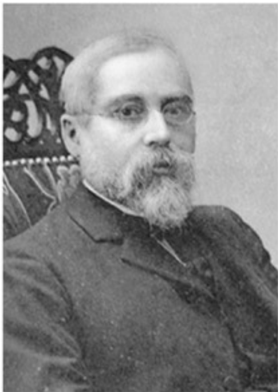
Сергей Андреевич Муромцев