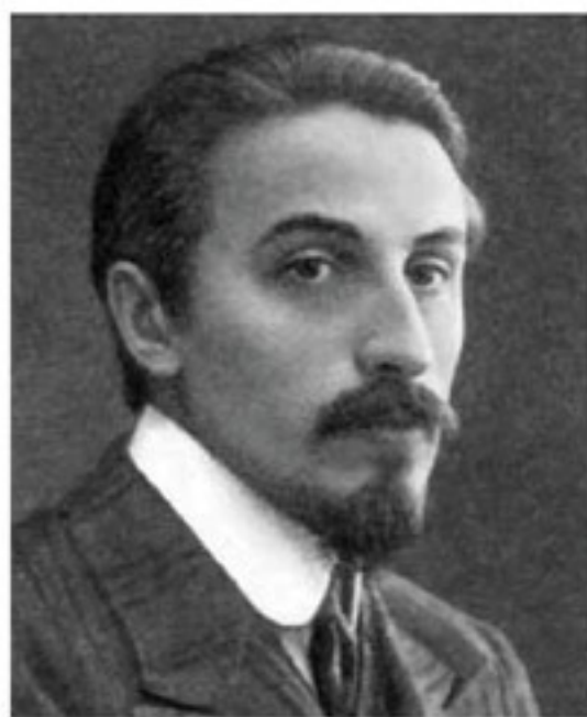
Борис Константинович Зайцев