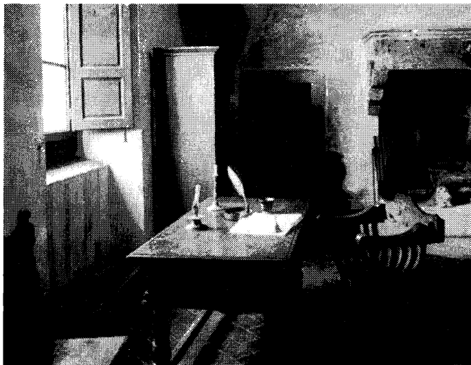
Рис. 5. Рабочий стол Макиавелли в его доме в Сан-Андреа (Перкусина, юг Флоренции). Здесь в 1513 г. был написан трактат «Государь»