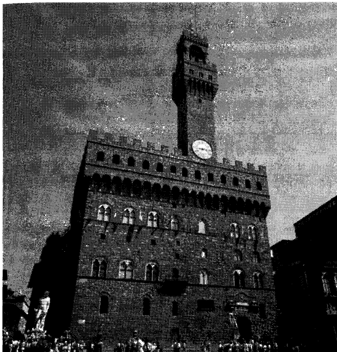
Рис. 1. Палаццо Веккьо, Флоренция. Здесь размещалась Вторая канцелярия, в которой Макиавелли работал с 1498 по 1512 г.