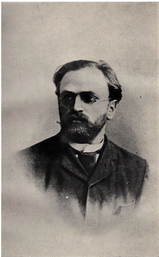
Д. Б. Рязанов (1891 г.)