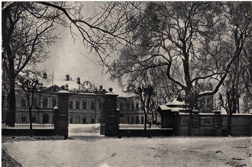
Здание Института К. Маркса и Ф. Энгельса.