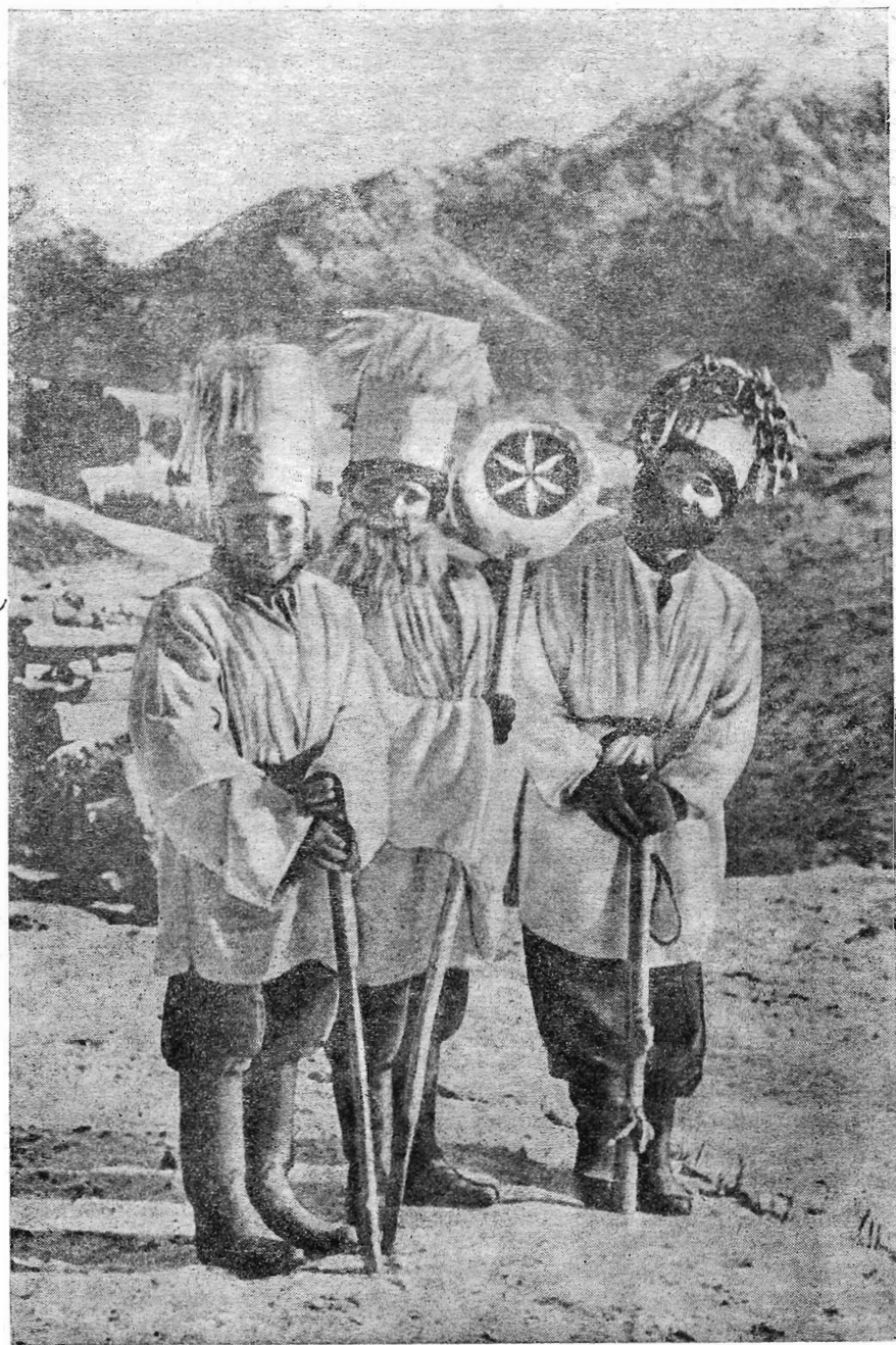
Подростки — участинки святочных обходов со «звездой» Западная Словакія. Село Терхова по р. Варинке, воев. Жиллина Slovenské ľudové plesue. Red. Fr. Poloczek. Sv. 2, Bratislava, 1952